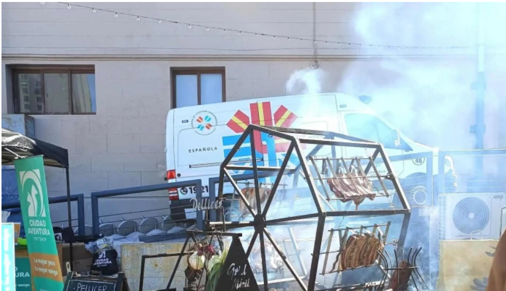
Punta carretas shopping comentario 4