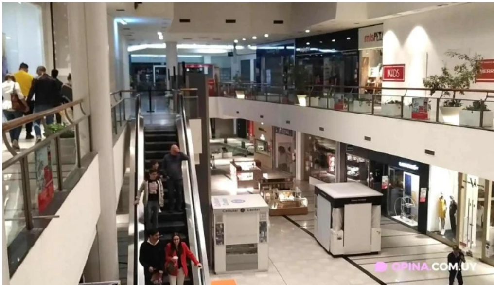
Punta carretas shopping videos