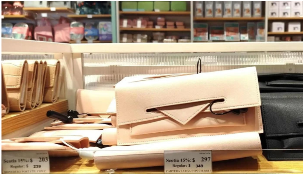
Punta carretas shopping comentario 8