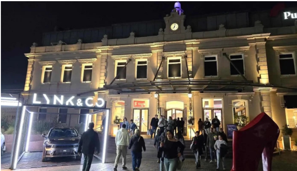
Punta carretas shopping recientes