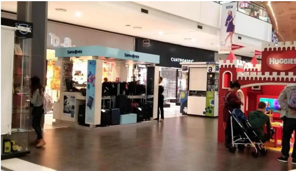
Punta carretas shopping interior