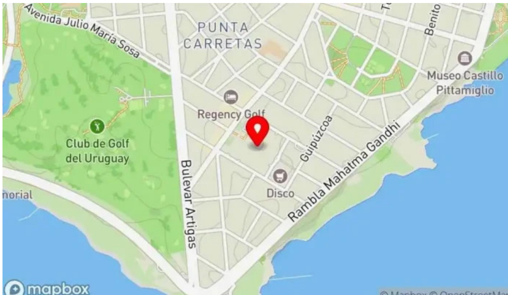
Punta carretas shopping mapa