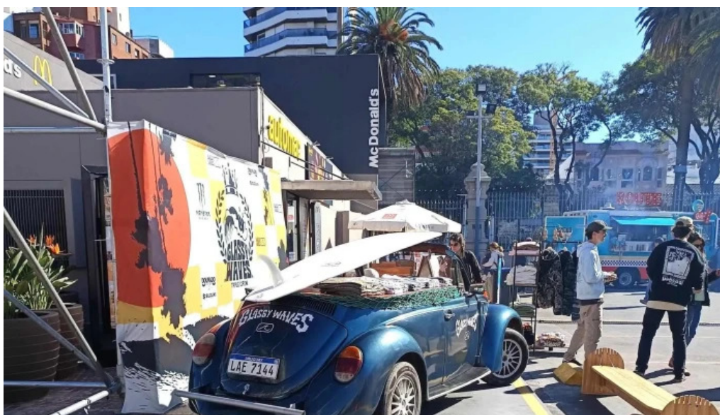
Punta carretas shopping comentario 2