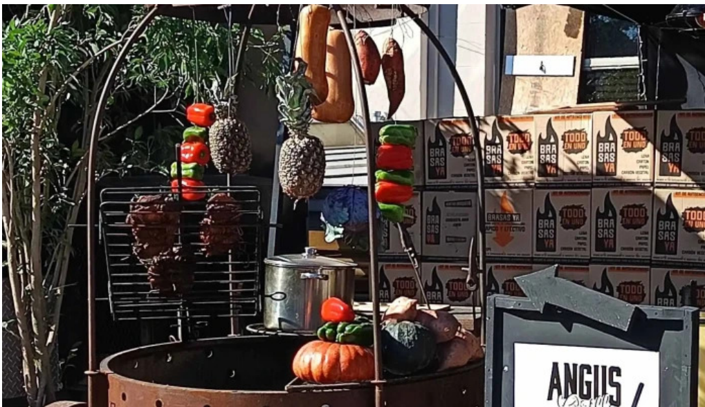
Punta carretas shopping comentario 3