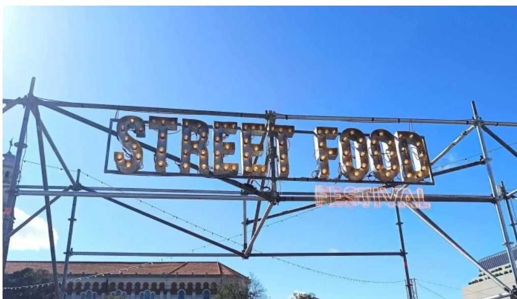
Punta carretas shopping comentario 1