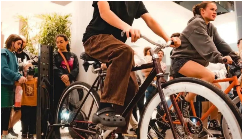
Punta carretas shopping del propietario