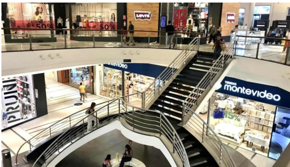
Punta carretas shopping todo