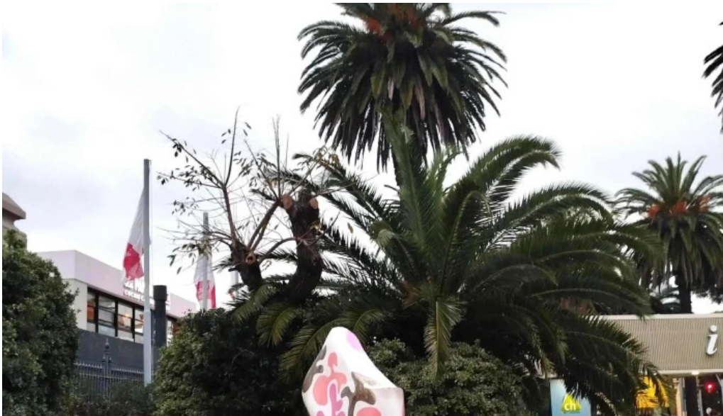
Punta carretas shopping comentario 6