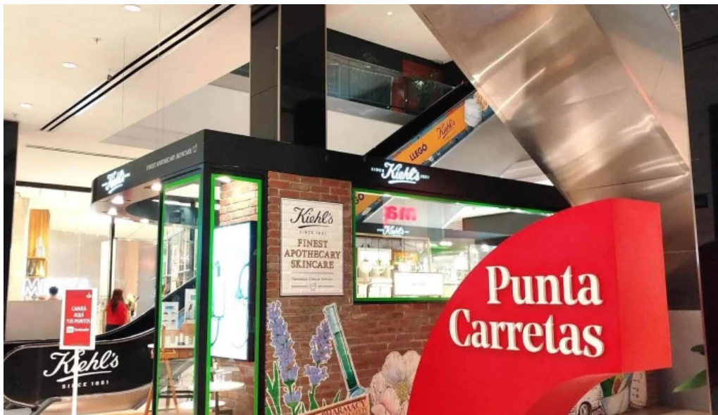
Punta carretas shopping comentario 7