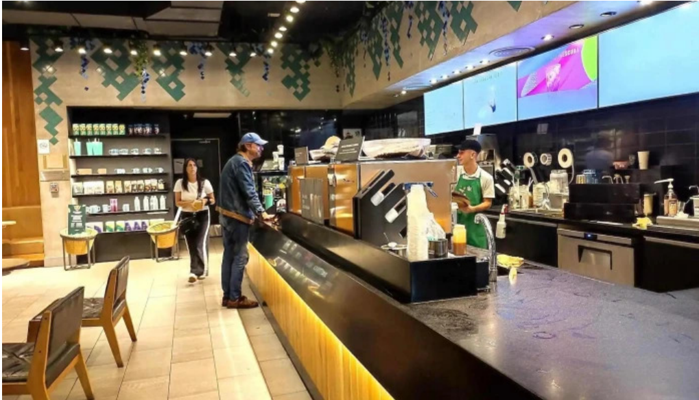
Punta carretas shopping restaurante