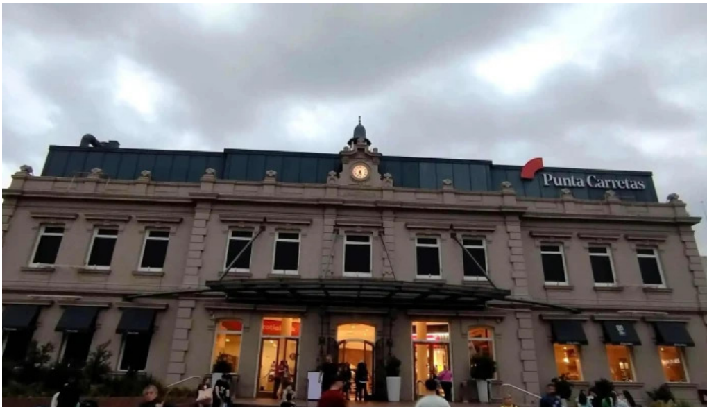
Punta carretas shopping comentario 5