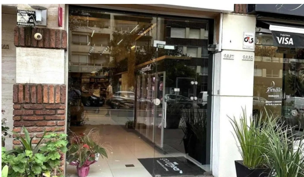
Gourmeat del propietario