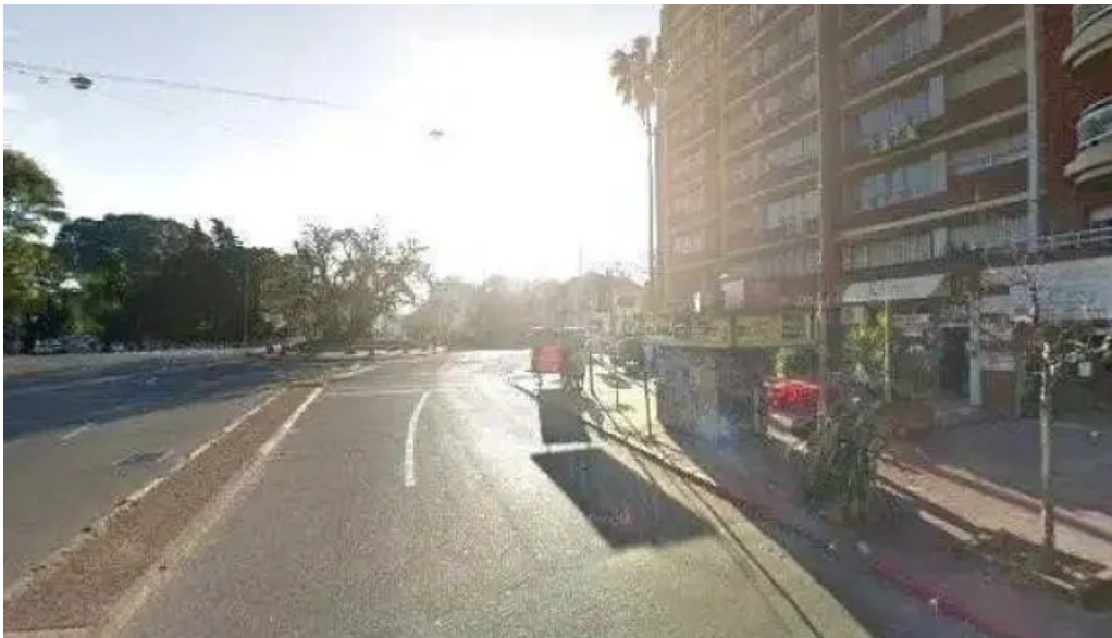
Gourmeat street view y 360