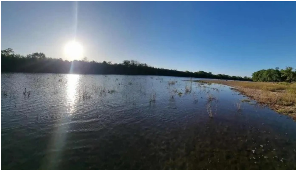
Camping aguas corrientes rio