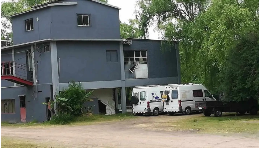
Camping aguas corrientes todas