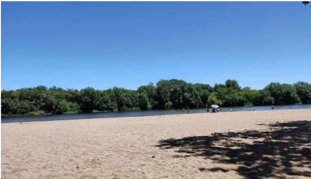
Camping aguas corrientes de los visitantes