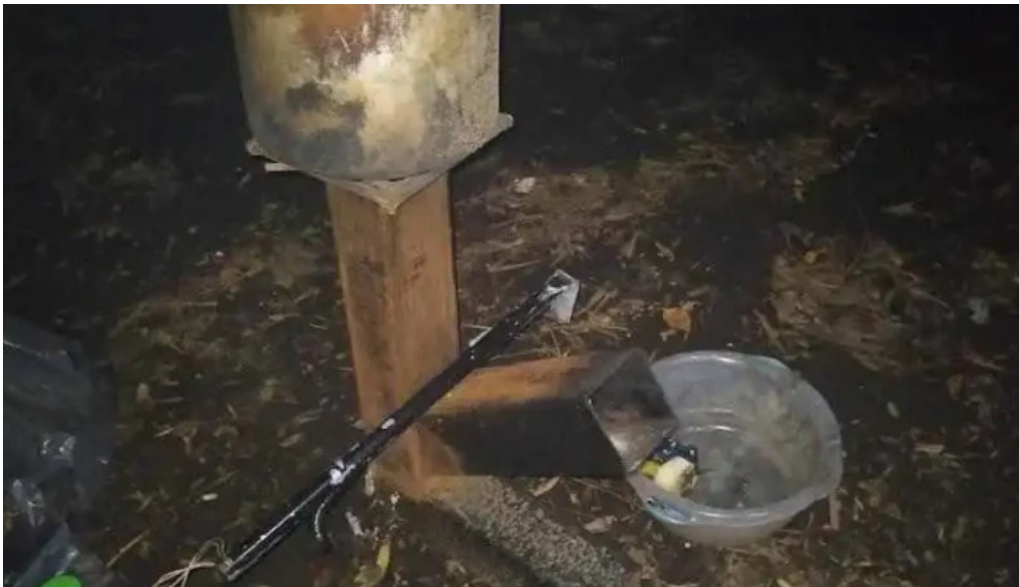
Camping aguas corrientes mas recientes