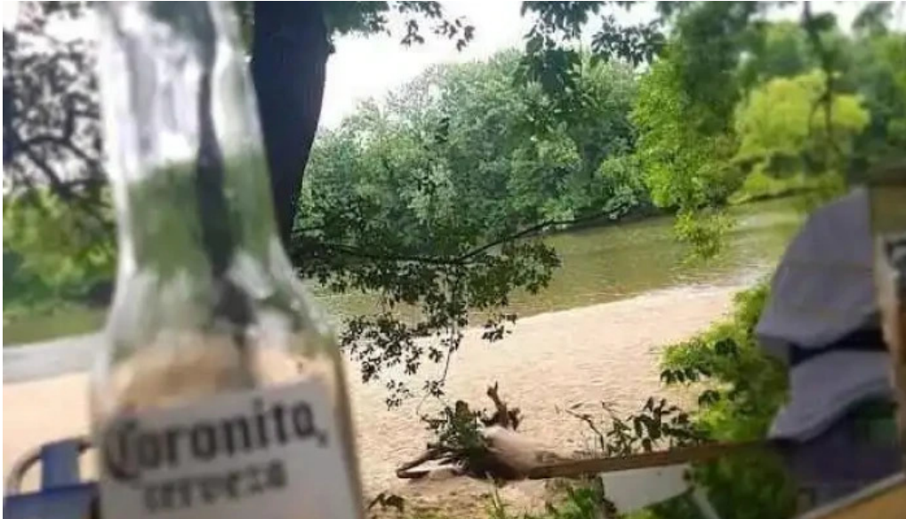
Camping aguas corrientes comida y bebida