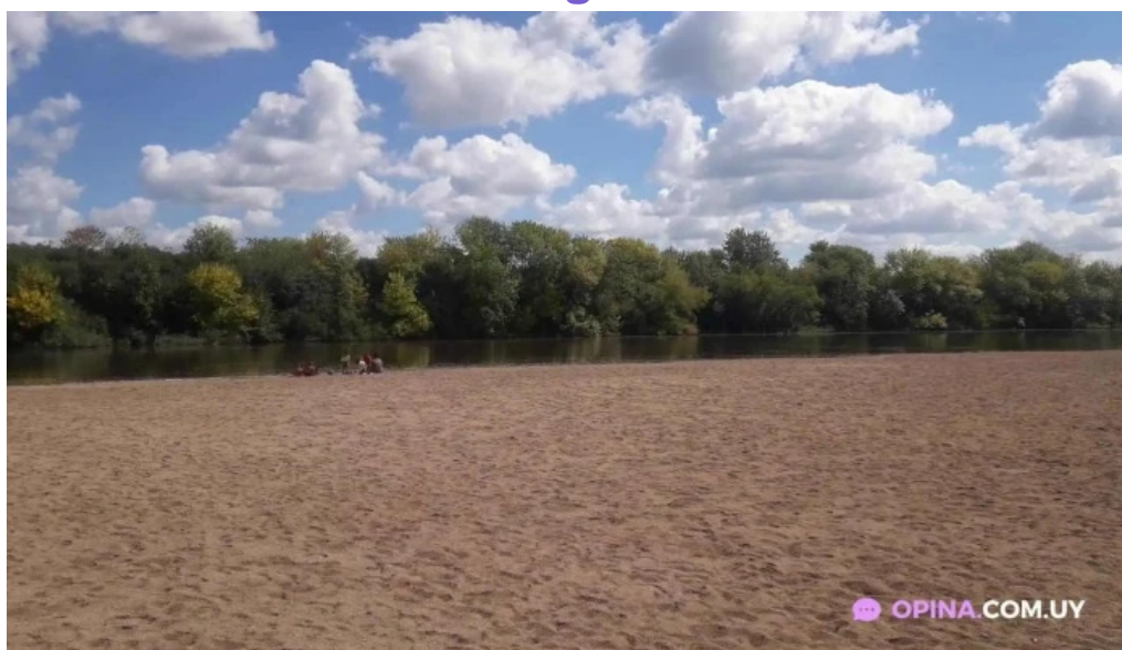
Camping aguas corrientes videos