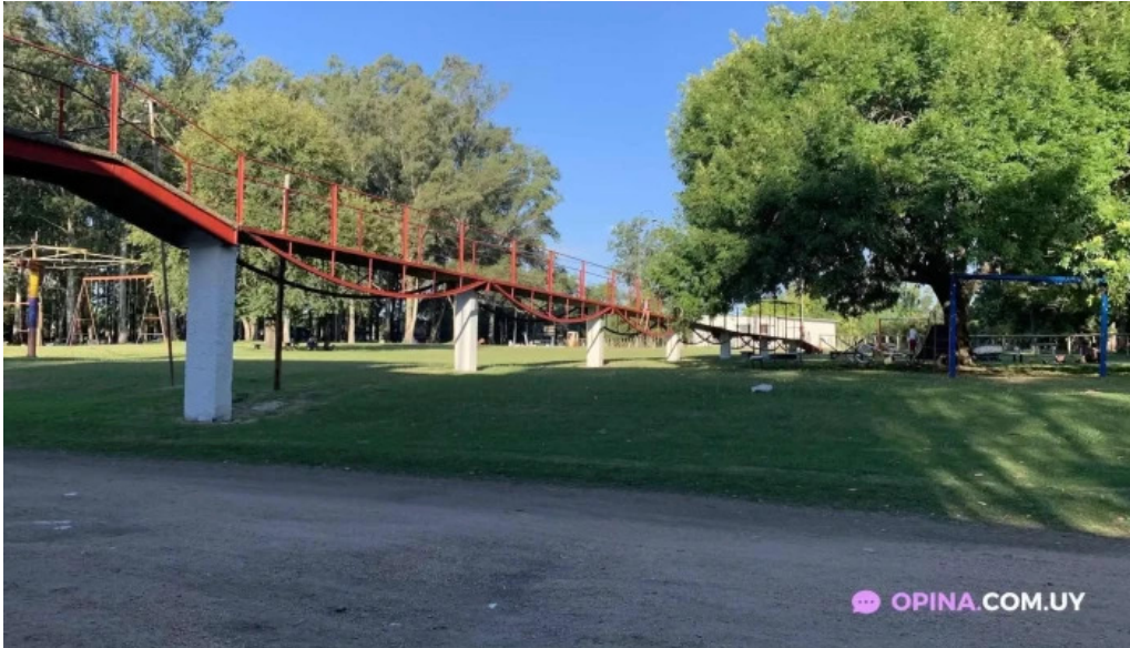
Camping aguas corrientes exterior