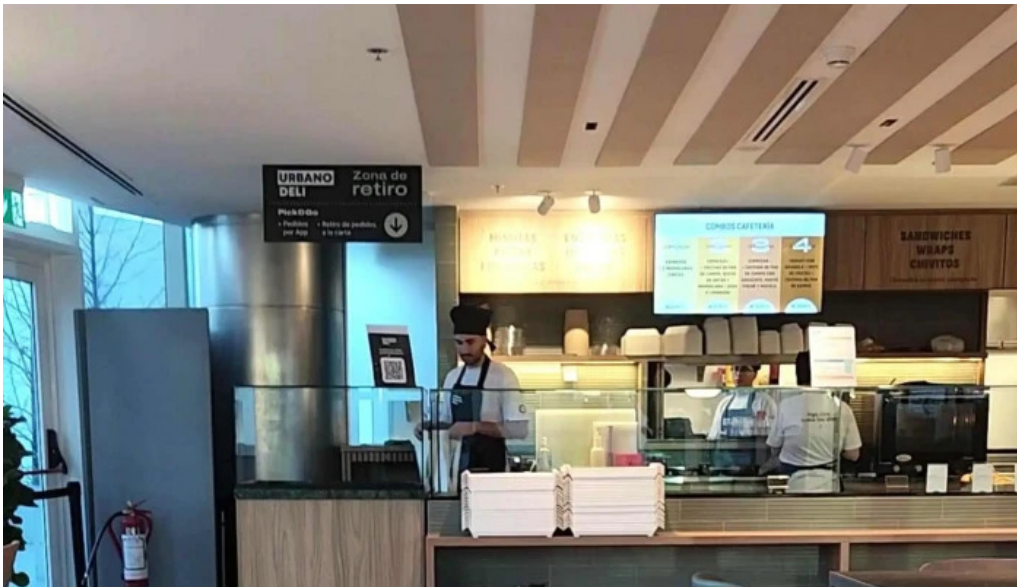
Urbano deli comentario 8