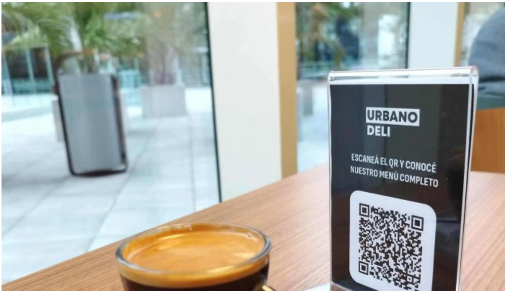
Urbano deli comentario 1