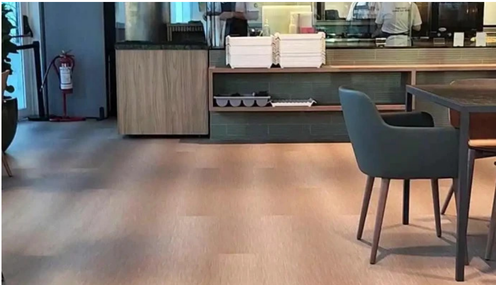
Urbano deli ambiente