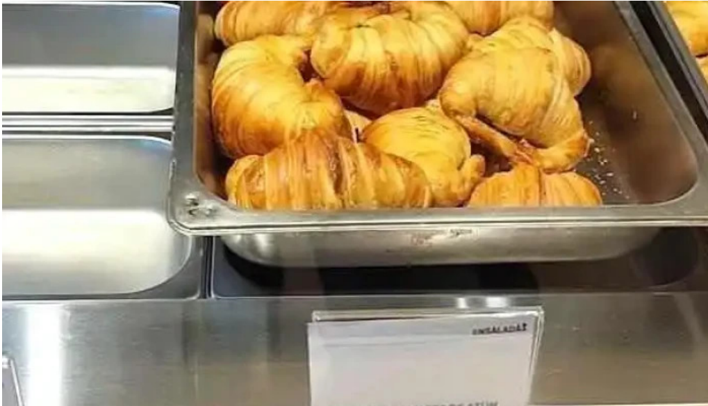
Urbano deli montevideo