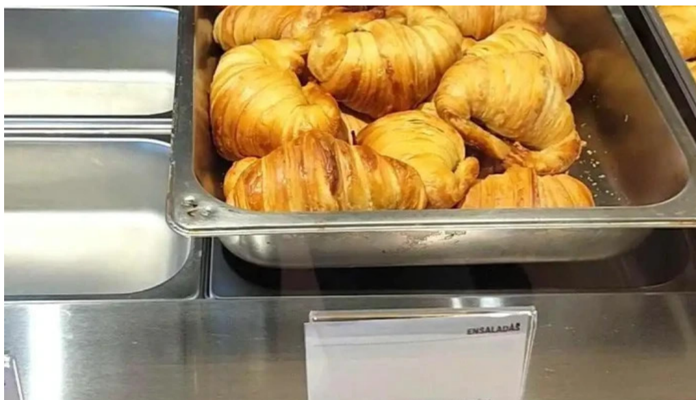
Urbano deli todo