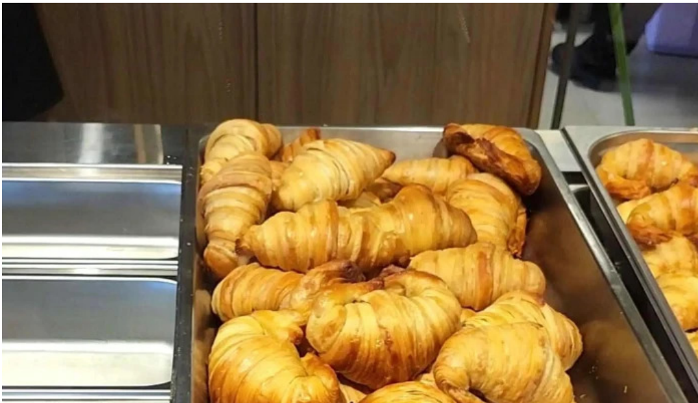
Urbano deli comentario 7