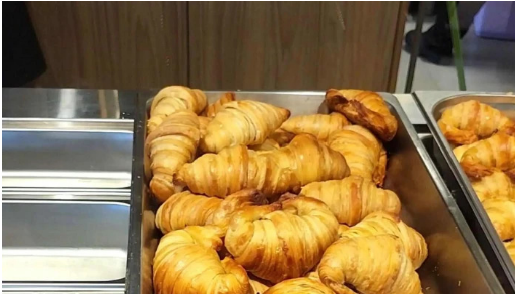
Urbano deli comentario 2