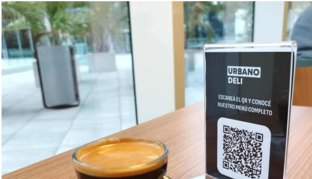
Urbano deli comentario 6