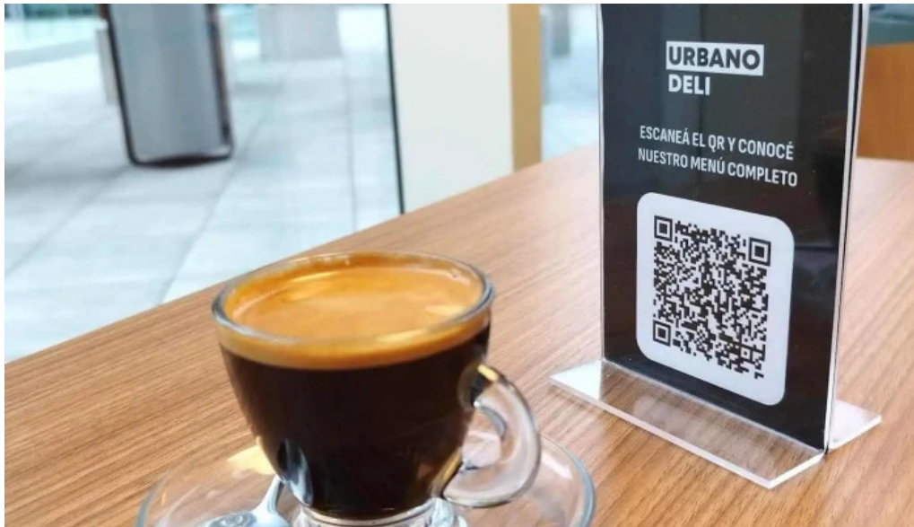
Urbano deli comidas y bebidas