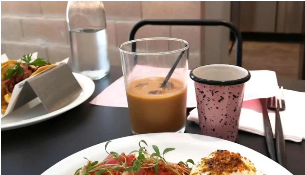
Sometimes sunday cafe