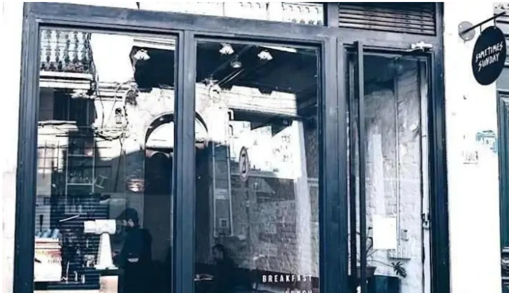
Sometimes sunday montevideo