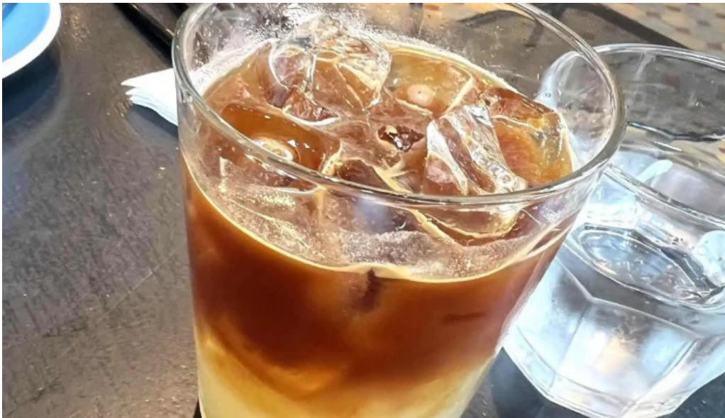
Sometimes sunday cafe con hielo