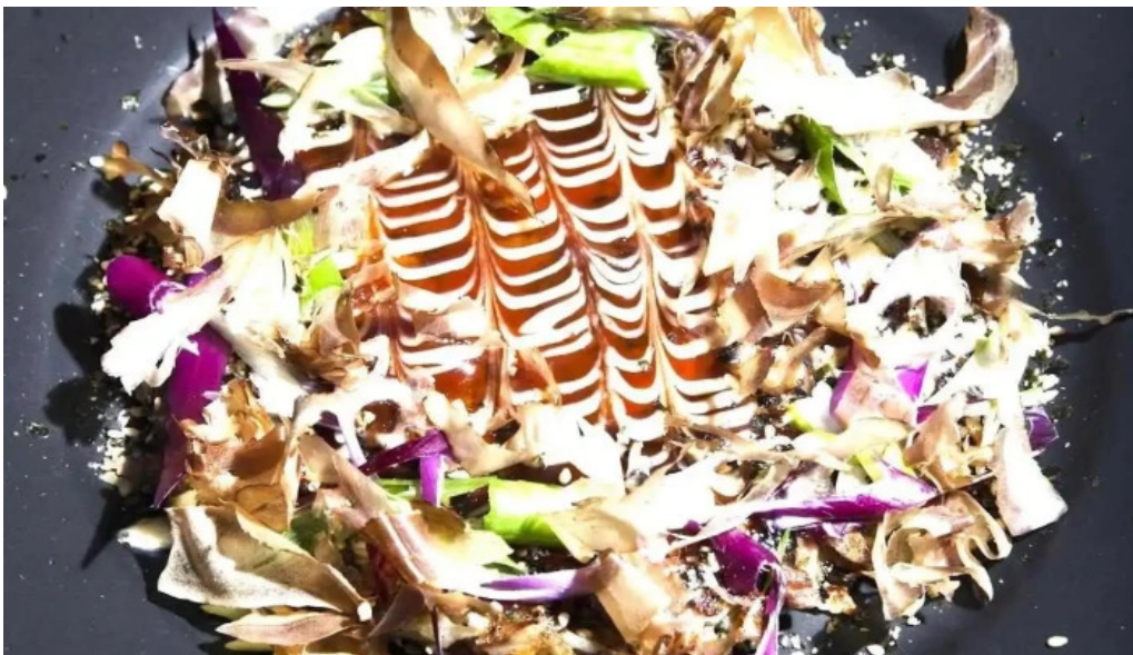
Sometimes sunday okonomiyaki