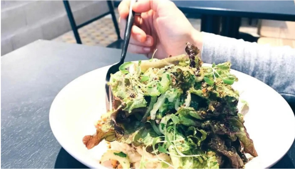
Sometimes sunday comidas y bebidas