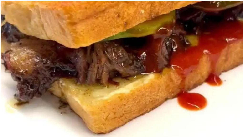
Sometimes sunday del propietario