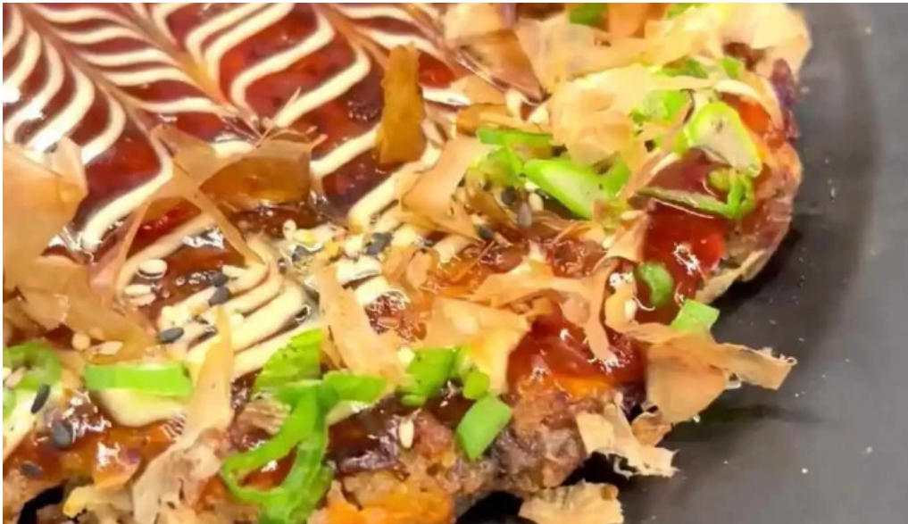
Sometimes sunday videos