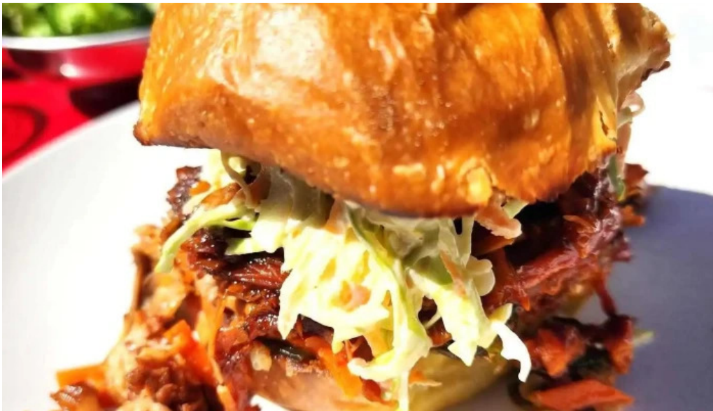
Sometimes sunday pulled pork