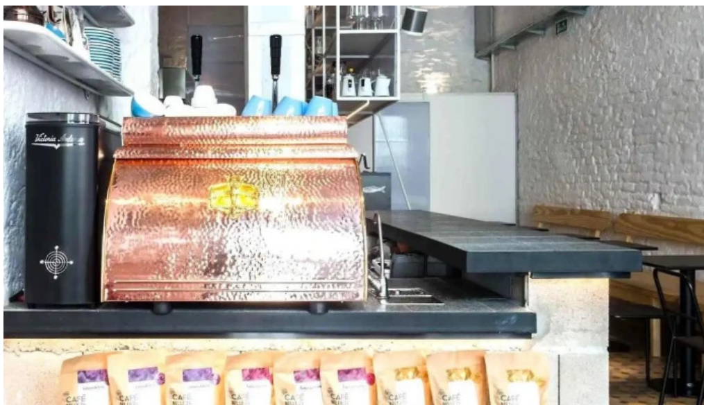
Sometimes sunday ambiente