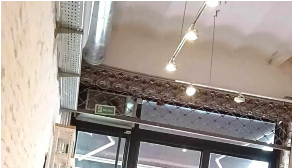
Sometimes sunday comentario 1