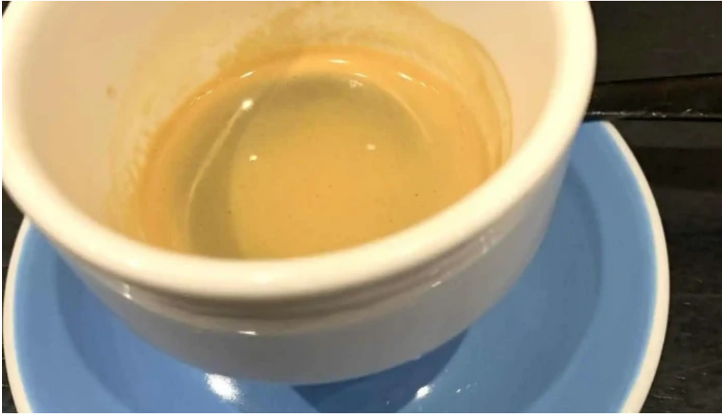
Sometimes sunday cafe expreso