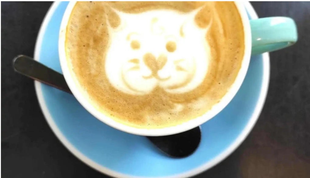
Sometimes sunday capuchino