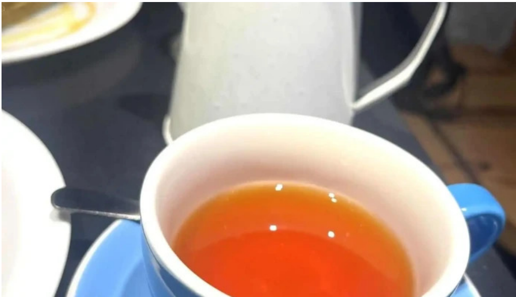
Sometimes sunday recientes