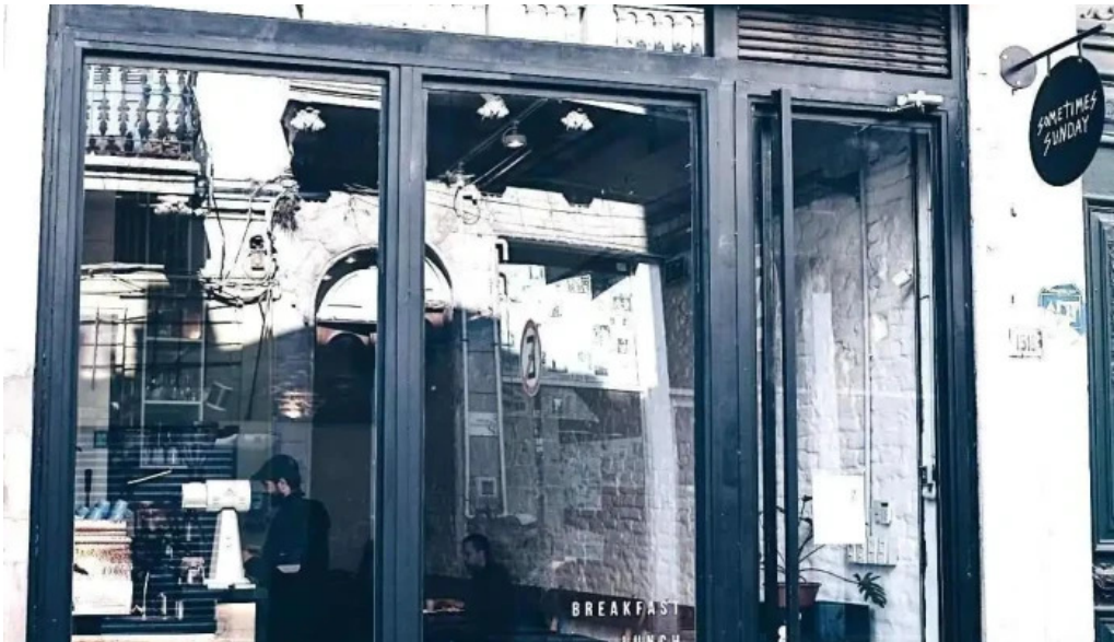
Sometimes sunday todo