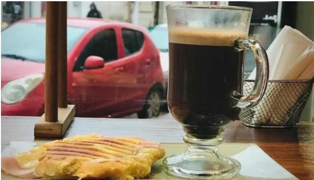
Simple casa de comidas cafe