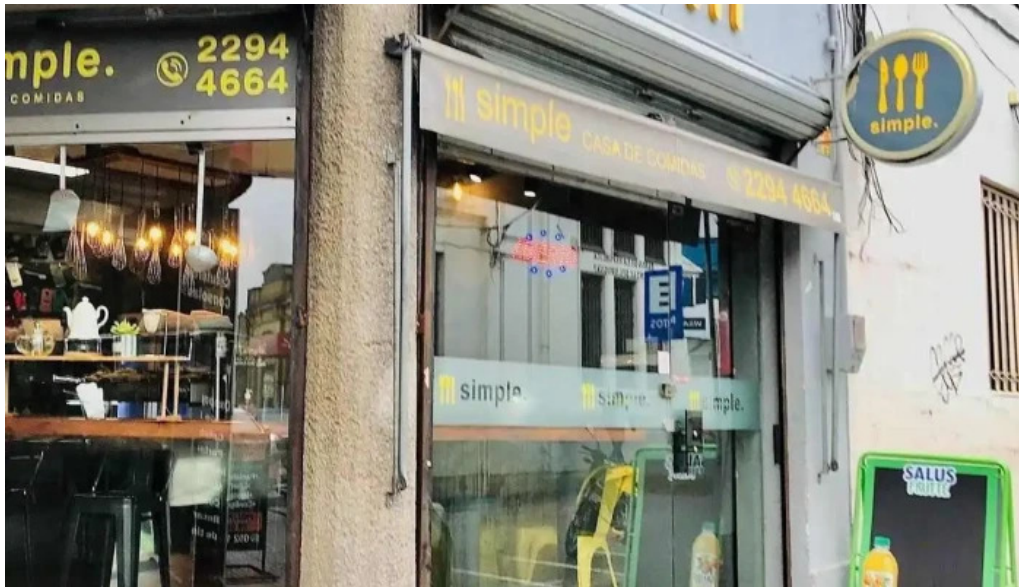
Simple casa de comidas pando