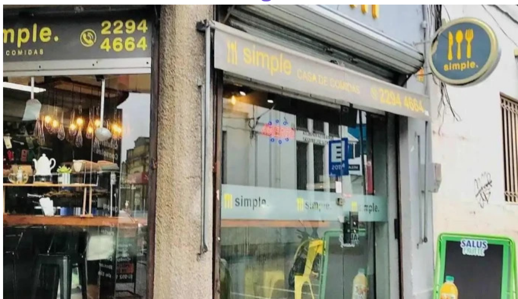
Simple casa de comidas todas