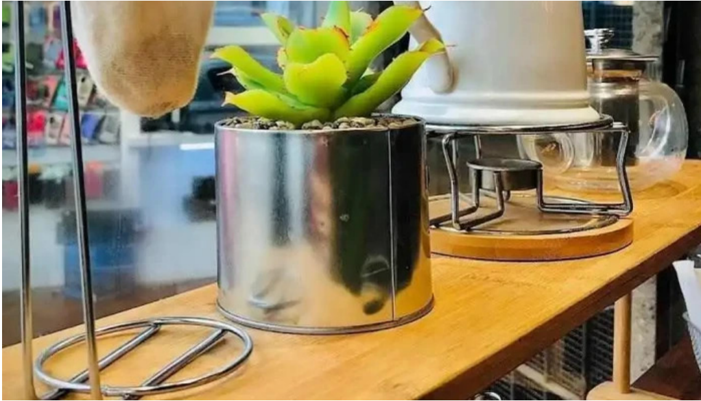
Simple casa de comidas comida y bebida