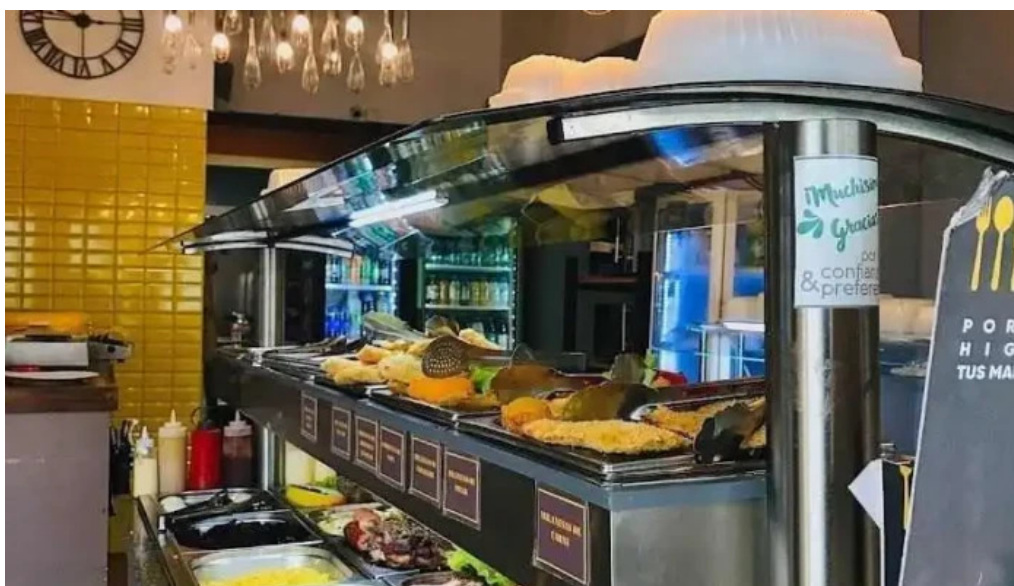
Simple casa de comidas ambiente