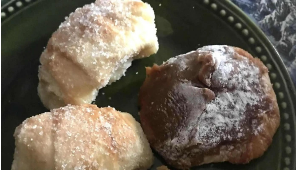
Porto vanilla express comentario 5