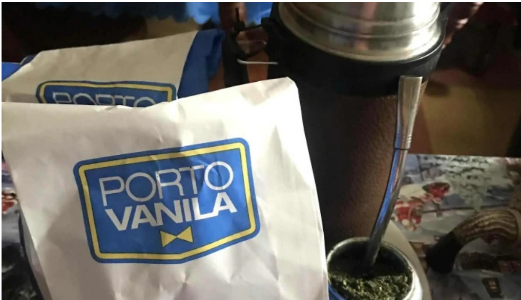
Porto vanila express comentario 9