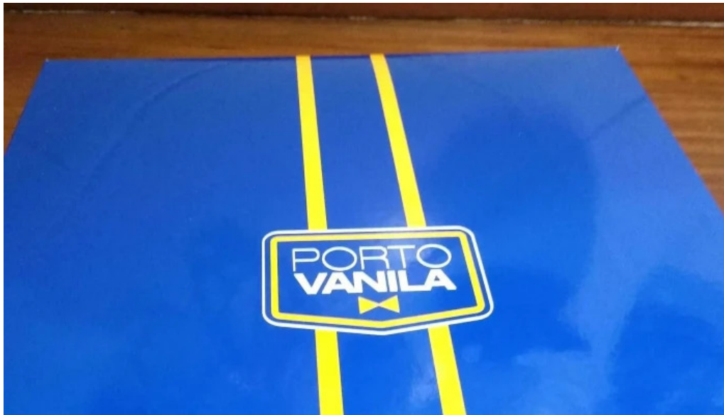
Porto vanila express comentario 7