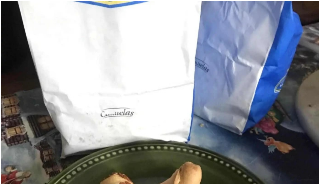
Porto vanilla express comentario 10