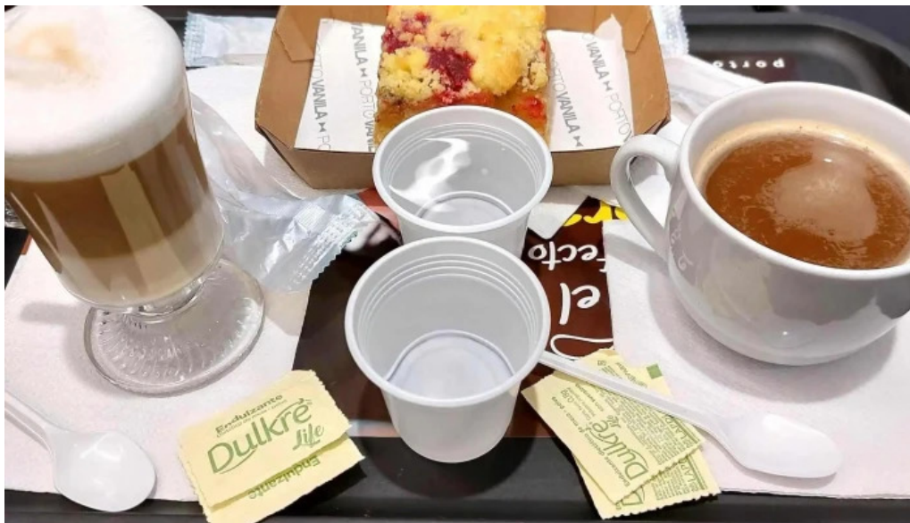
Porto vanilla express comidas y bebidas