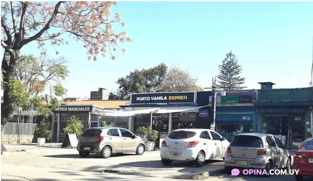
Porto vanila express montevideo