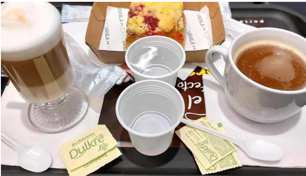
Porto vanila express comentario 8