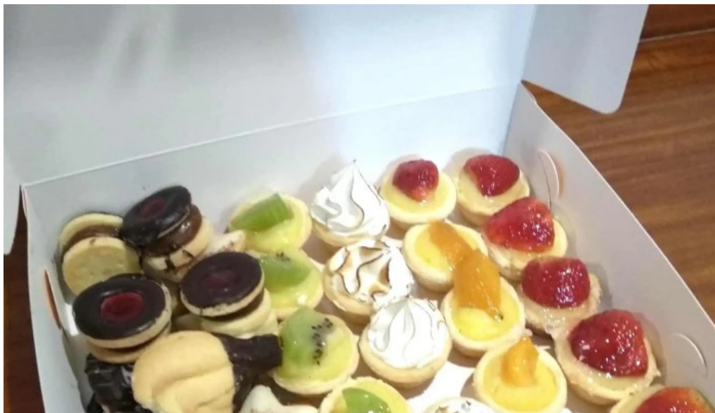
Porto vanila express comentario 6