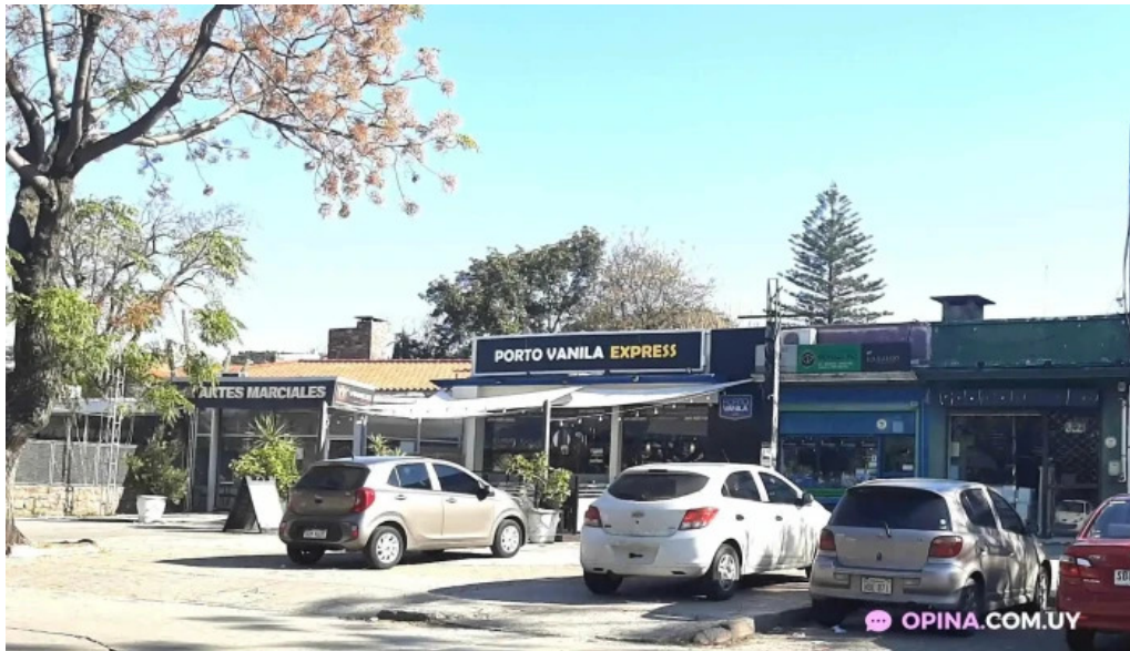
Porto vanila express todo