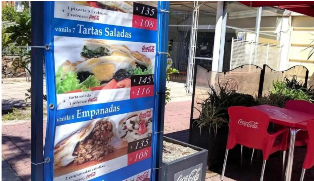
Porto vanila express ambiente