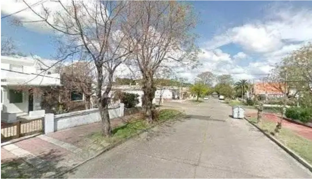
Calma gluten free street view y 360