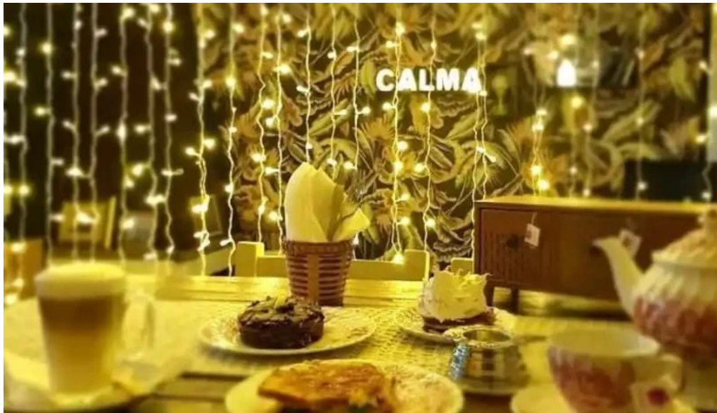
Calma gluten free comida y bebida