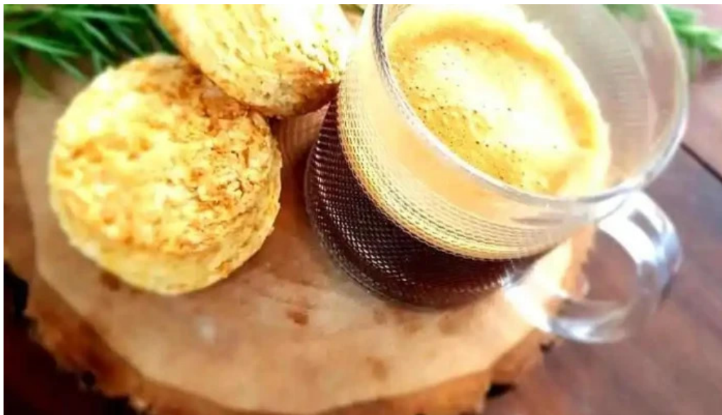
Calma gluten free cafe