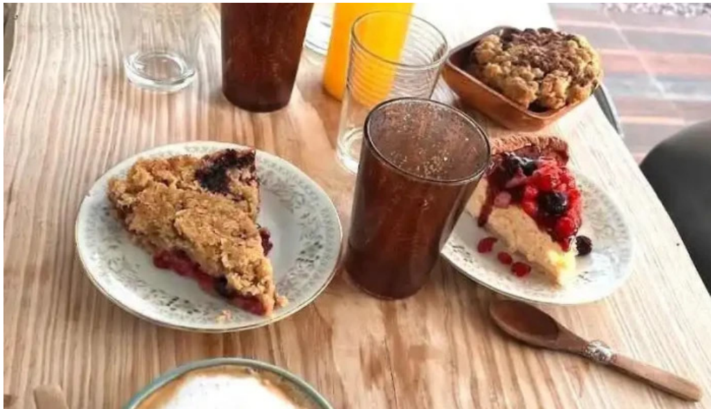
Calma gluten free jugo