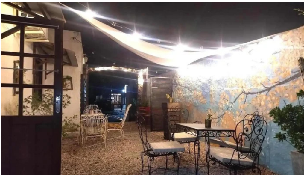
Calma gluten free ambiente