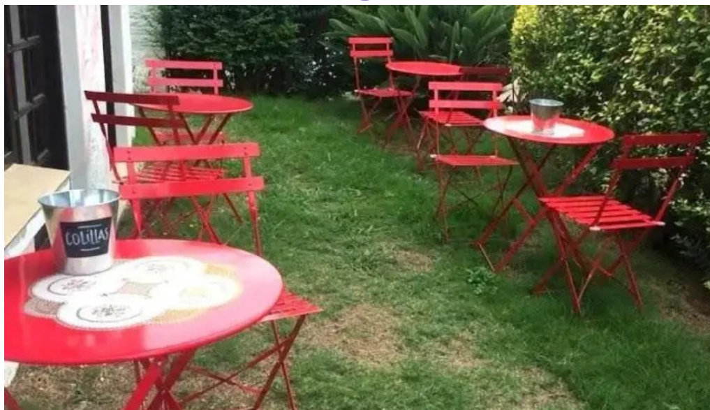
Calma gluten free todas