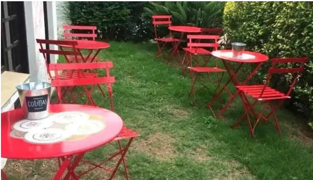
Calma gluten free piriapolis