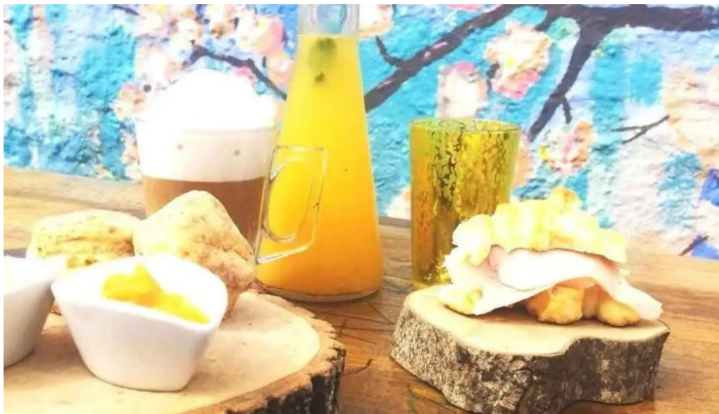
Calma gluten free del propietario