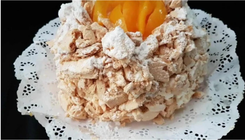
Confiteria la familia del propietario