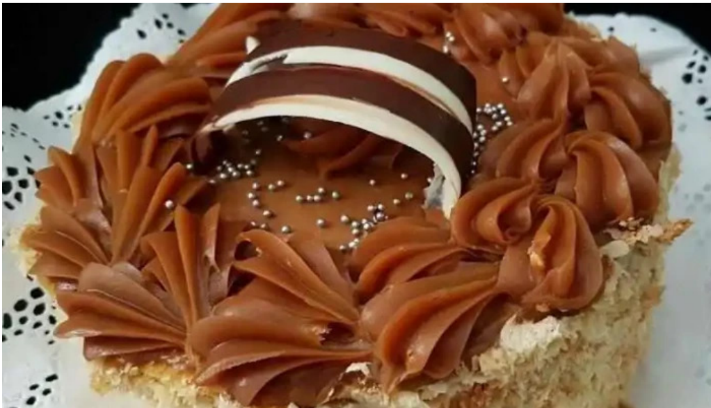
Confiteria la familia comida y bebida