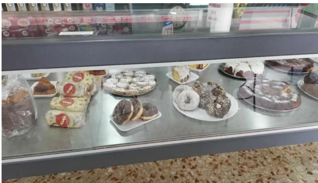
Confiteria la familia ambiente