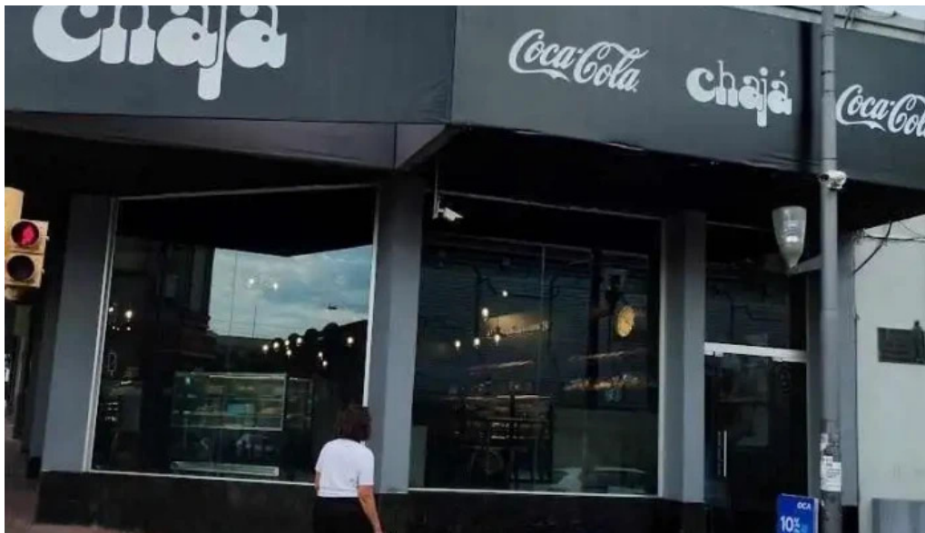
Confiteria la familia mas recientes