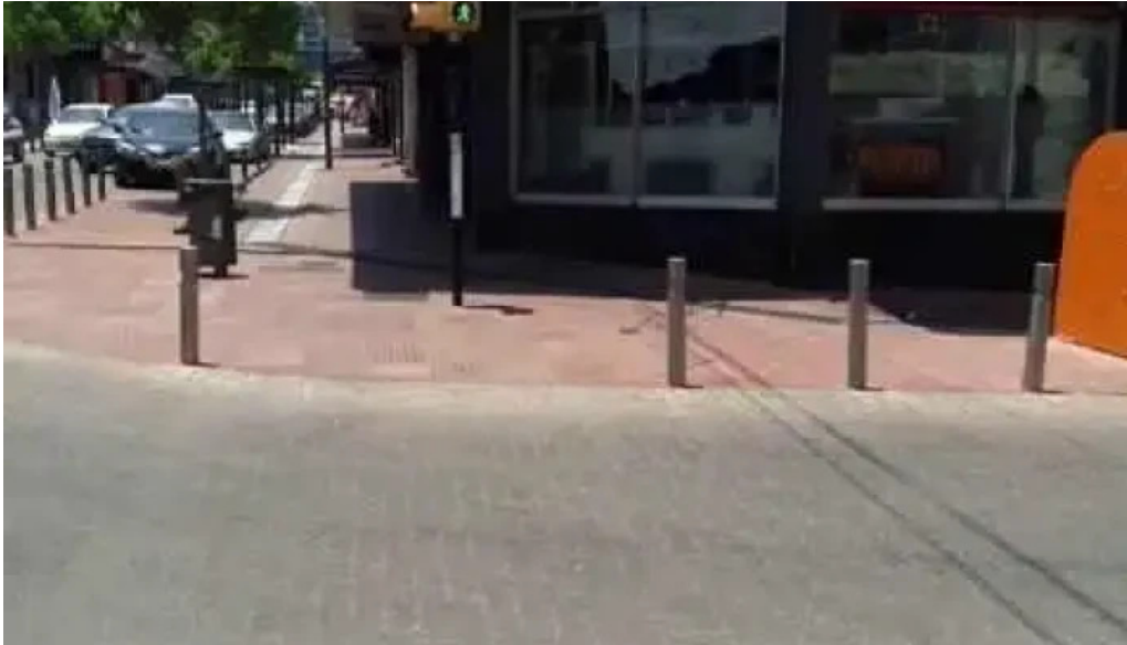
Confiteria la familia videos