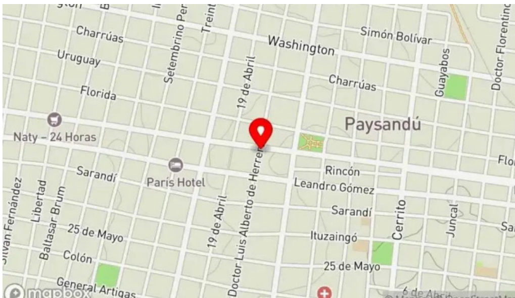
Confiteria la familia mapa