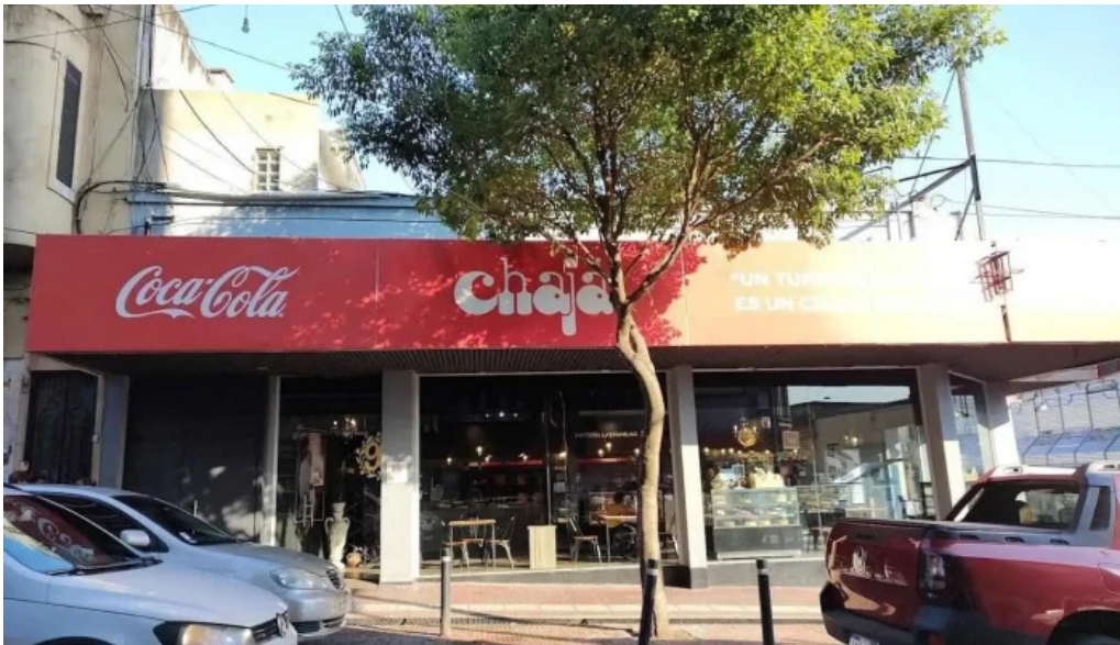
Confiteria la familia paysandu