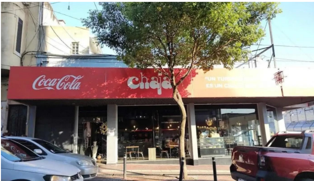
Confiteria la familia todas