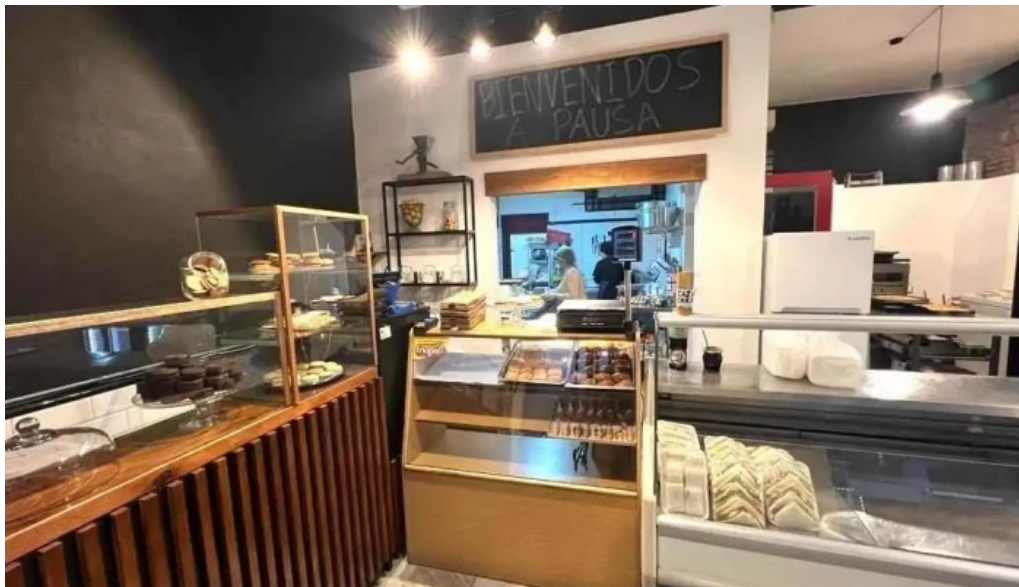
Pausa cocina y cafe todo