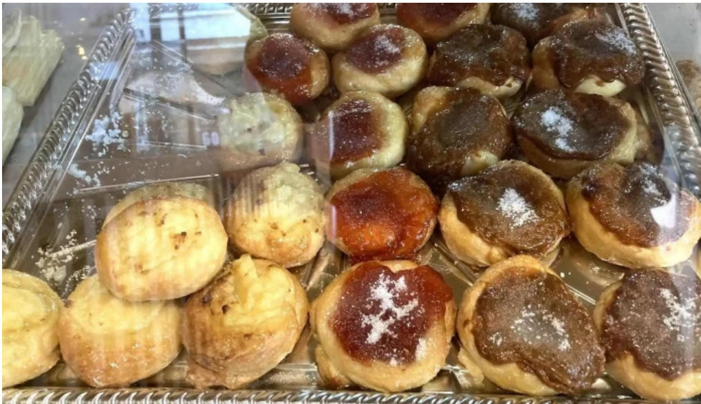
Pausa cocina y cafe comidas y bebidas