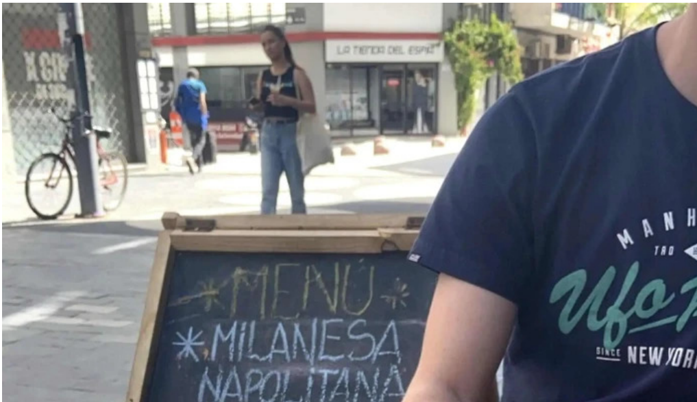
Pausa cocina y cafe comentario 5