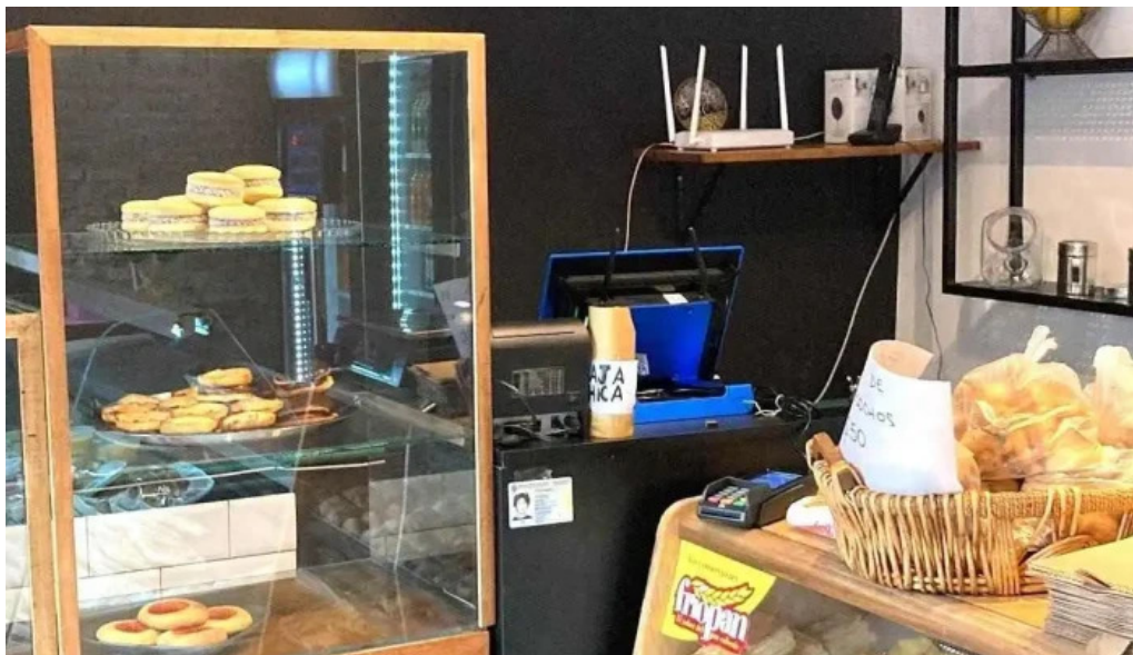
Pausa cocina y cafe ambiente