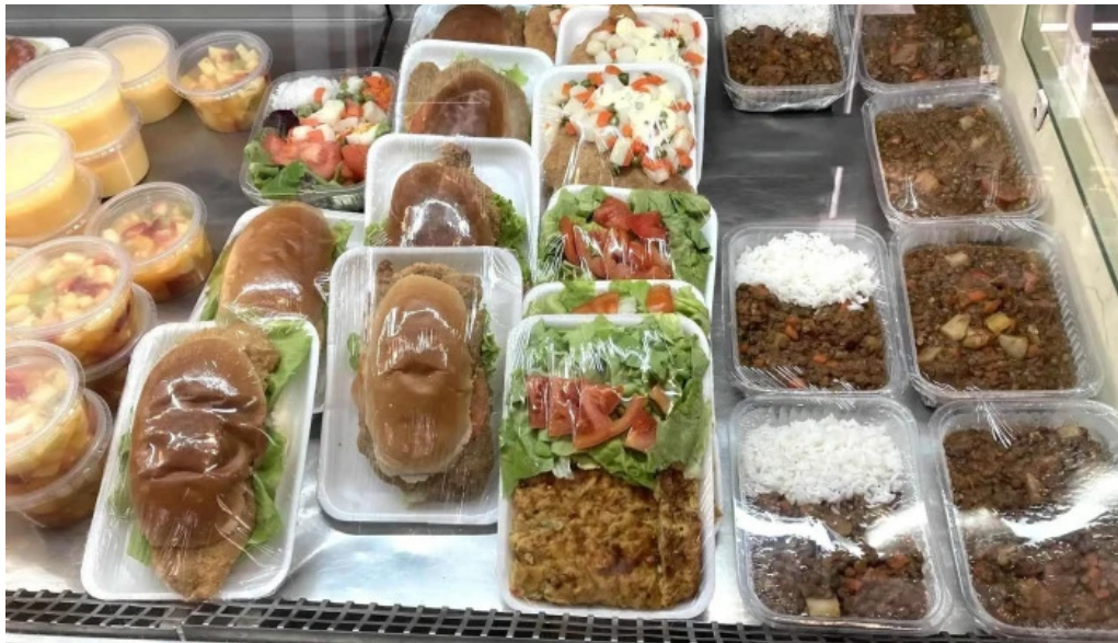
Pausa cocina y cafe del propietario