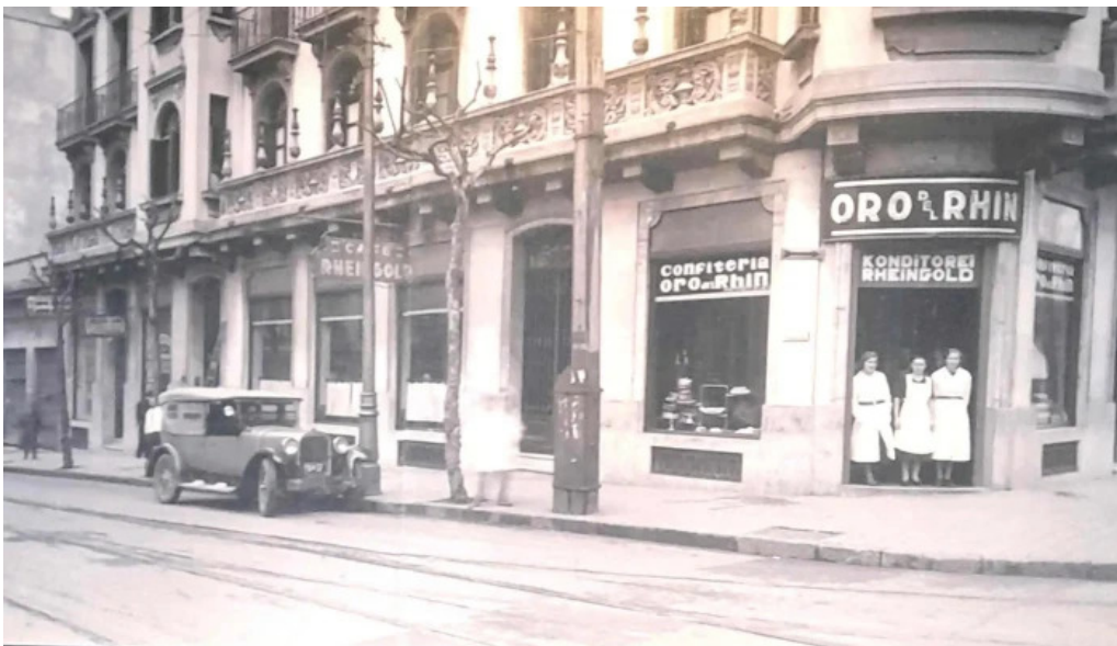
Oro del rhin cafe comentario 2