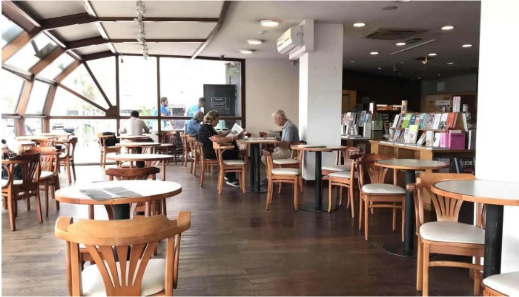
Oro del rhin cafe todo