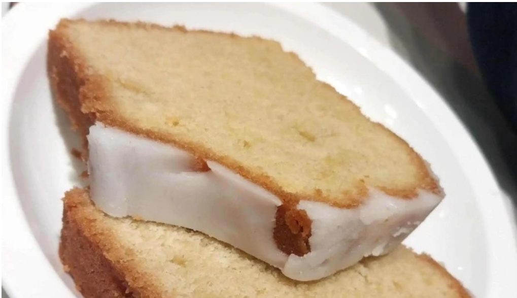
Oro del rin cafe comentario 8