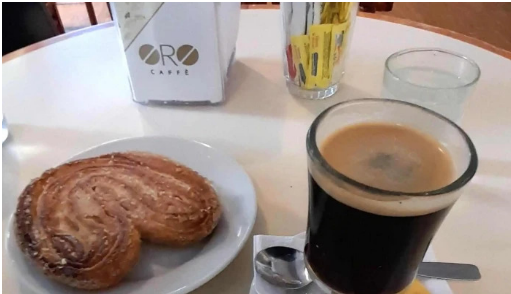
Oro del rhin cafe comentario 3