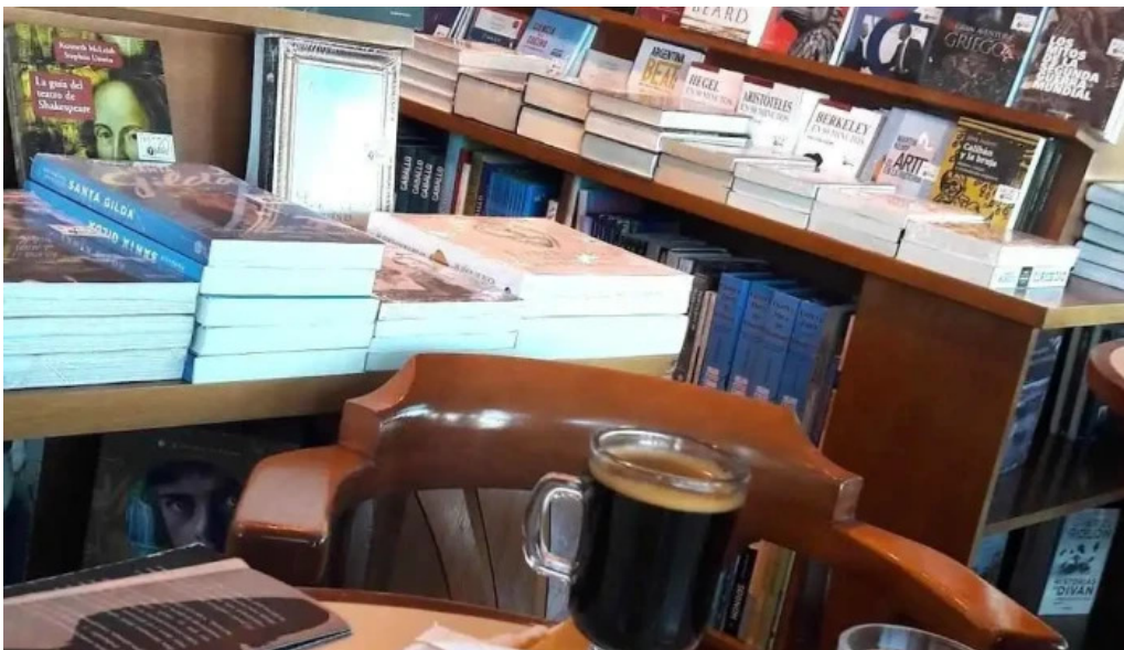
Oro del rhin cafe cafe