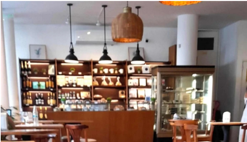
Oro del rhin cafe comentario 1