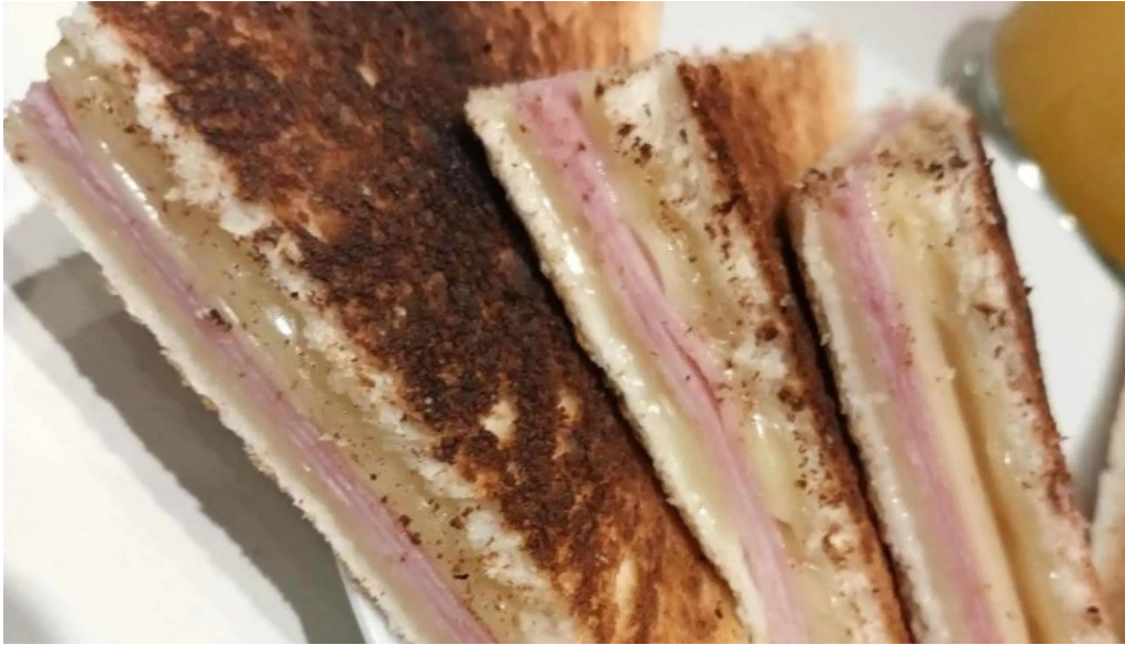
Oro del rhin cafe comentario 7