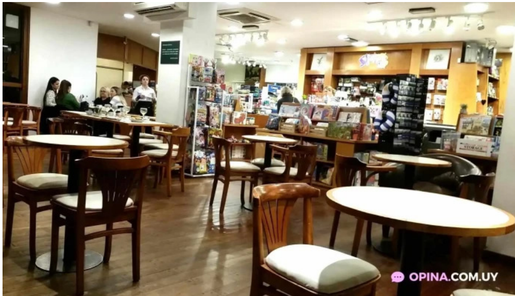
Oro del rhin cafe ambiente