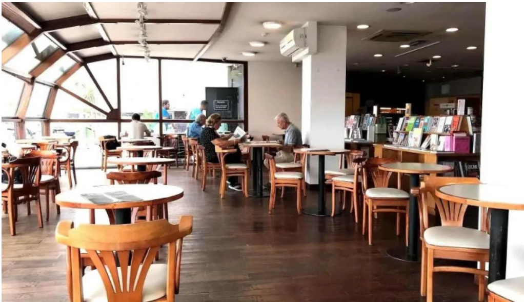
Oro del rhin cafe montevideo