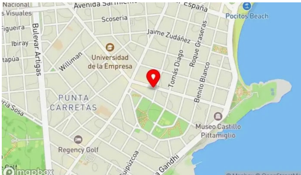
Oro del rhin cafe mapa