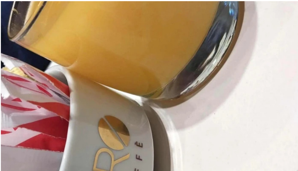
Oro del rhin cafe comentario 6