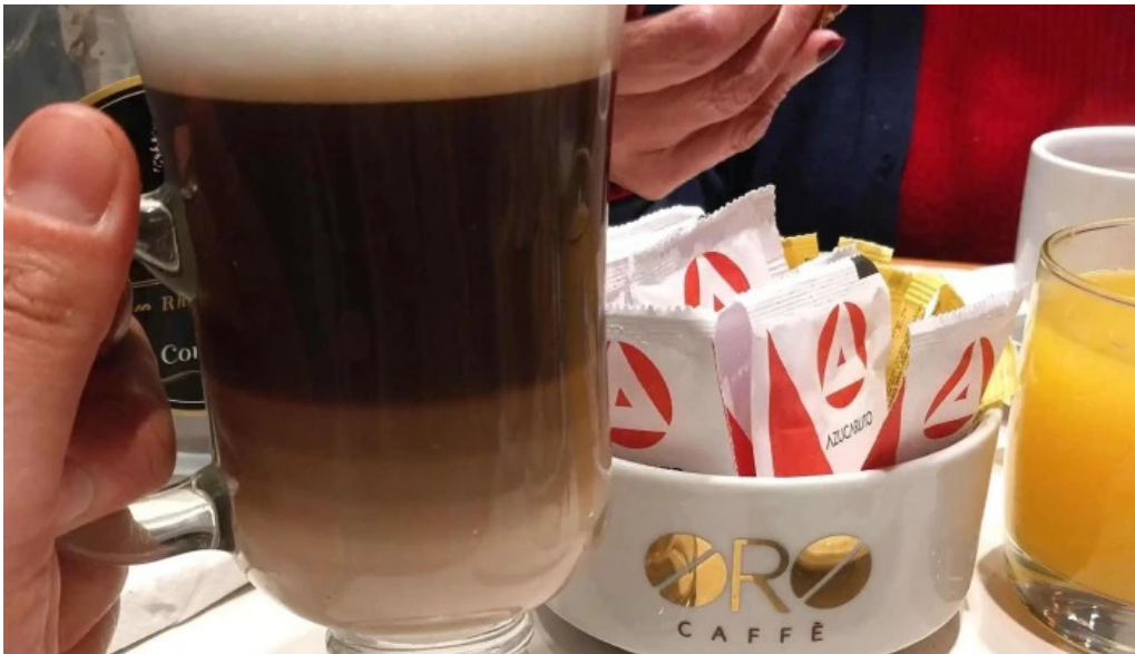
Oro del rhin cafe comentario 5