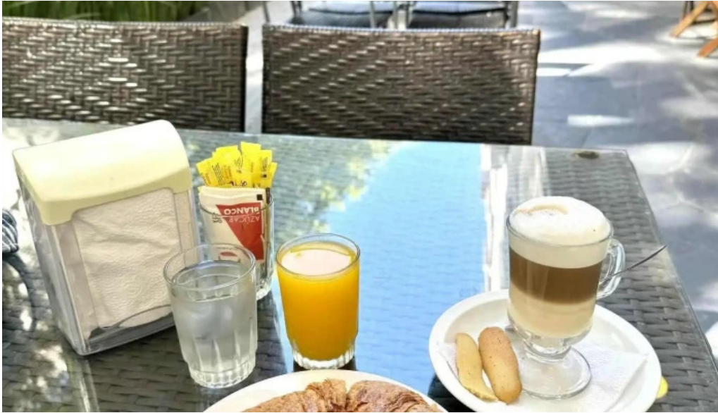
Oro del rin cafe comidas y bebidas