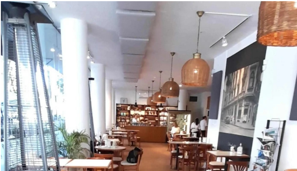
Oro del rhin cafe comentario 4