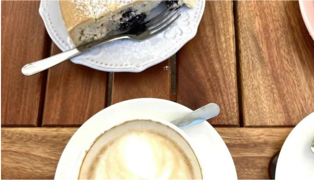
Nina pasteleria cafe arocena del propietario