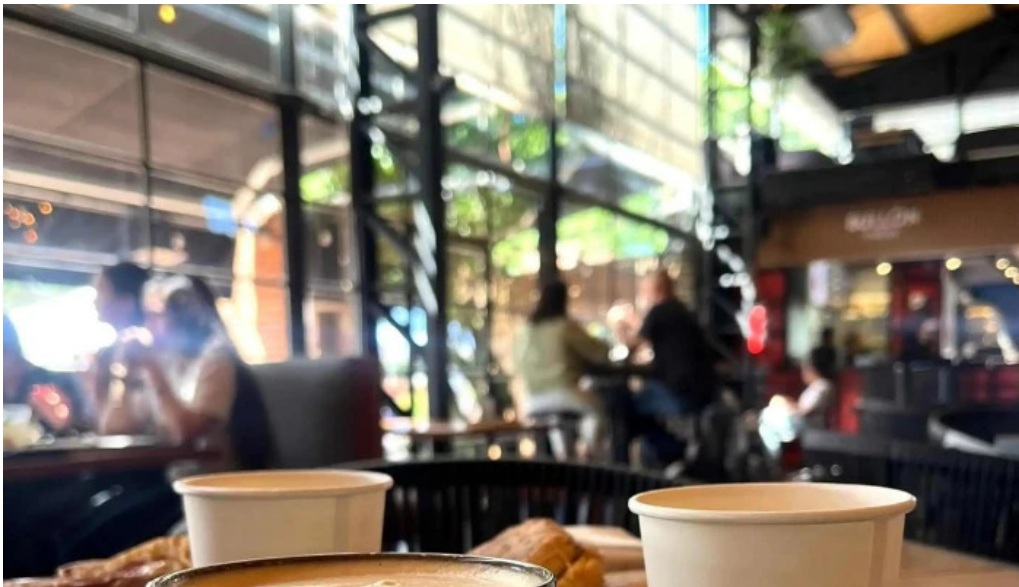
Nina pasteleria cafe arocena comentario 4