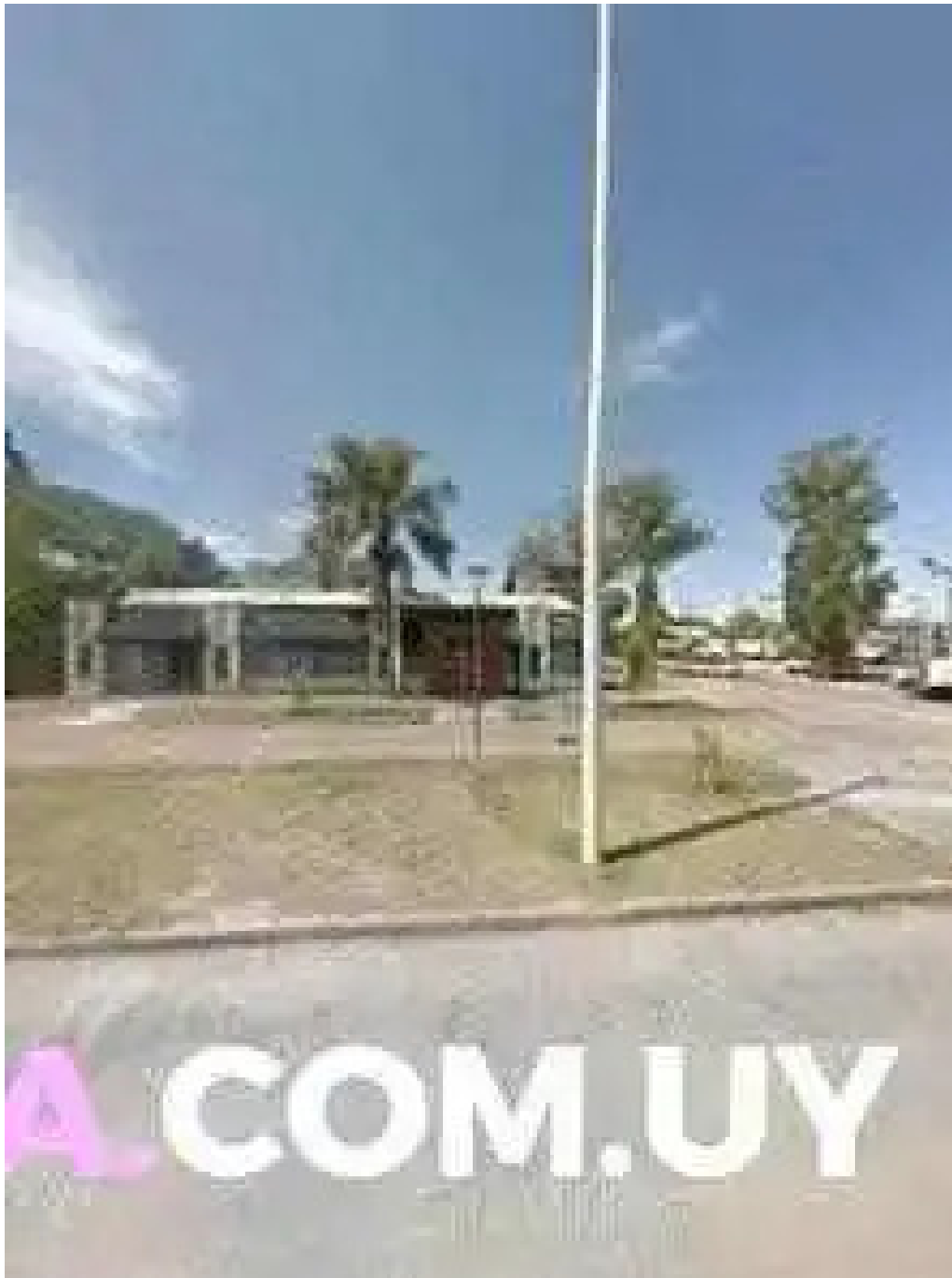
Nina pasteleria cafe arocena street view y 360