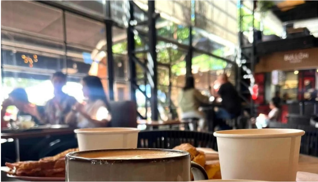
Nina pasteleria cafe arocena comentario 1