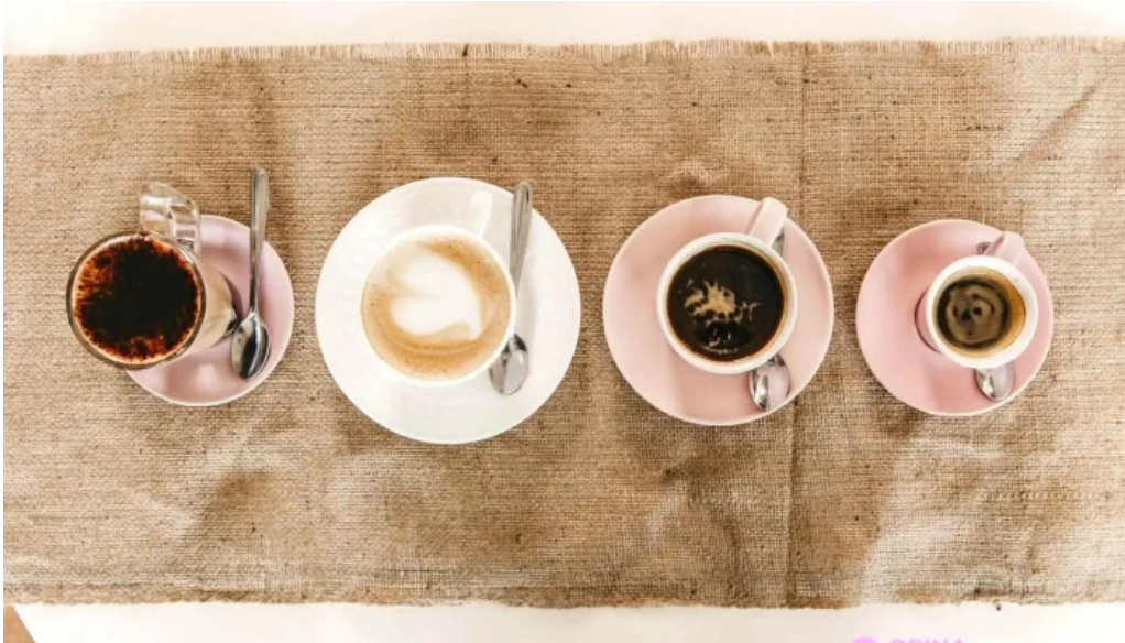
Nina pasteleria cafe arocena todo