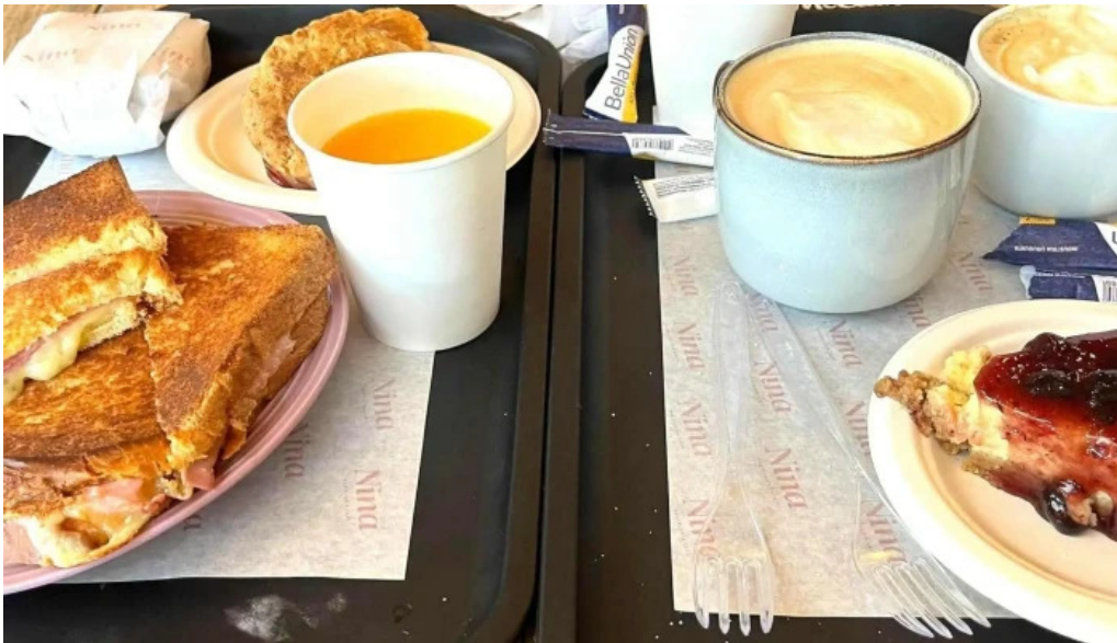
Nina pasteleria cafe arocena comentario 3