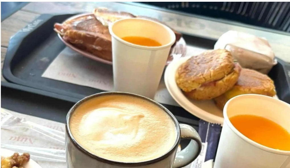
Nina pasteleria cafe arocena comentario 2