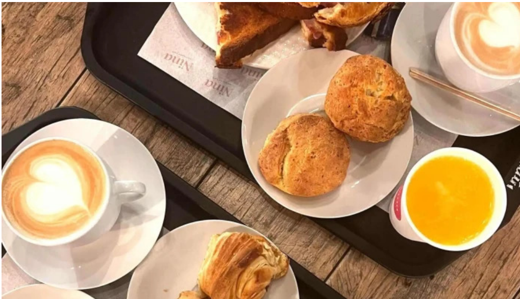
Nina pasteleria cafe arocena comentario 5