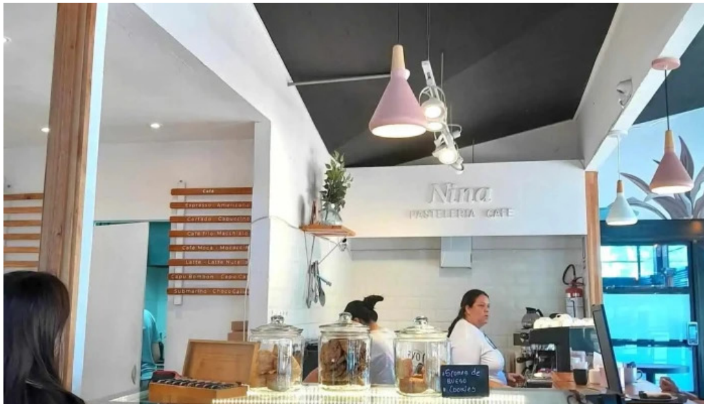
Nina pasteleria cafe arocena ambiente