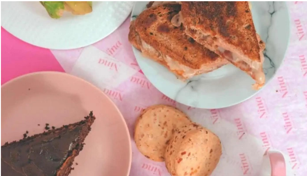
Nina pasteleria cafe arocena cafe