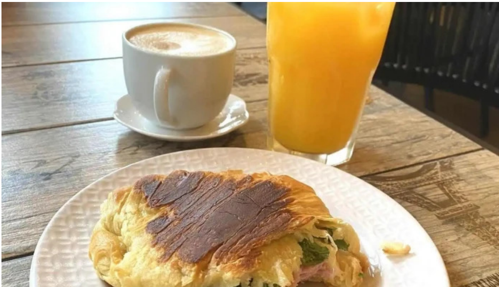
Nina pasteleria cafe arocena comidas y bebidas