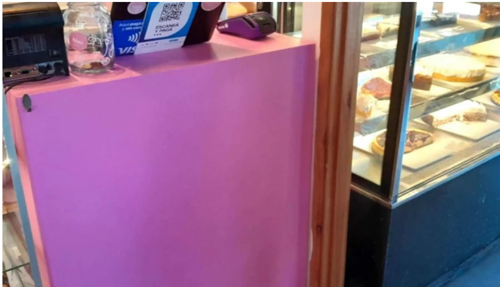
Nina pasteleria cafe arocena comentario 7