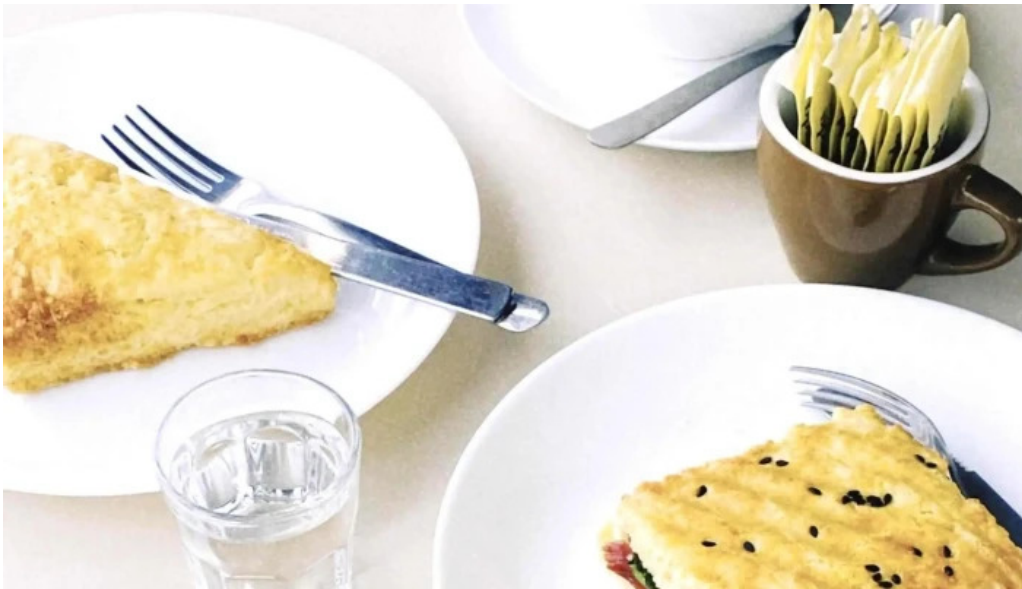
Nativo cafe comentario 6