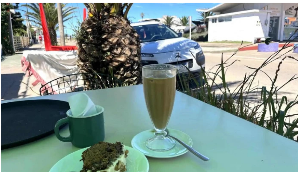
Nativo cafe todo