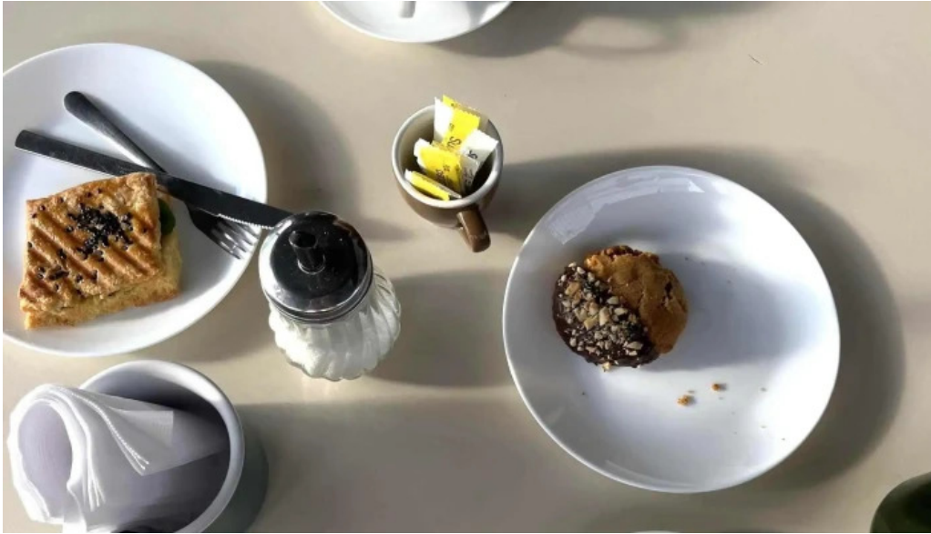
Nativo cafe comentario 9