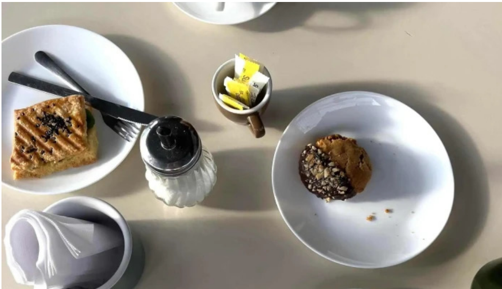
Nativo cafe comentario 2