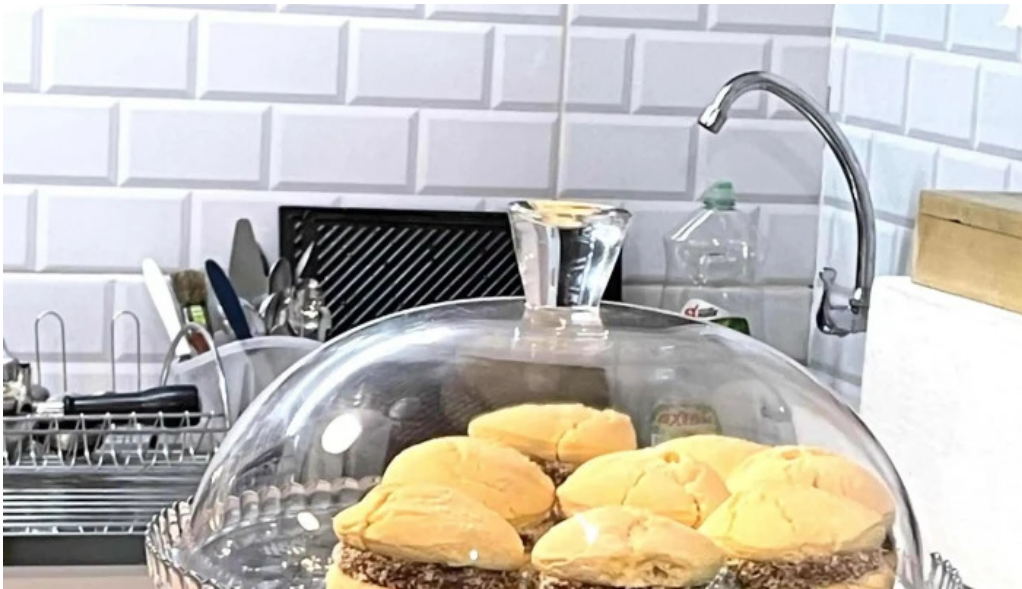
Nativo cafe comentario 4