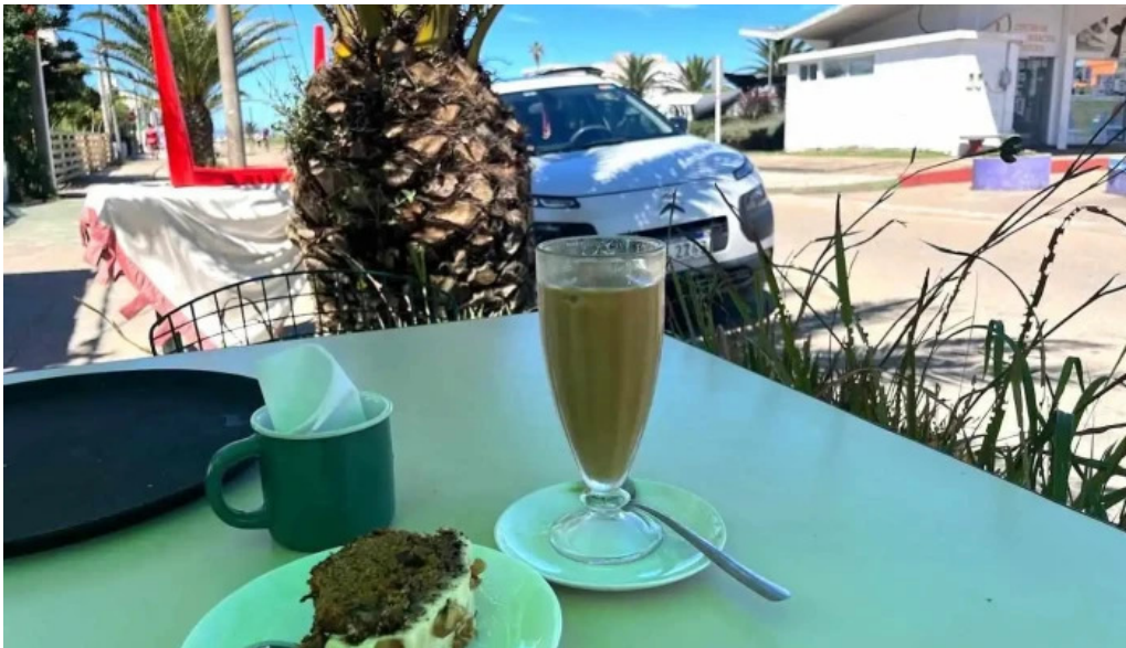
Nativo cafe la paloma