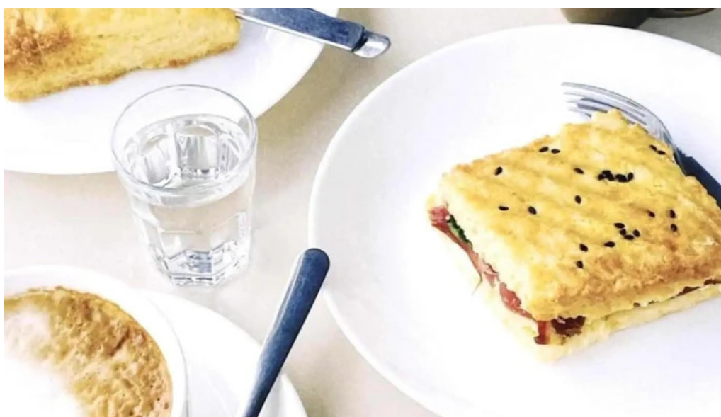
Nativo cafe cafe