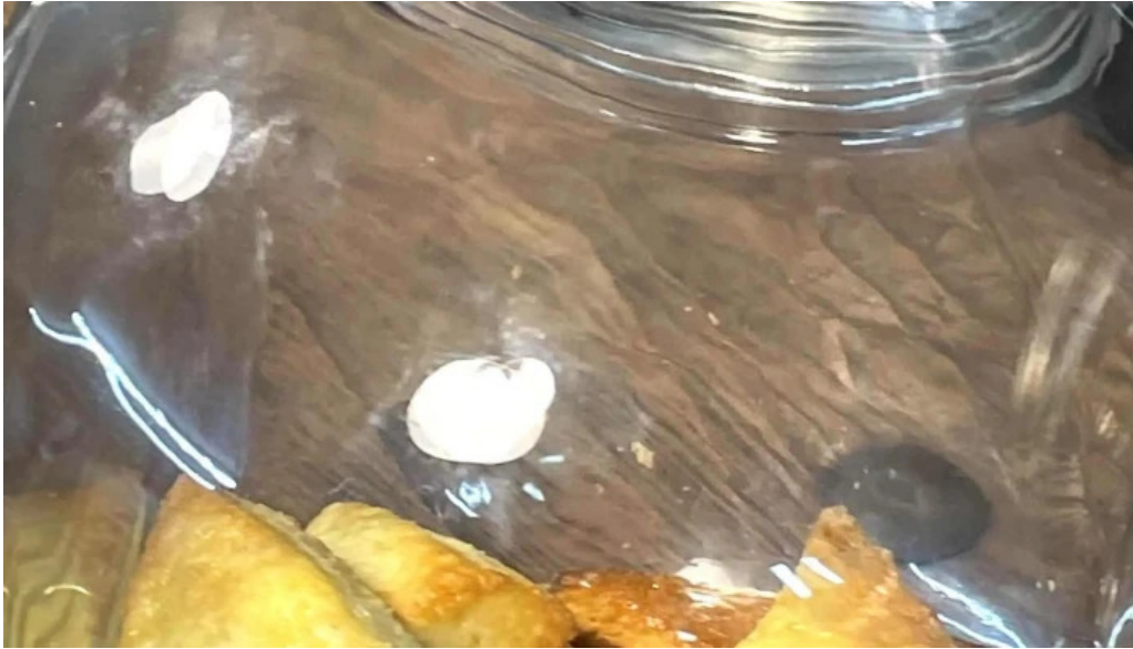
Nativo cafe comentario 5