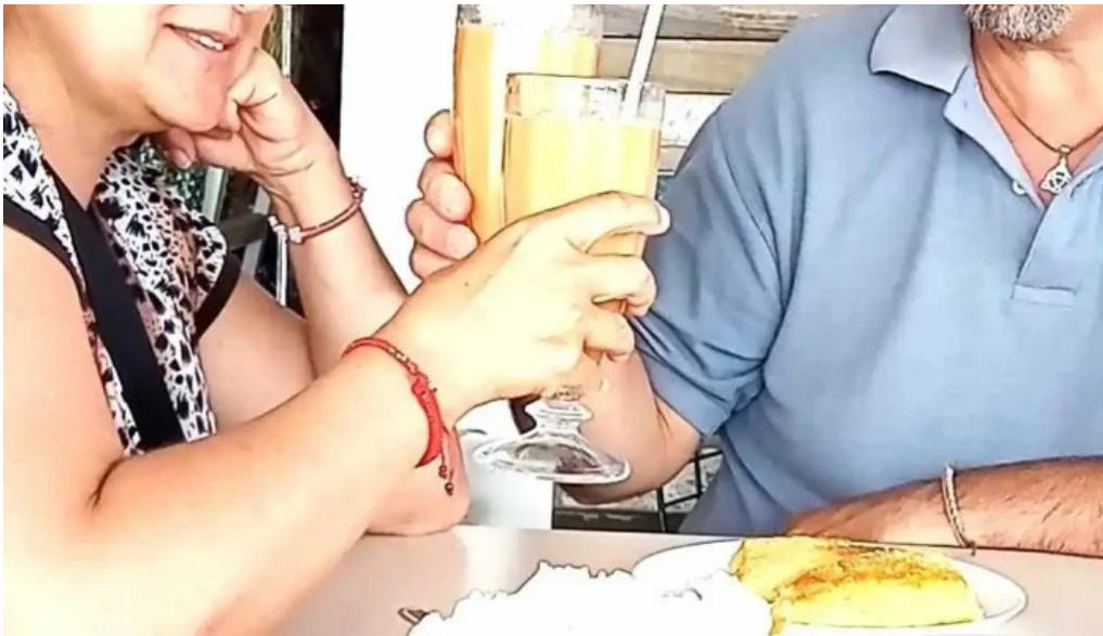
Nativo cafe videos