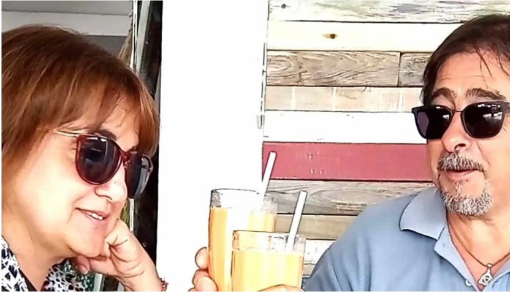
Nativo cafe comentario 7