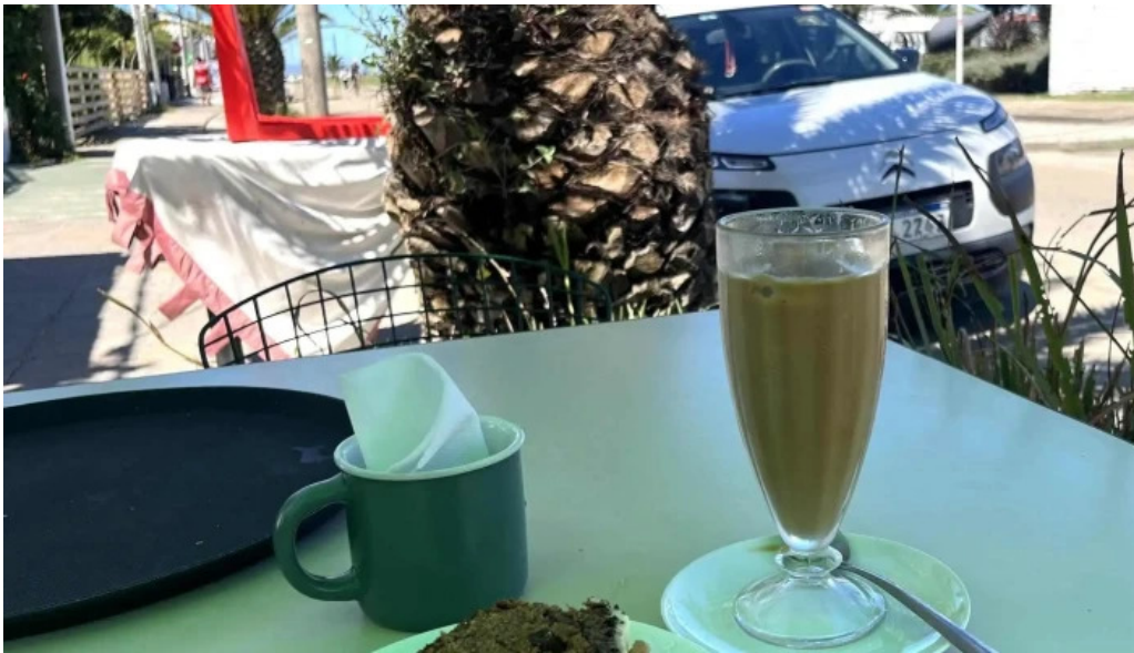
Nativo cafe comentario 8