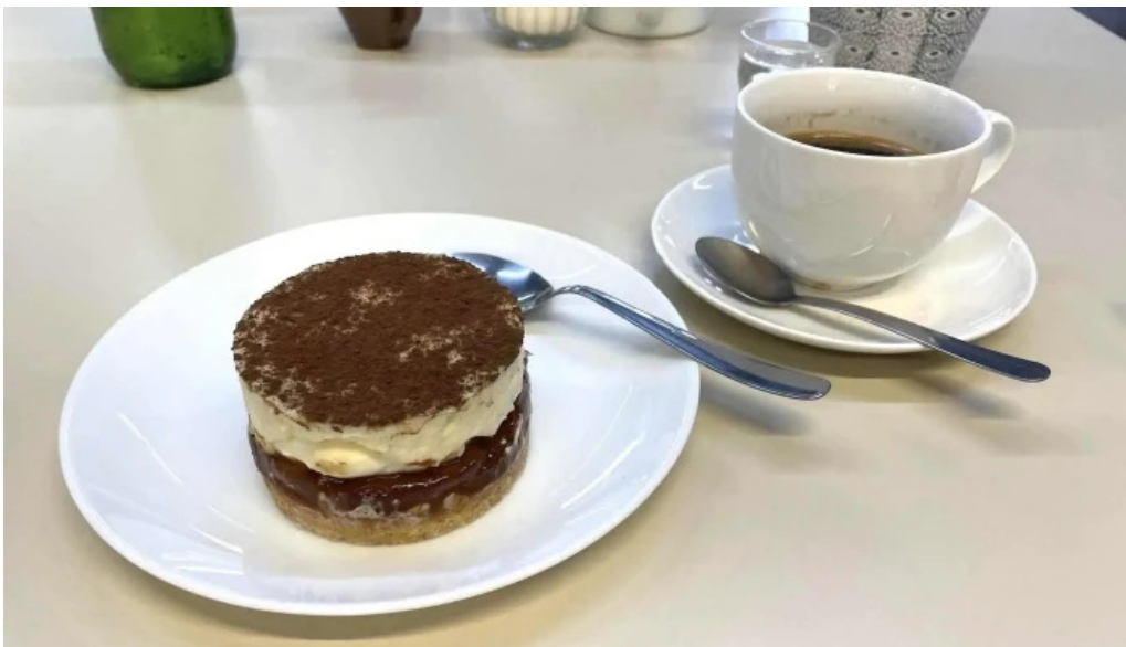
Nativo cafe comidas y bebidas