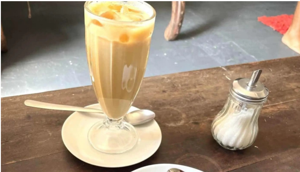
Nativo cafe comentario 3