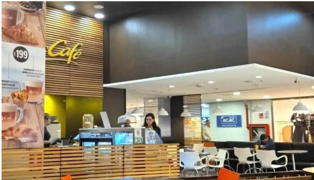
Mc cafe ambiente