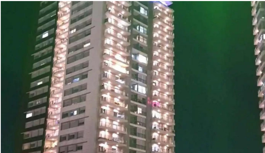
Mc cafe videos