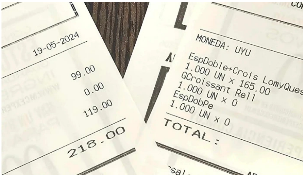
Mc cafe comentario 3