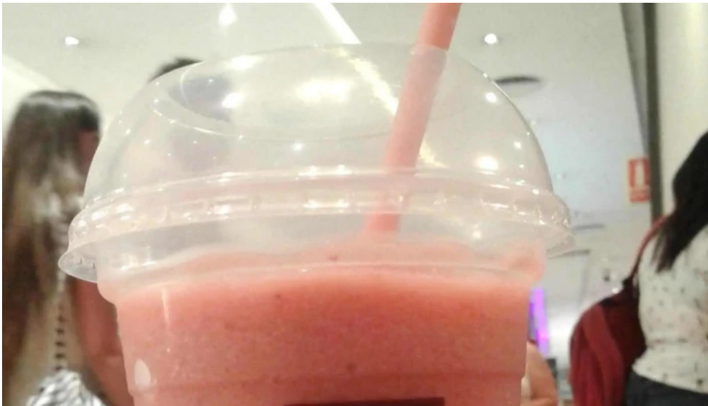
Mc cafe comentario 6