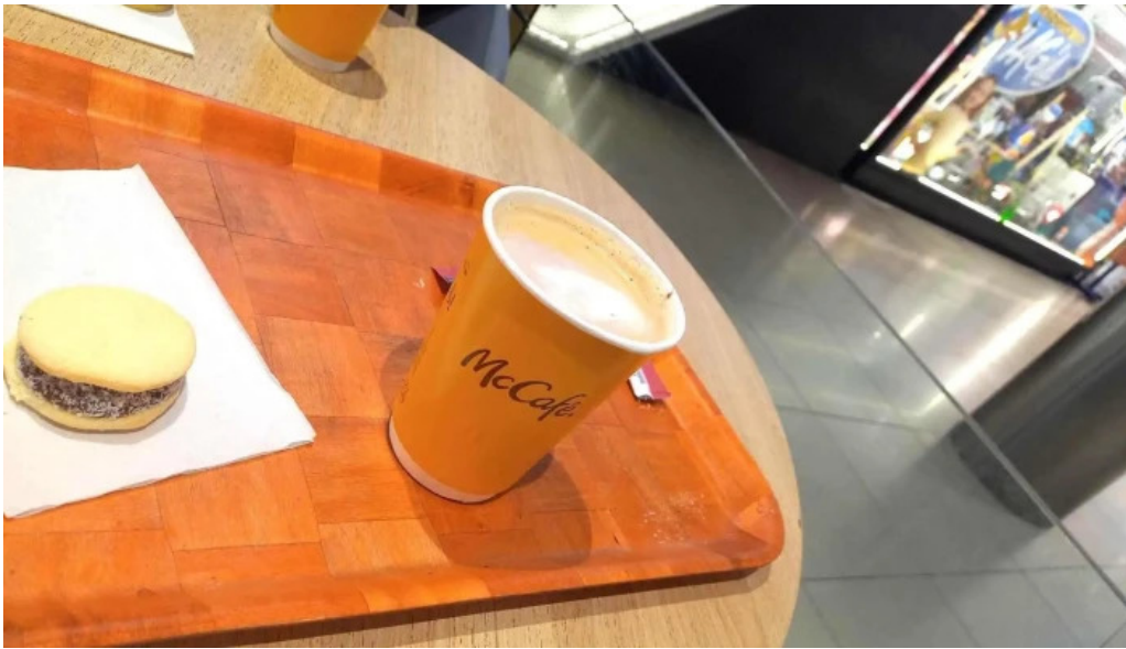
Mc cafe todo