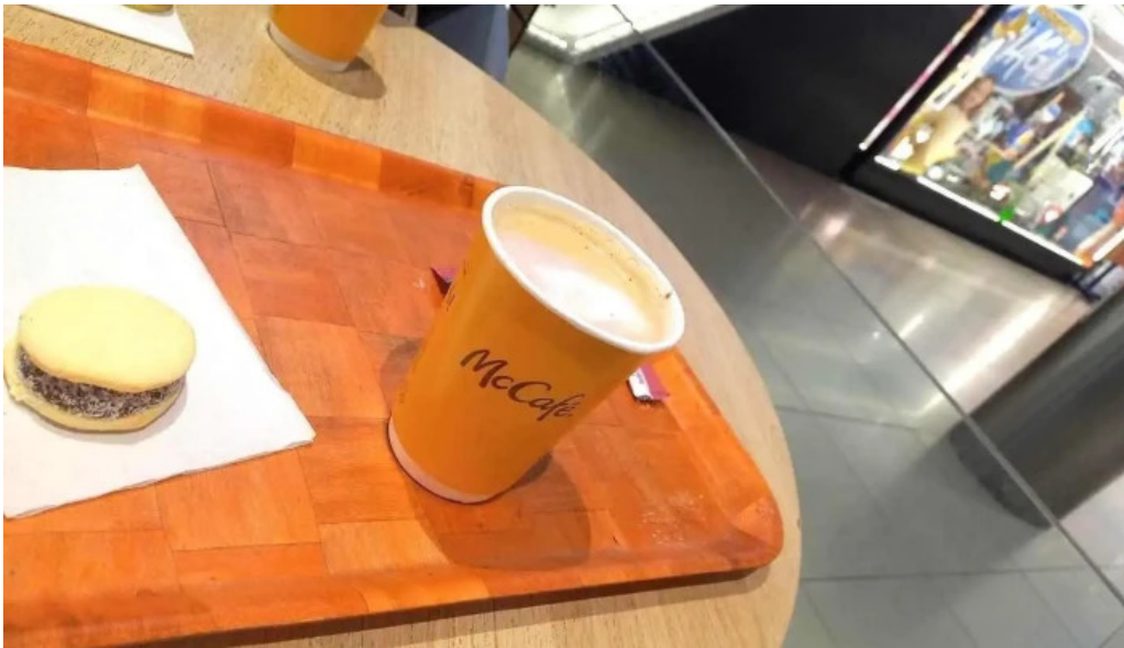
Mc cafe montevideo