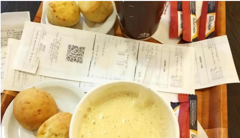
Mc cafe cafe