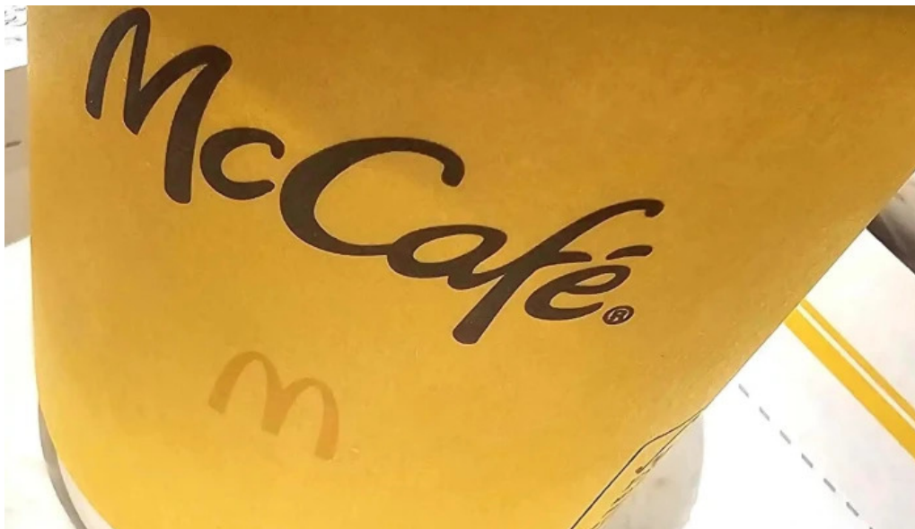
Mc cafe comentario 2