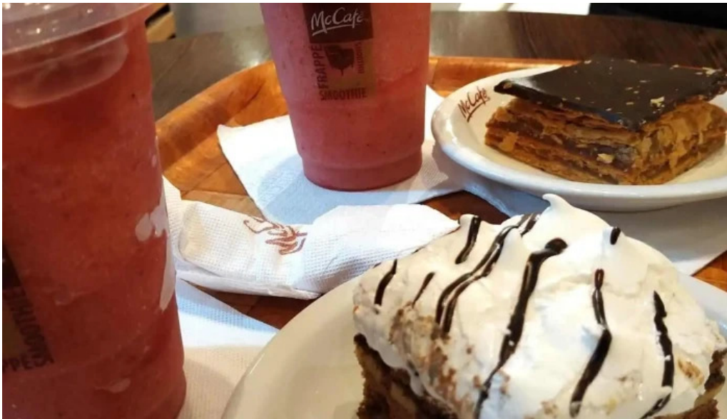
Mc cafe comidas y bebidas