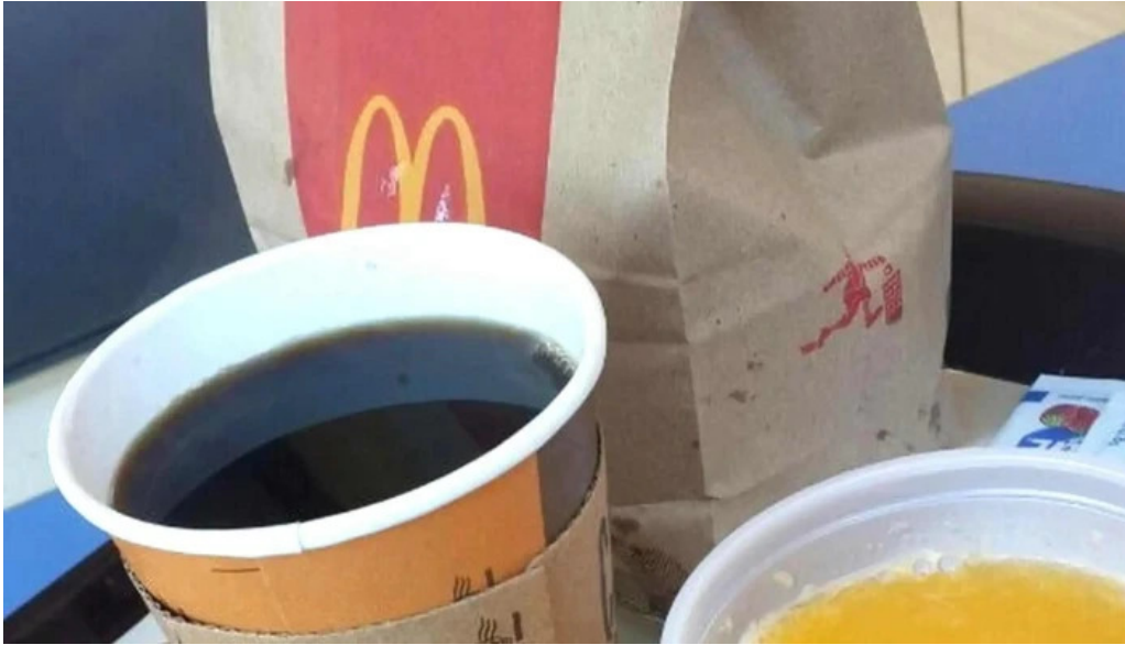
Mc cafe comentario 5