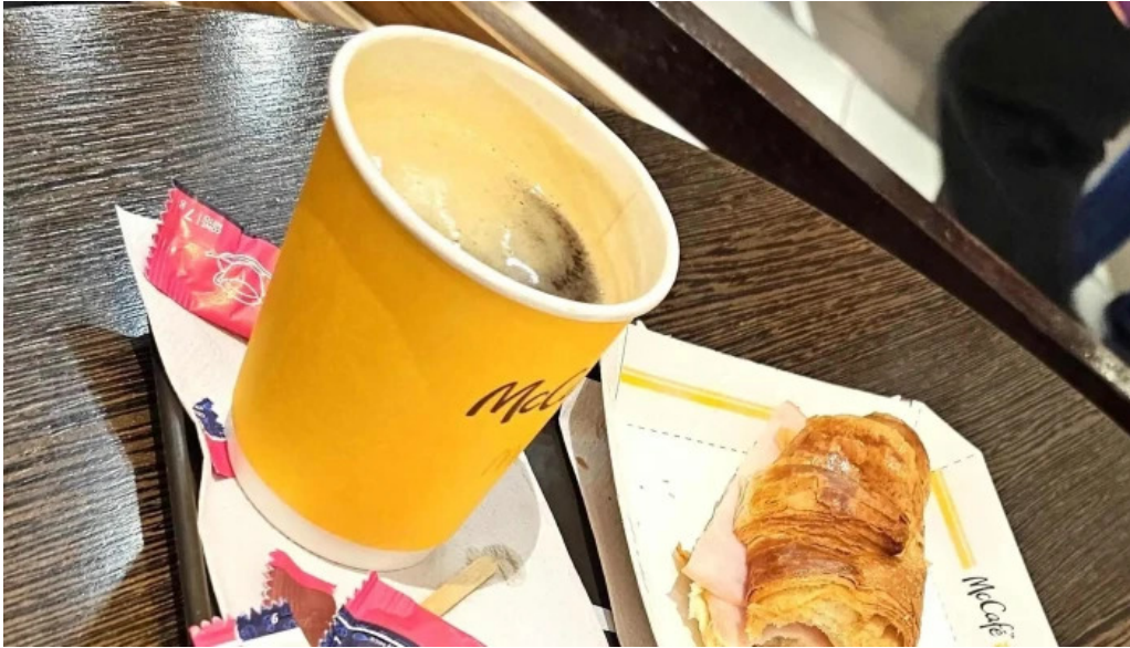
Mc cafe comentario 7