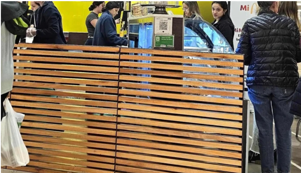
Mc cafe comentario 4