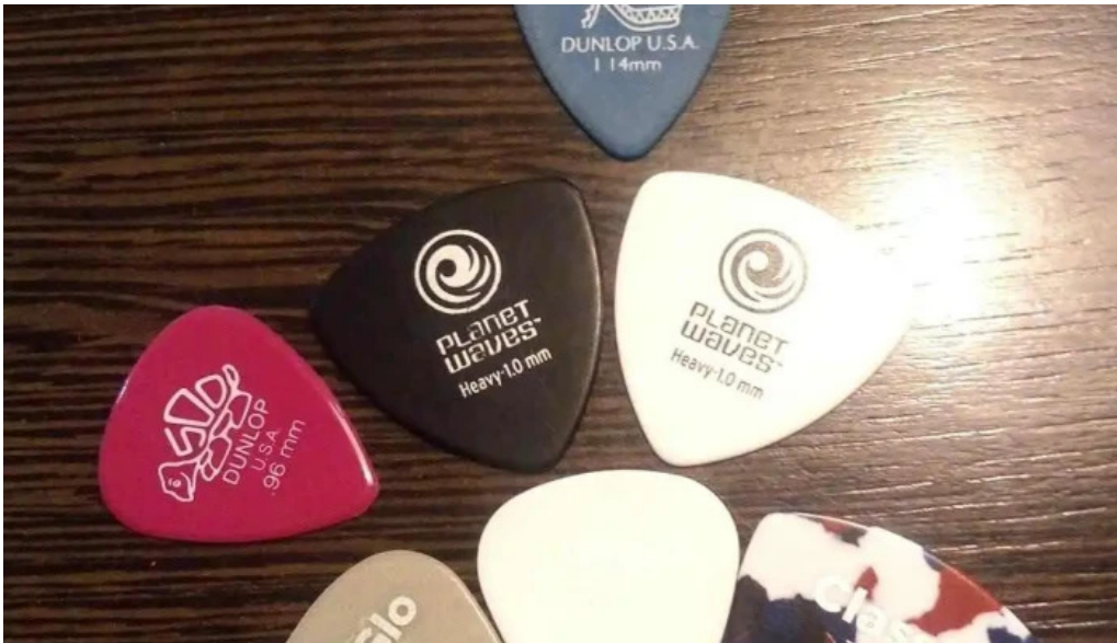
Mc cafe menu