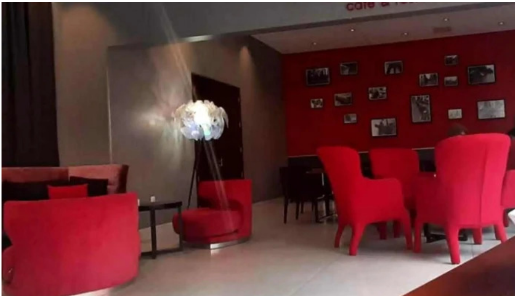
Lisandro cafe snack comentario 5