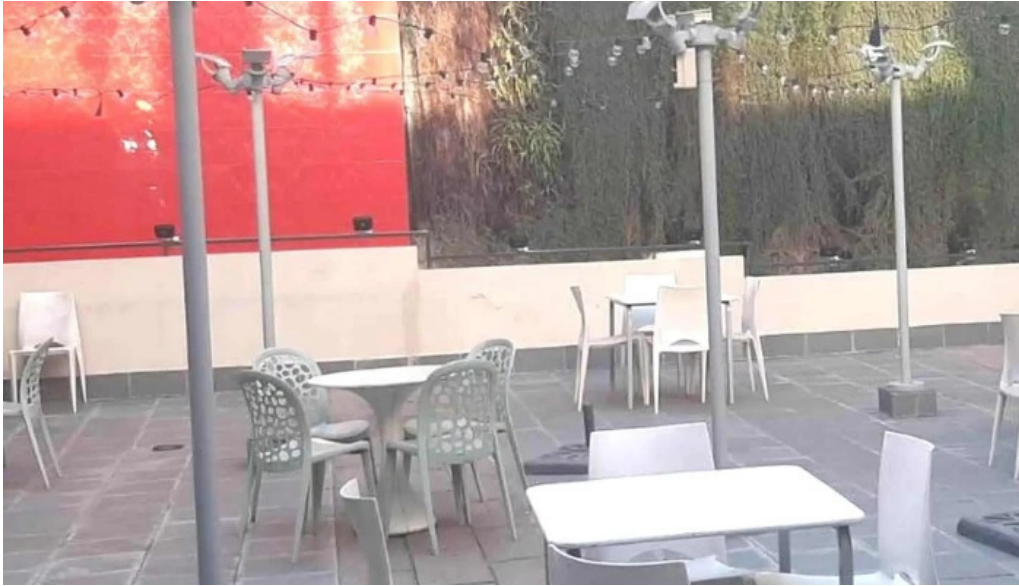
Lisandro cafe snack comentario 11