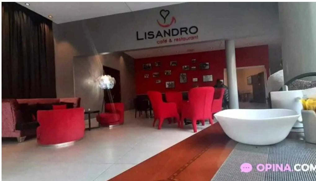
Lisandro cafe snack todo