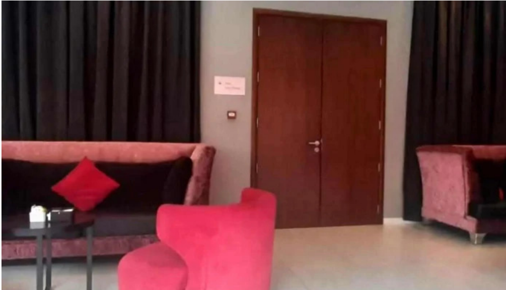
Lisandro cafe snack comentario 6