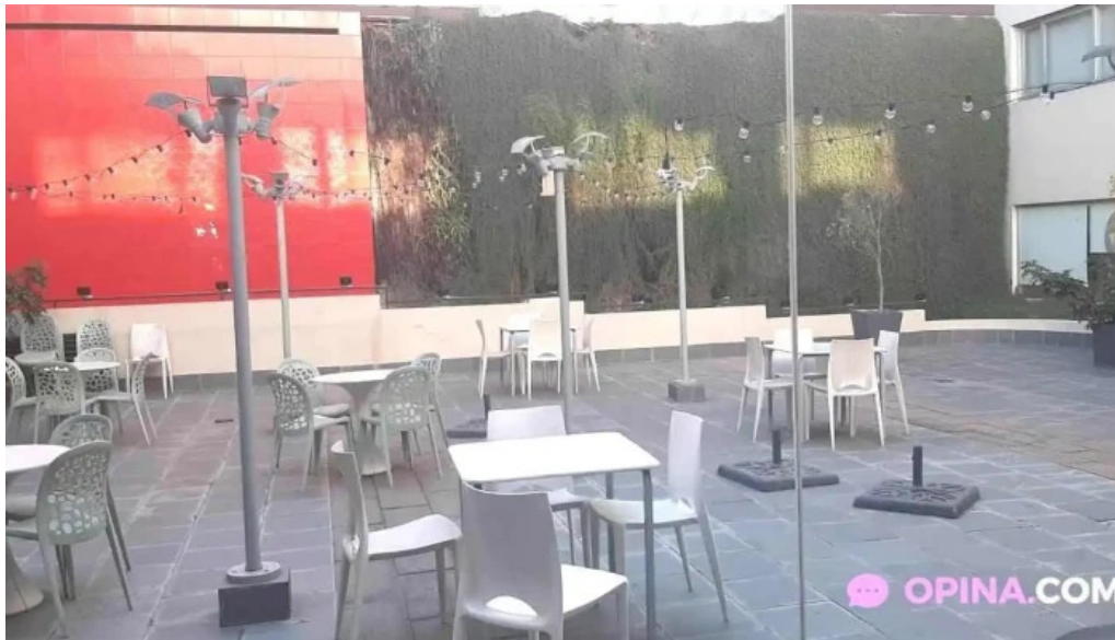
Lisandro cafe snack ambiente