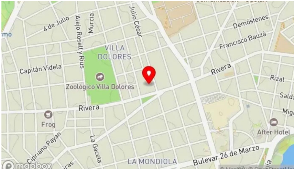
Lisandro cafe snack mapa