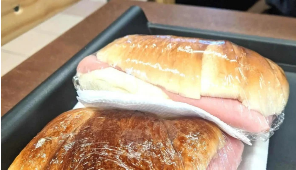
El chana cafe comentario 2