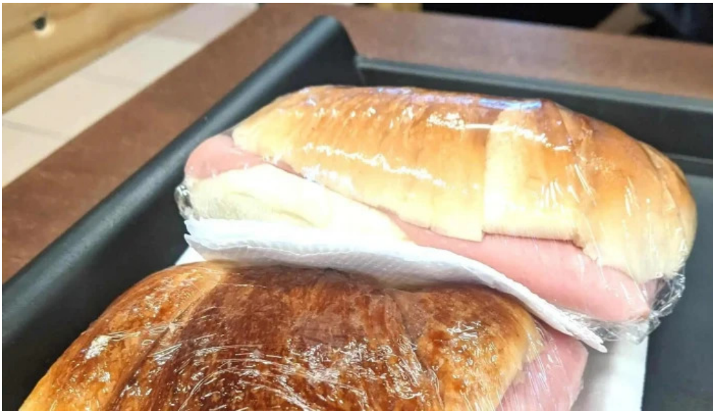
El chana cafe comentario 7