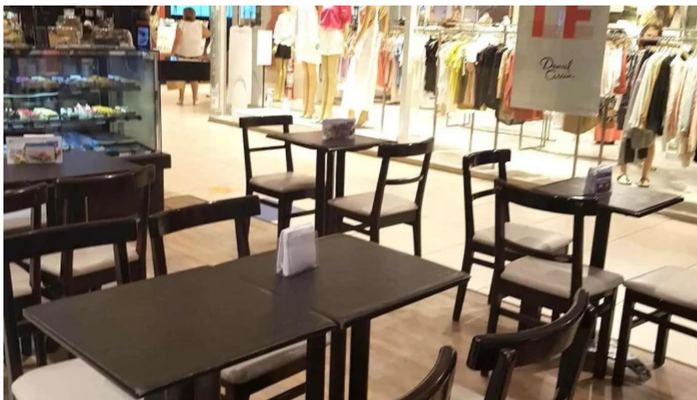
El chana cafe ambiente