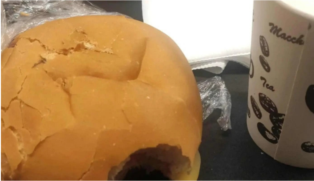
El chana cafe comentario 4