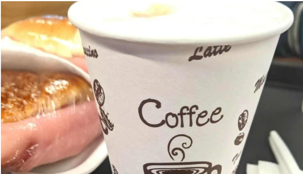
El chana cafe comentario 6