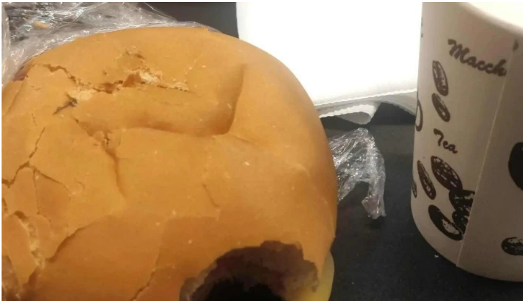
El chana cafe comentario 9