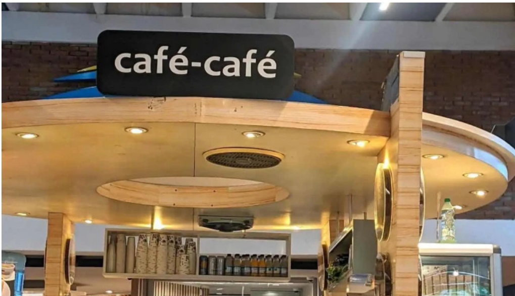
El chana cafe todo