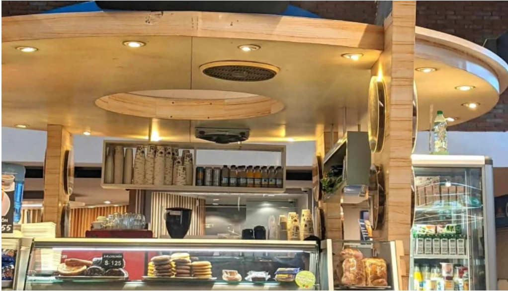
El chana cafe comentario 8