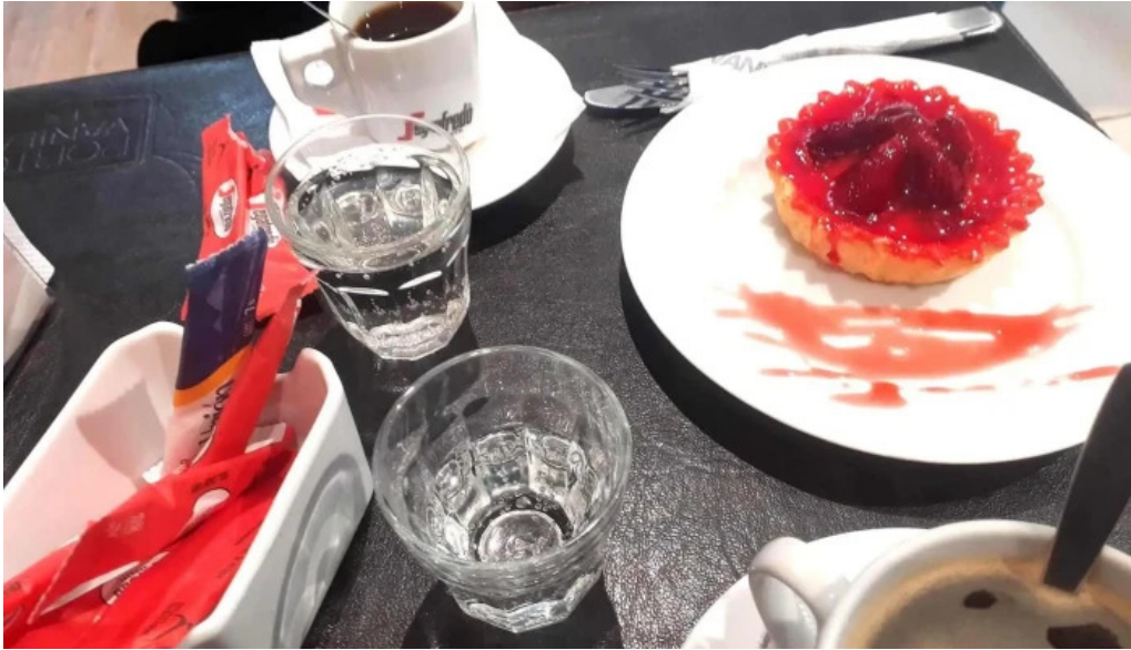
El chana cafe comidas y bebidas