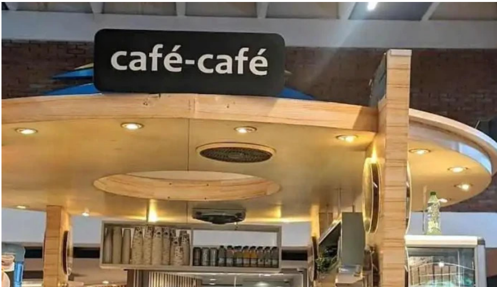
El chana cafe montevideo