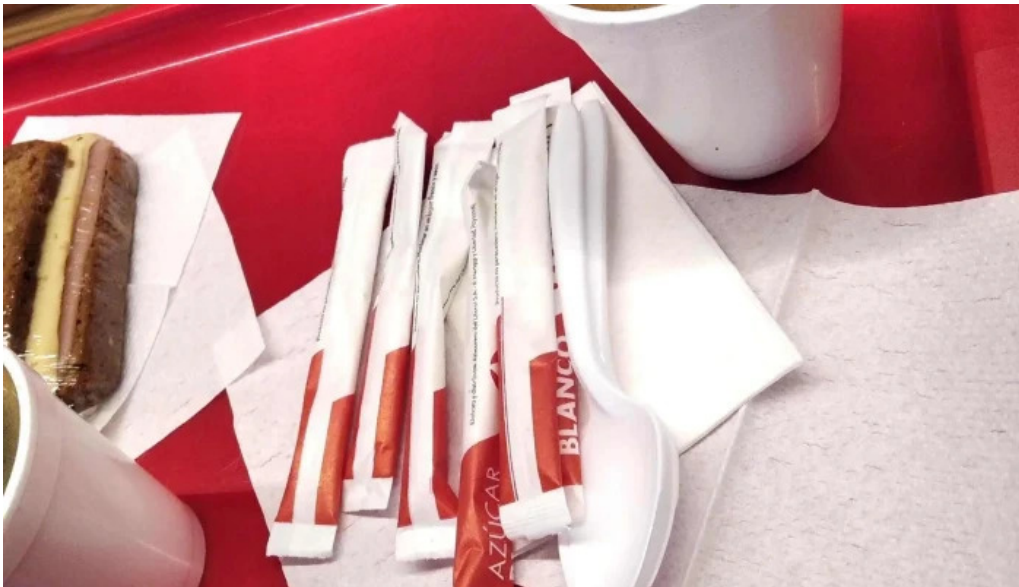
El chana cafe comentario 5