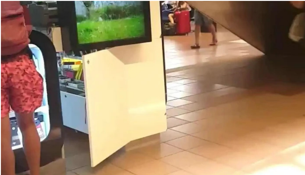
El chana cafe videos