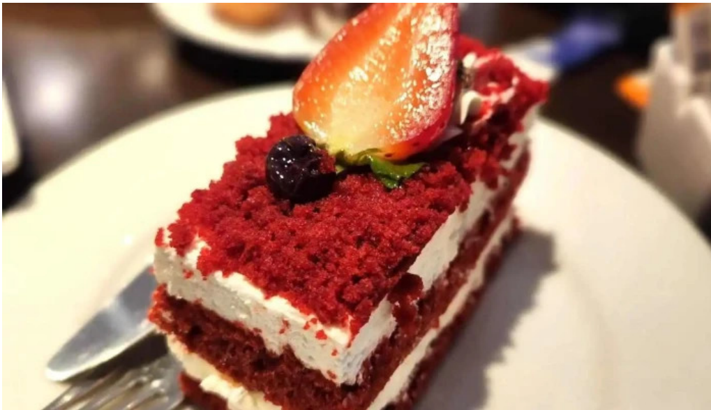
Corunesa cafe pastel