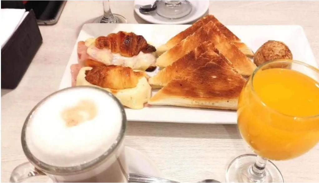
Corunesa cafe jugo