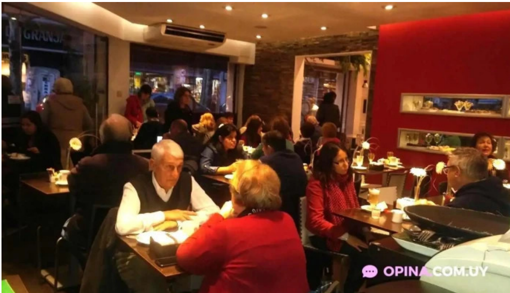
Corunesa cafe montevideo