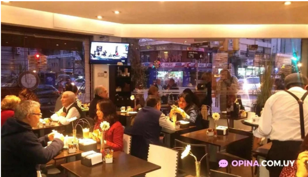
Corunesa cafe del propietario