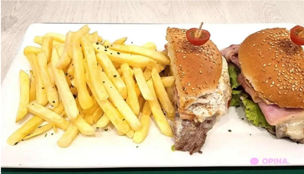
Corunesa cafe comidas y bebidas