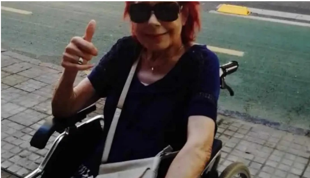
Corunesa cafe recientes