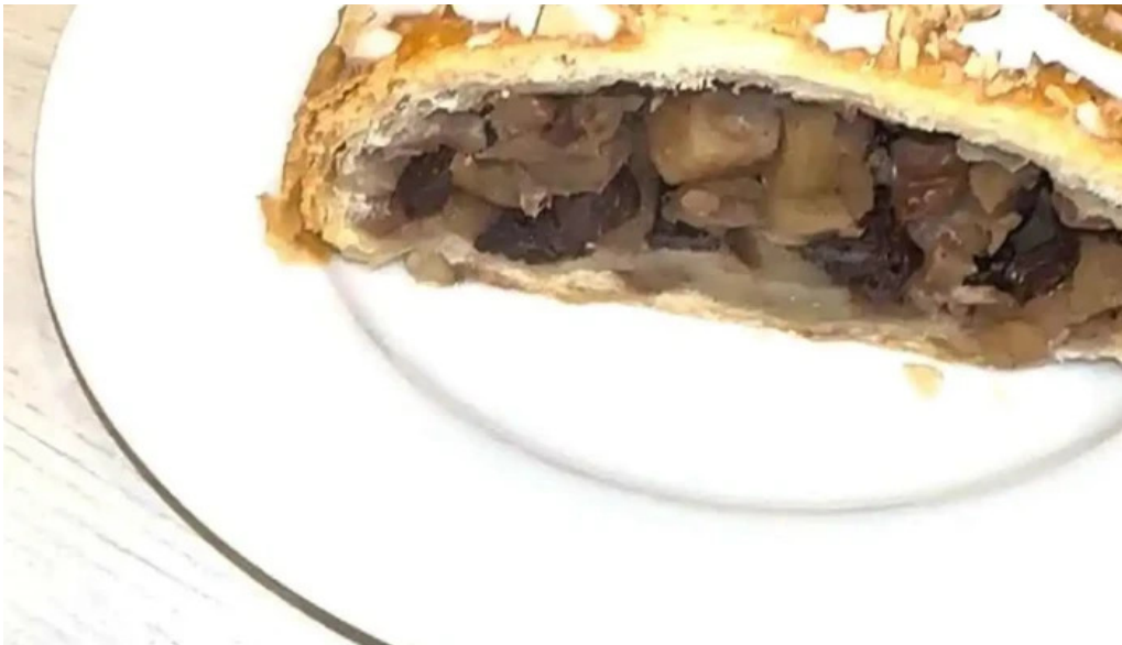
Corunesa cafe videos