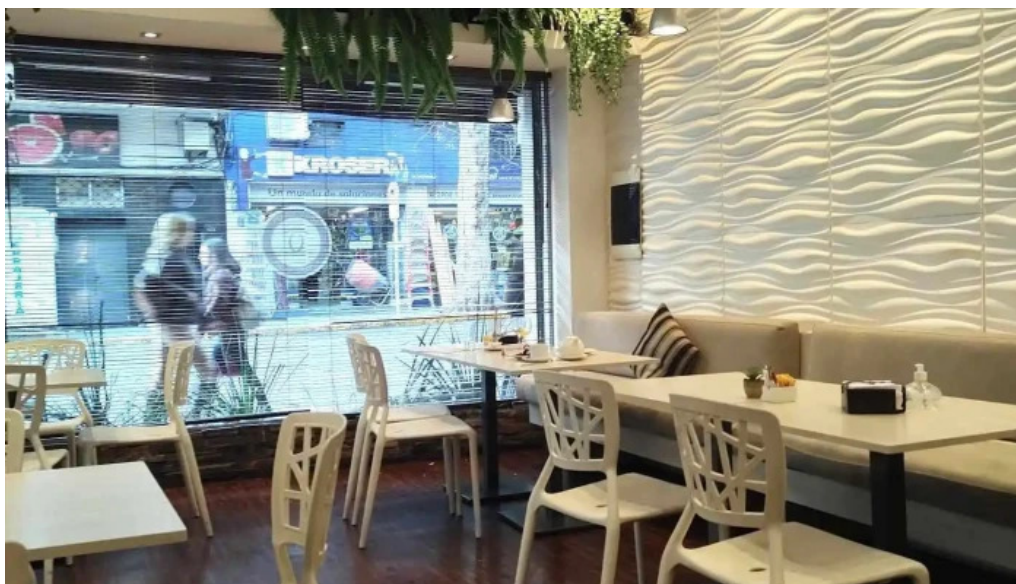
Corunesa cafe ambiente