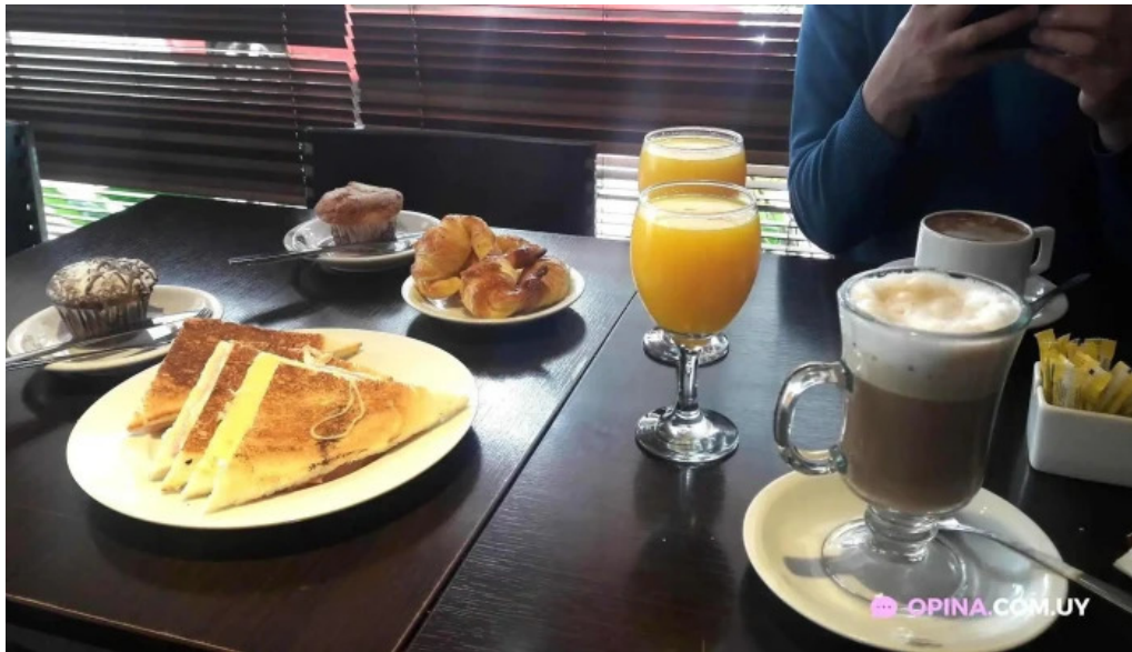
Corunesa cafe cafe