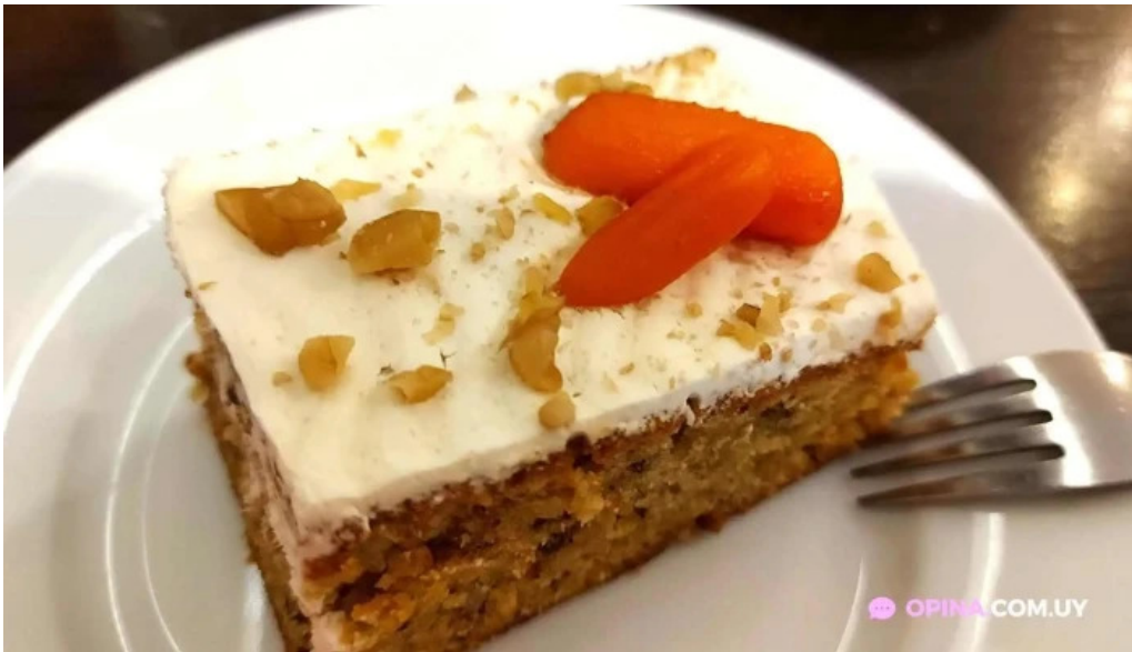
Corunesa cafe pastel de zanahoria