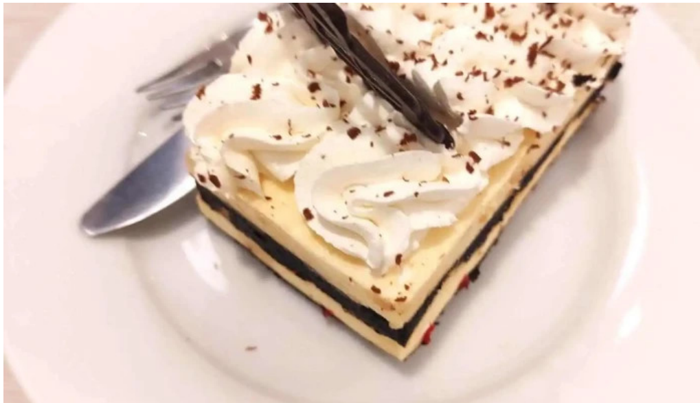
Corunesa cafe banoffee pie