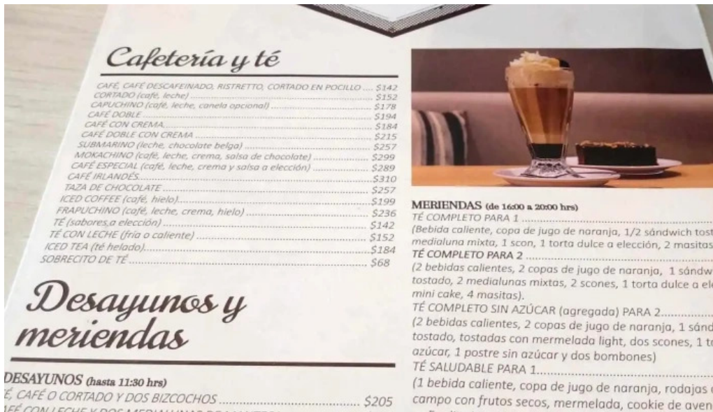
Corunesa cafe menu