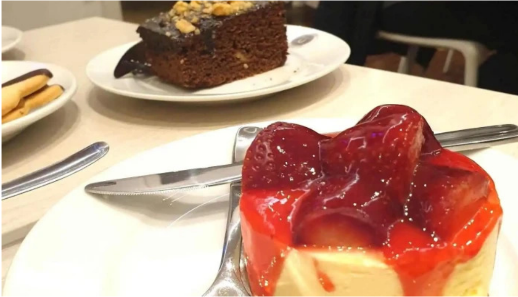
Corunesa cafe pastel de queso