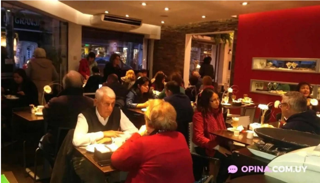
Corunesa cafe todo