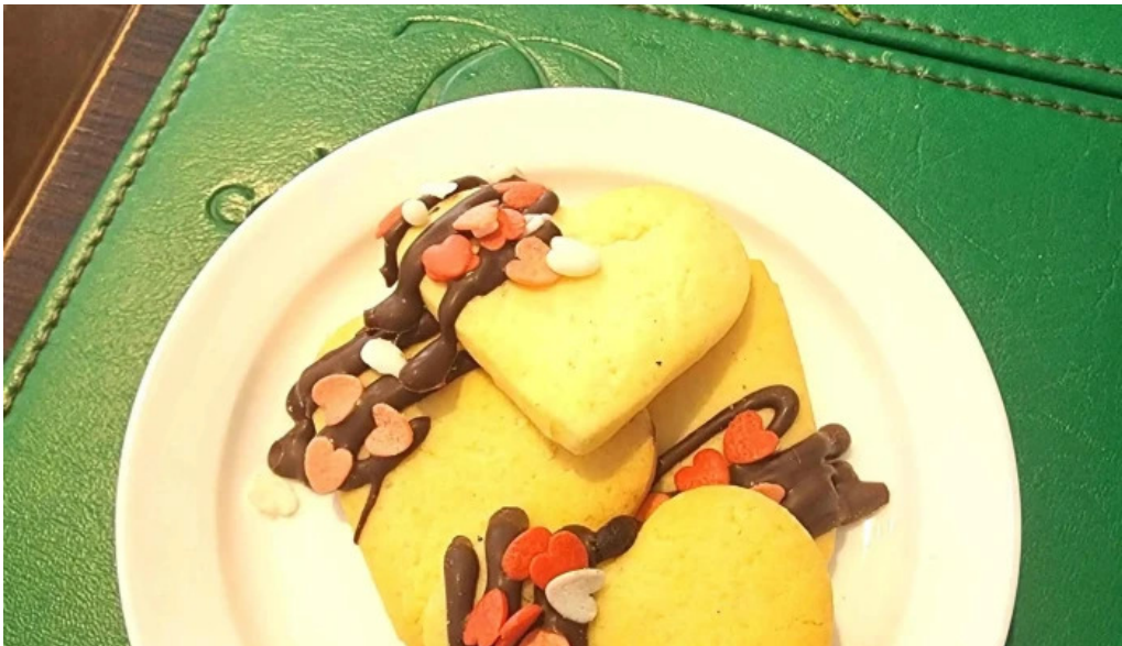
Corunesa cafe comentario 1