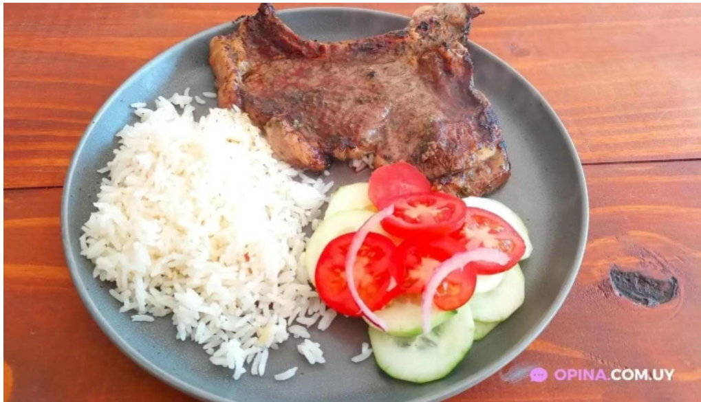
El antigueno comida y bebida