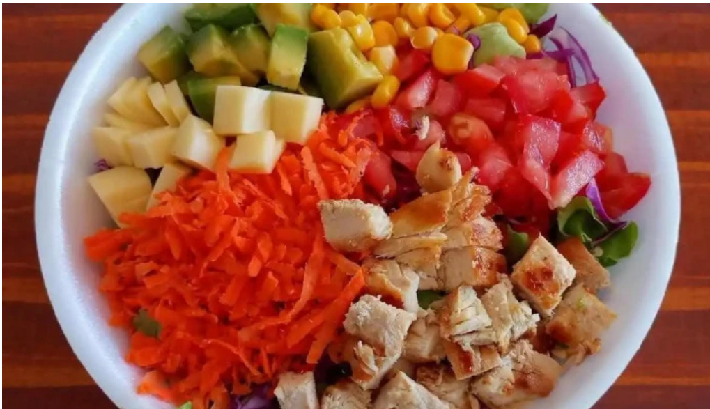
El antigueno melo