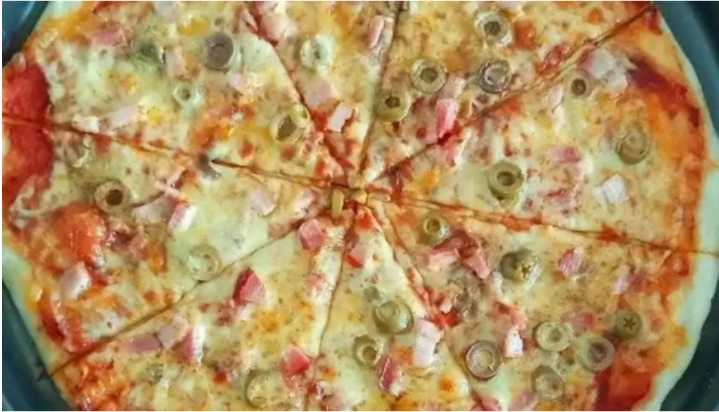
El antigueno pizza