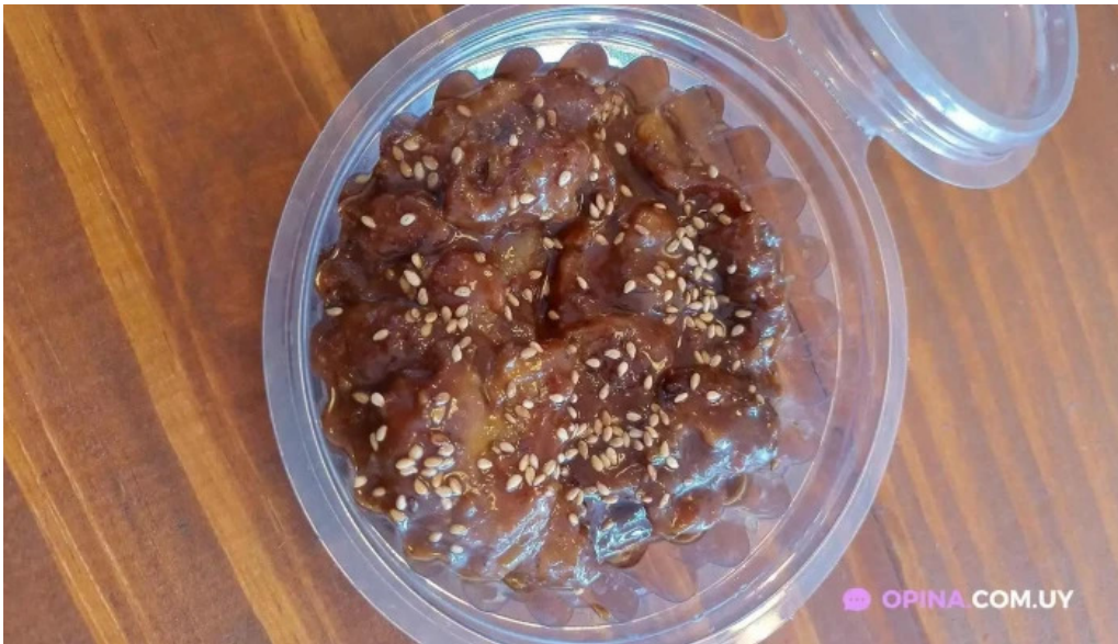
El antigueno mas recientes