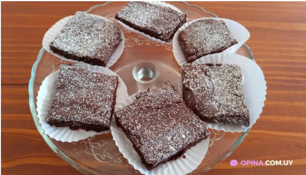
El antigueno pastel