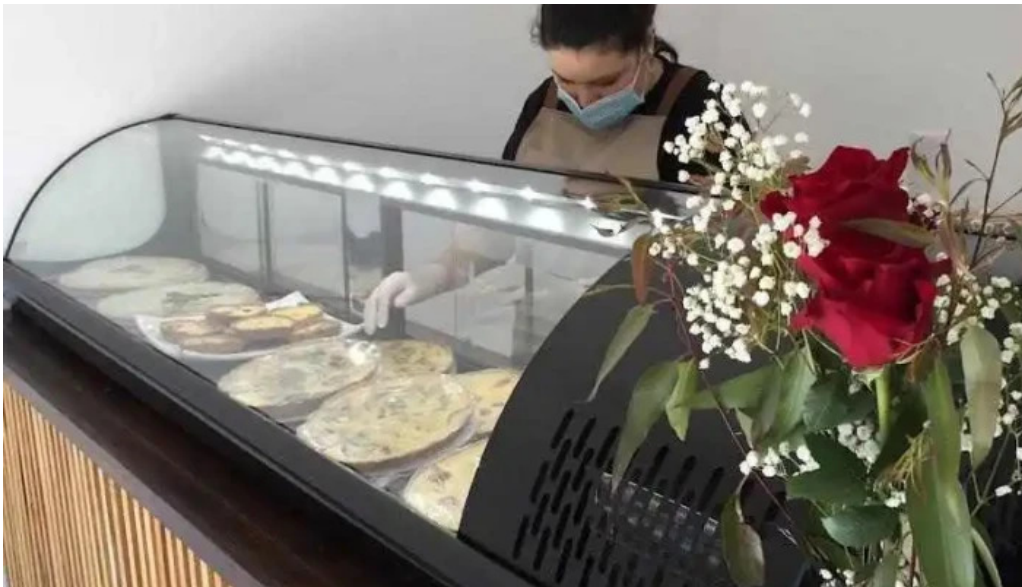
Mas sano tienda de alimentos saludables todas