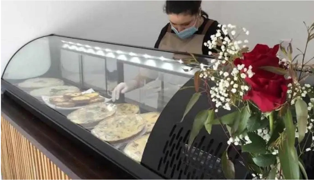
Mas sano tienda de alimentos saludables young