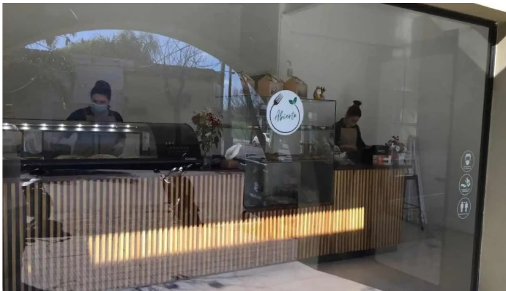
Mas sano tienda de alimentos saludables del propietario