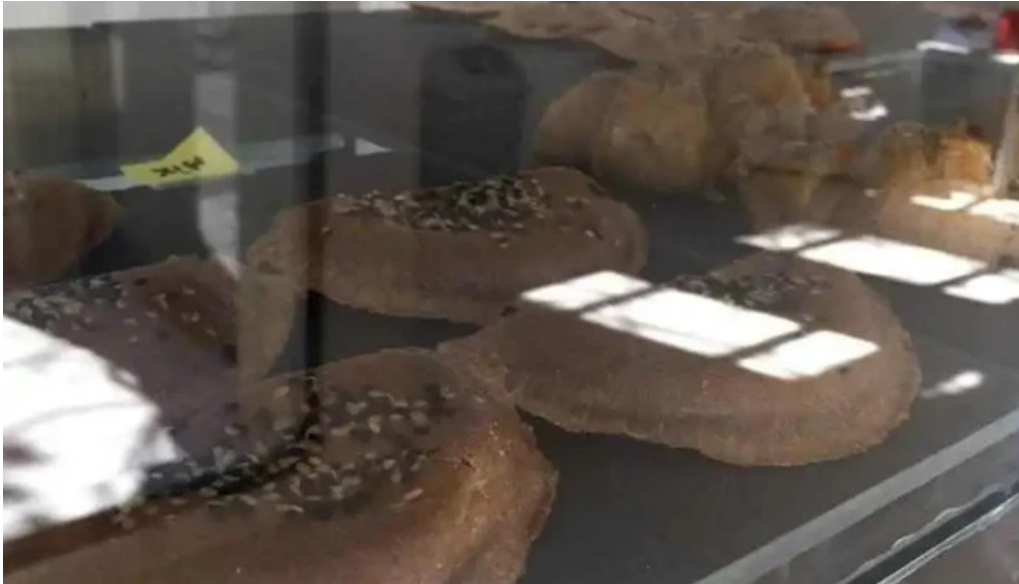
Mas sano tienda de alimentos saludables comida y bebida