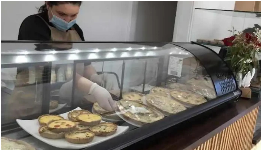
Mas sano tienda de alimentos saludables ambiente