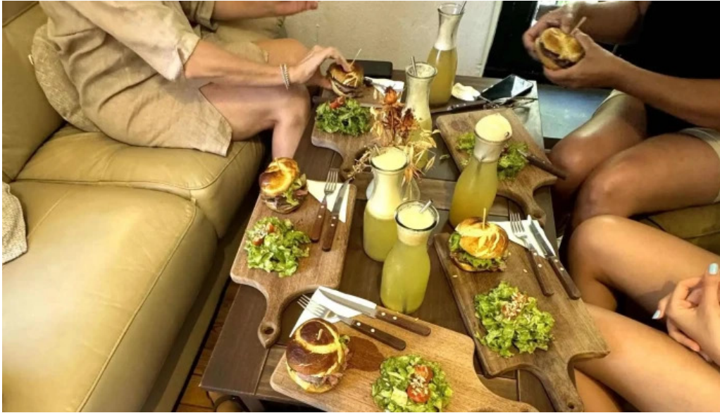
La checa comentario 4