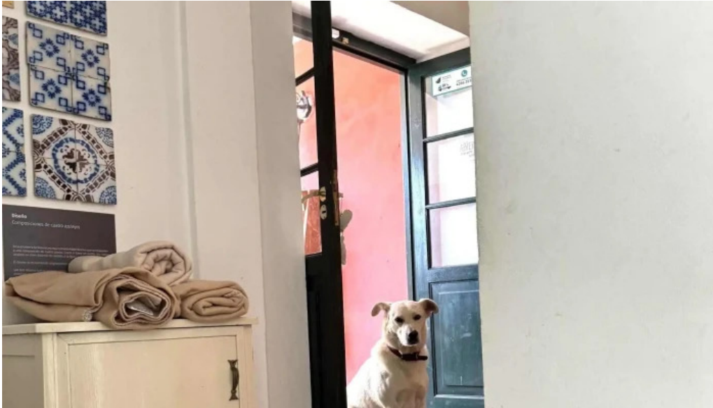
La checa comentario 2