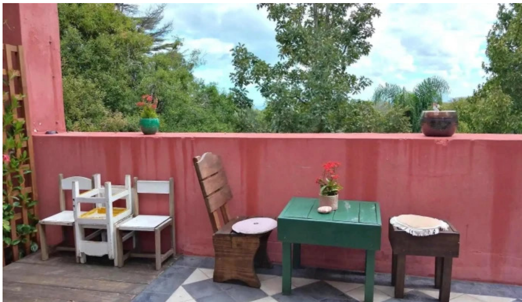
La checa ambiente