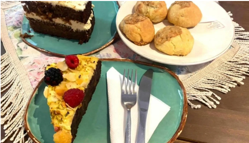
La checa coffee cake