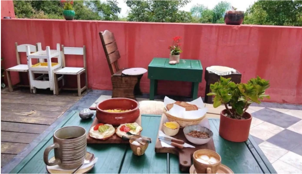
La checa comidas y bebidas