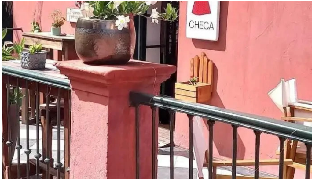
La checa maldonado