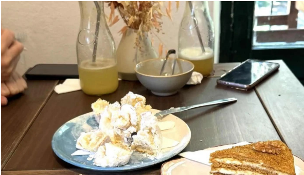
La checa comentario 1