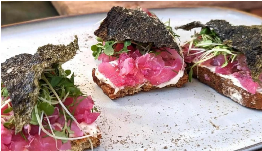
La checa comentario 5