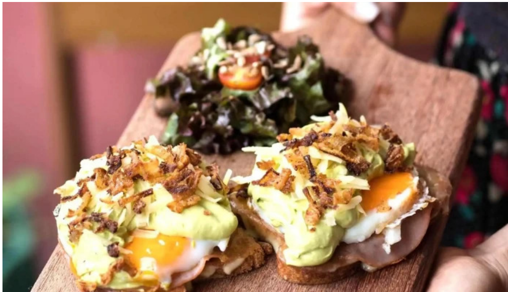
La checa del propietario