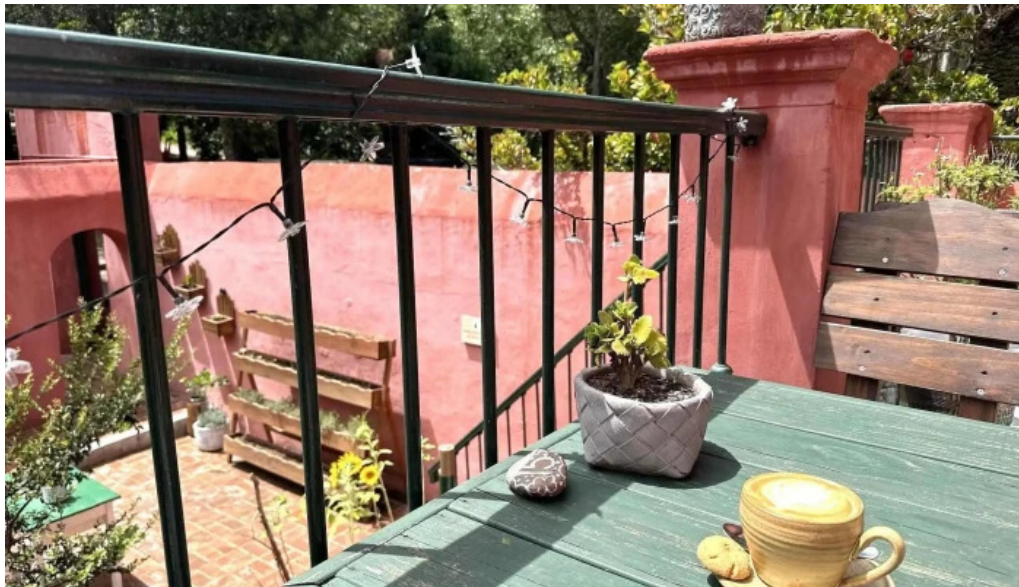
La checa cafe