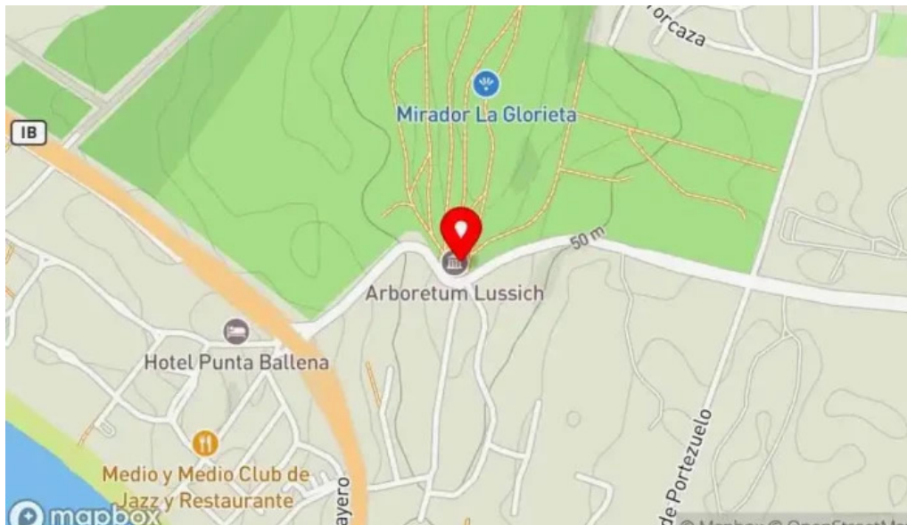
La checa mapa