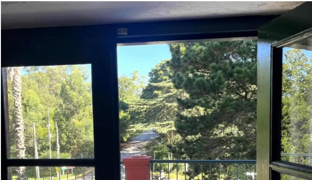
La checa comentario 3