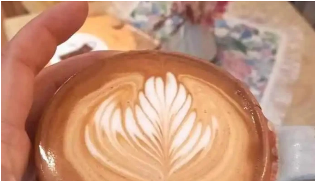
La checa capuchino