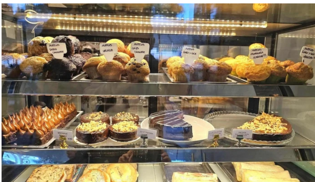
La dulceria xime torres ambiente