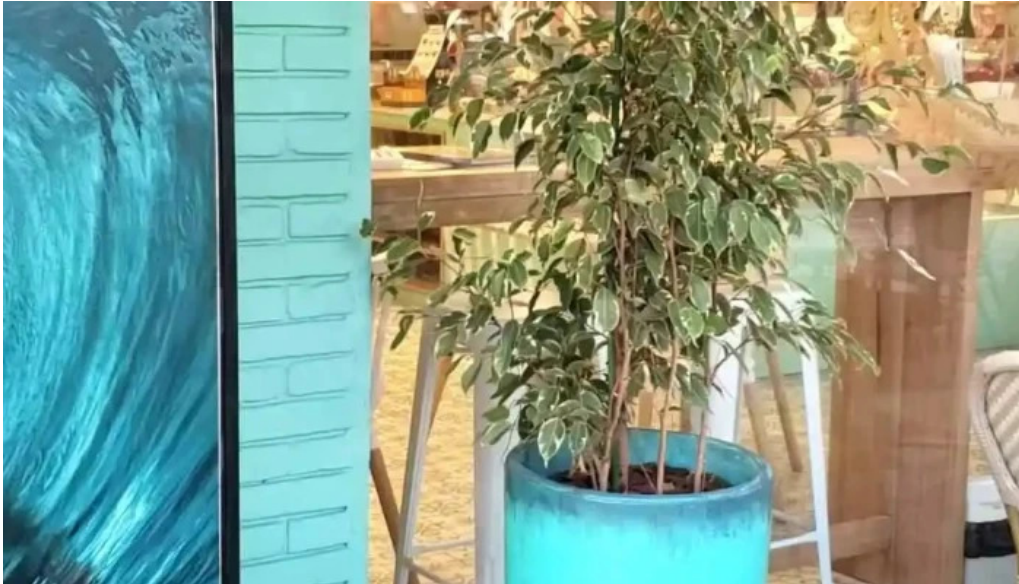
La dulceria xime torres videos