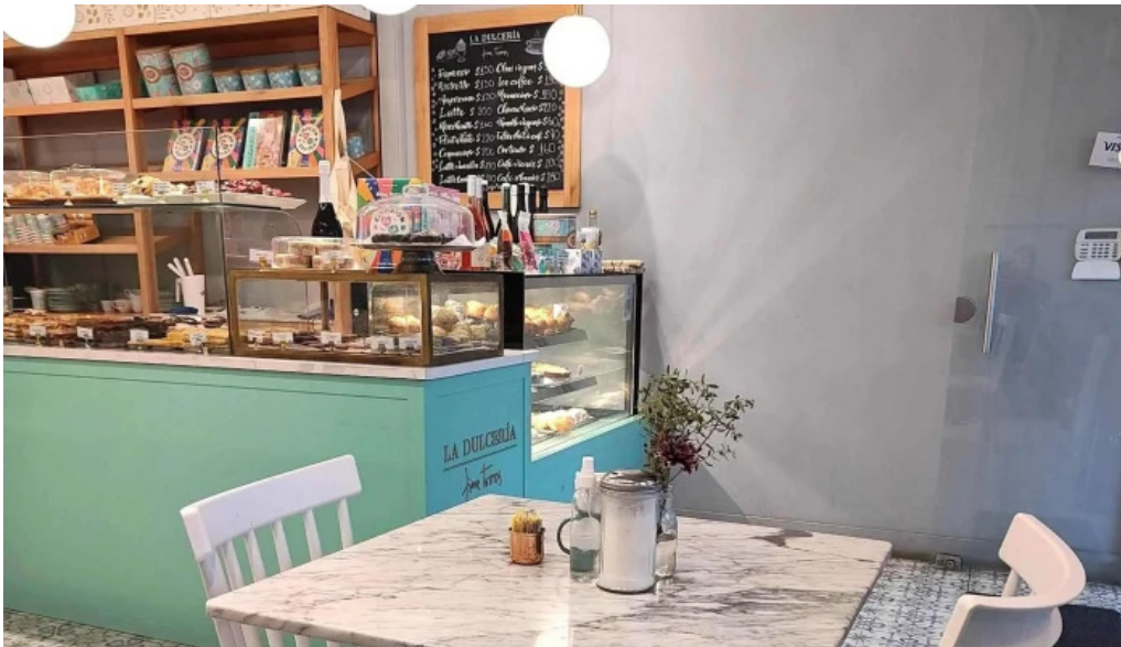
La dulceria xime torres comentario 6