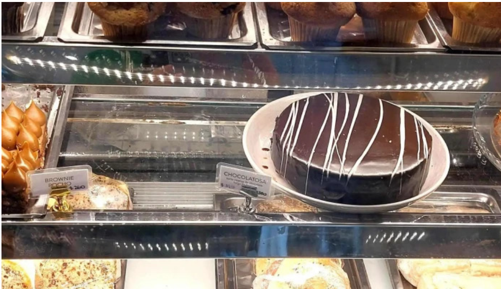
La dulceria xime torres comentario 5