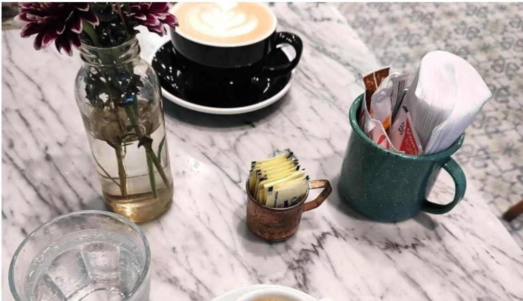
La dulceria xime torres comentario 4