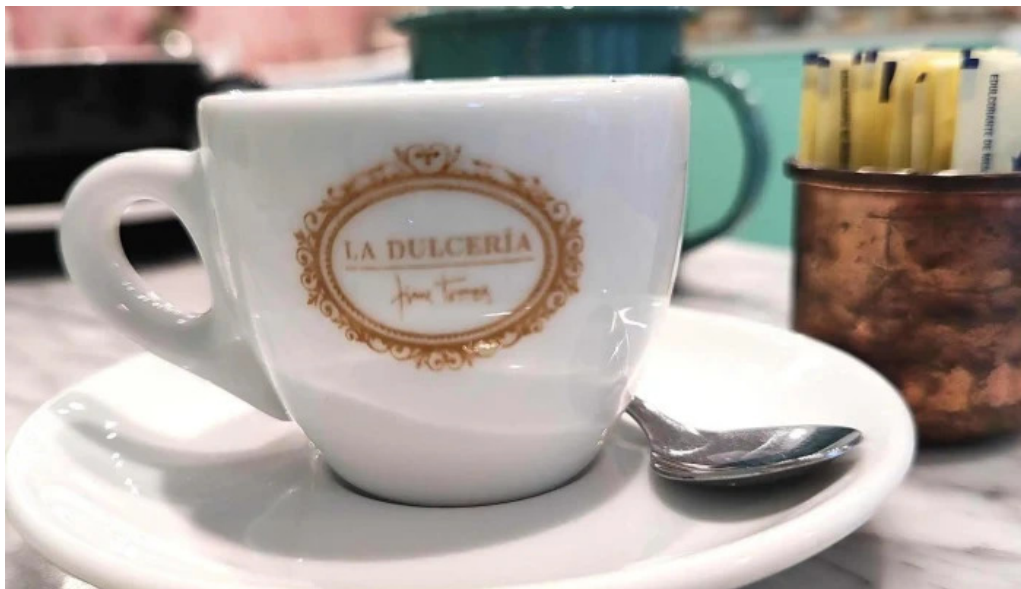
La dulceria xime torres comentario 7