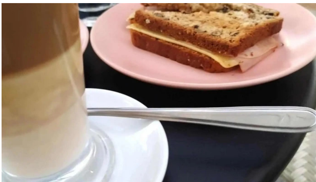
La dulceria xime torres cafe