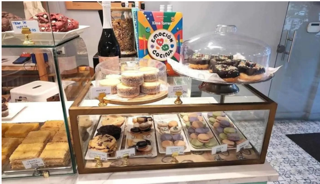
La dulceria xime torres montevideo