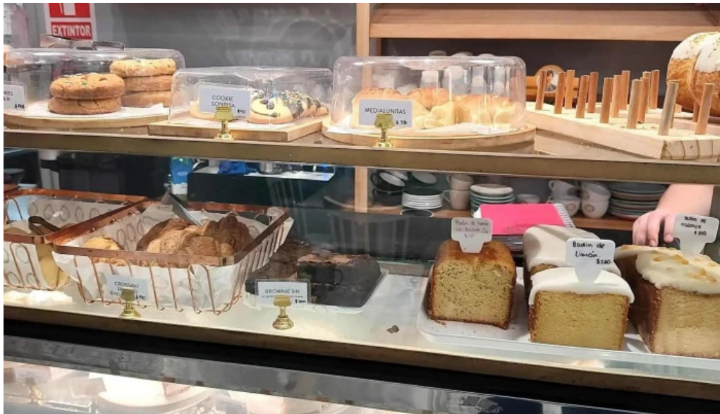
La dulceria xime torres comentario 8