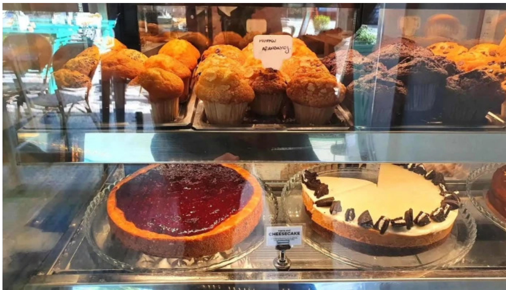
La dulceria xime torres comidas y bebidas