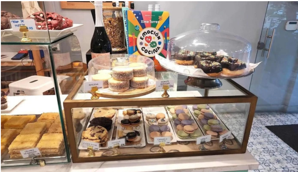
La dulceria xime torres todo