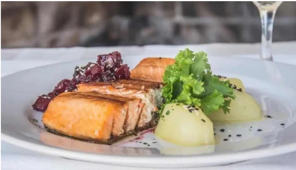
La corniche del propietario