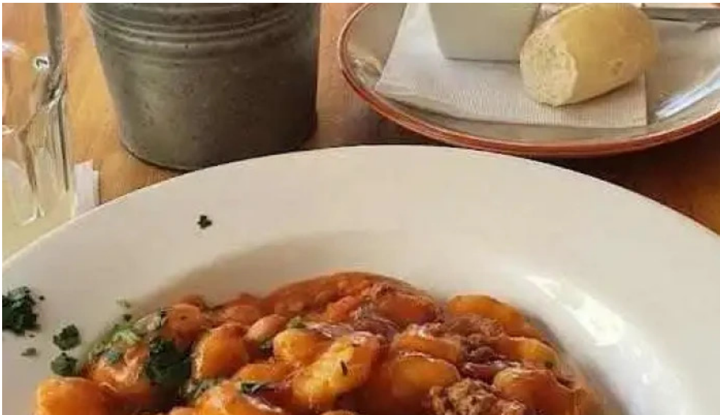
La corniche noqui