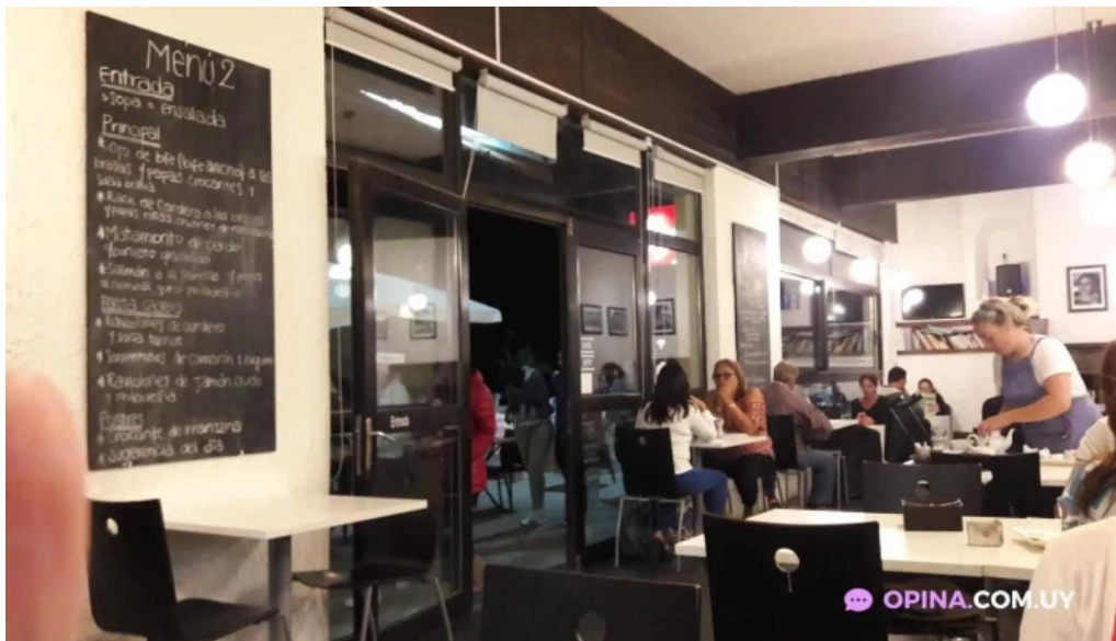
La corniche ambiente