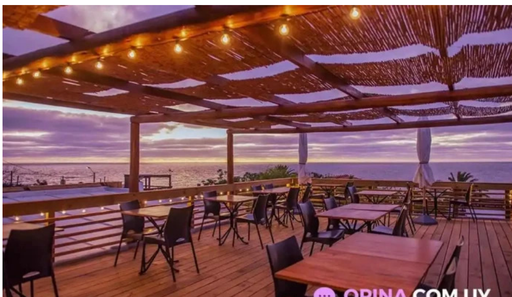
La corniche todas