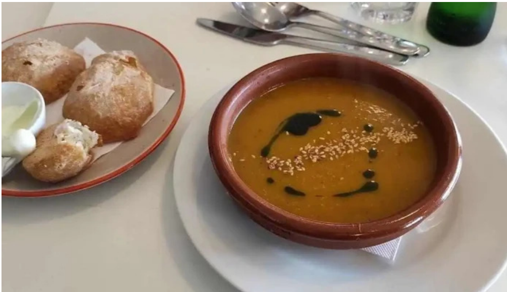
La corniche sopa de calabaza