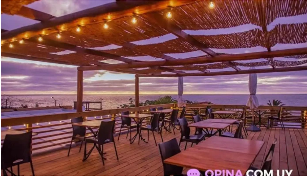
La corniche piriapolis