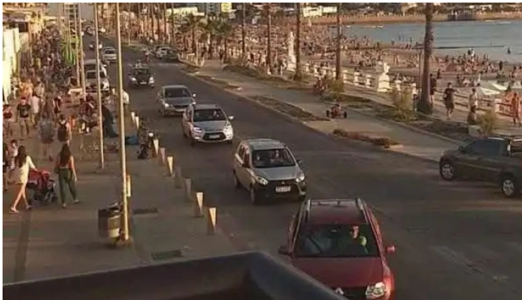
La corniche videos