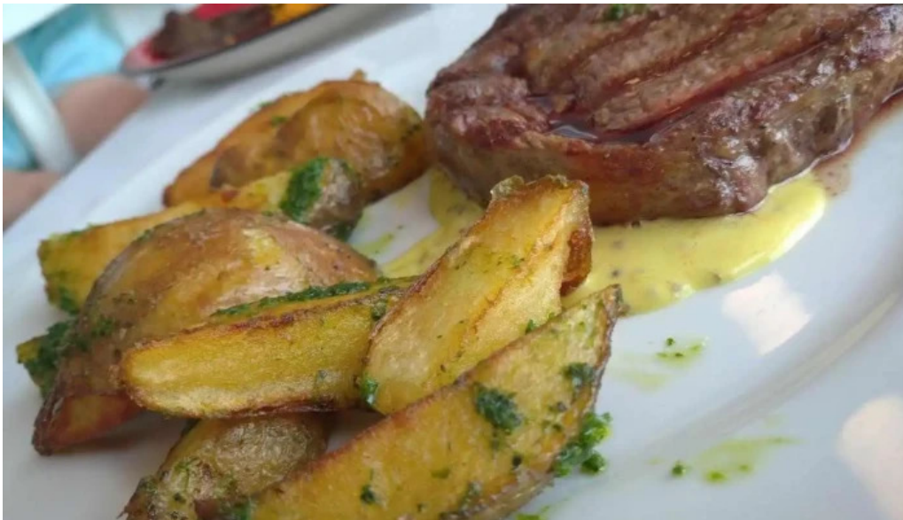
La corniche ribeye