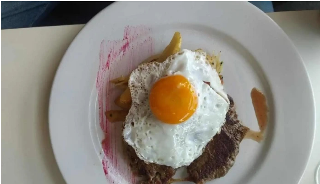
La corniche huevo frito