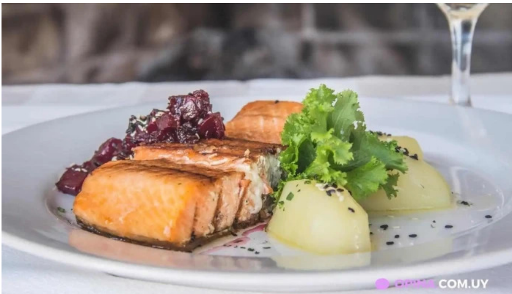
La corniche comida y bebida