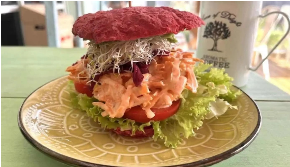
La casita de cari punta del este