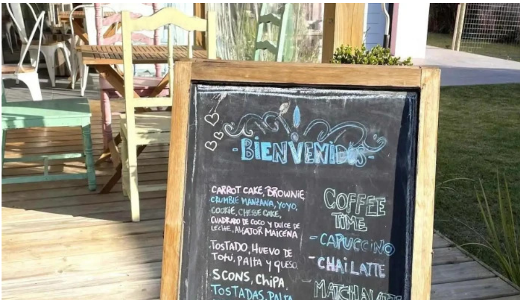
La casita de cari menu