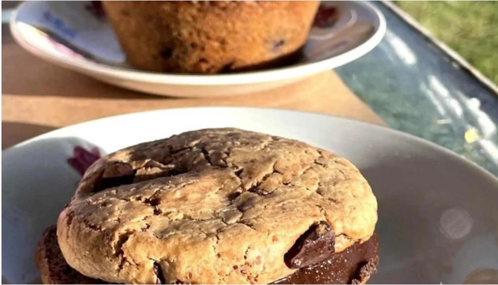
La casita de cari comentario 5