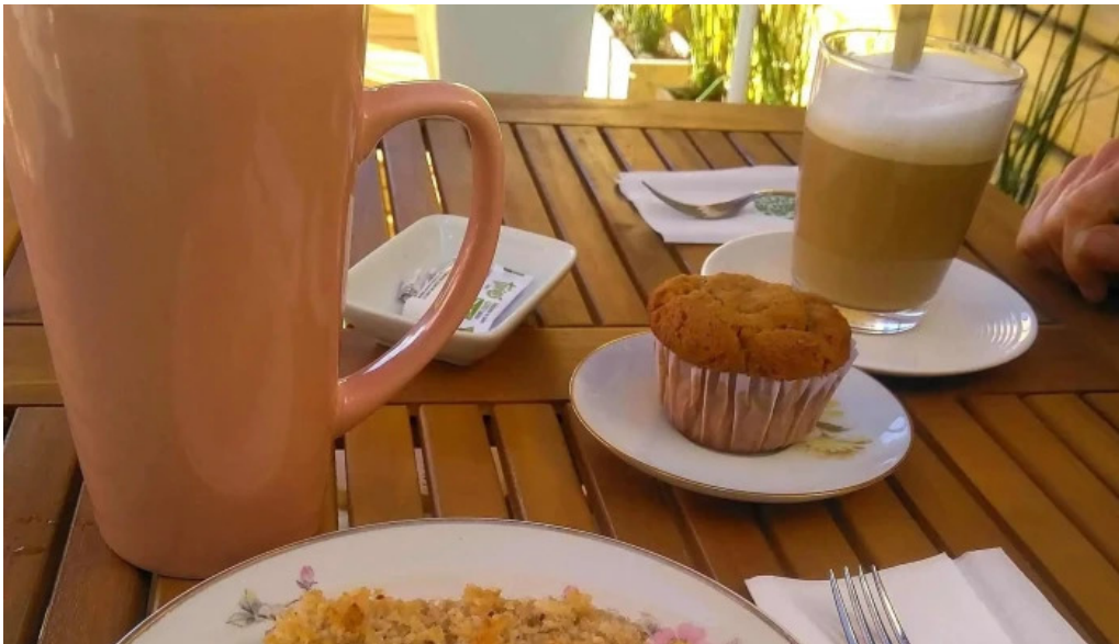
La casita de cari comentario 8