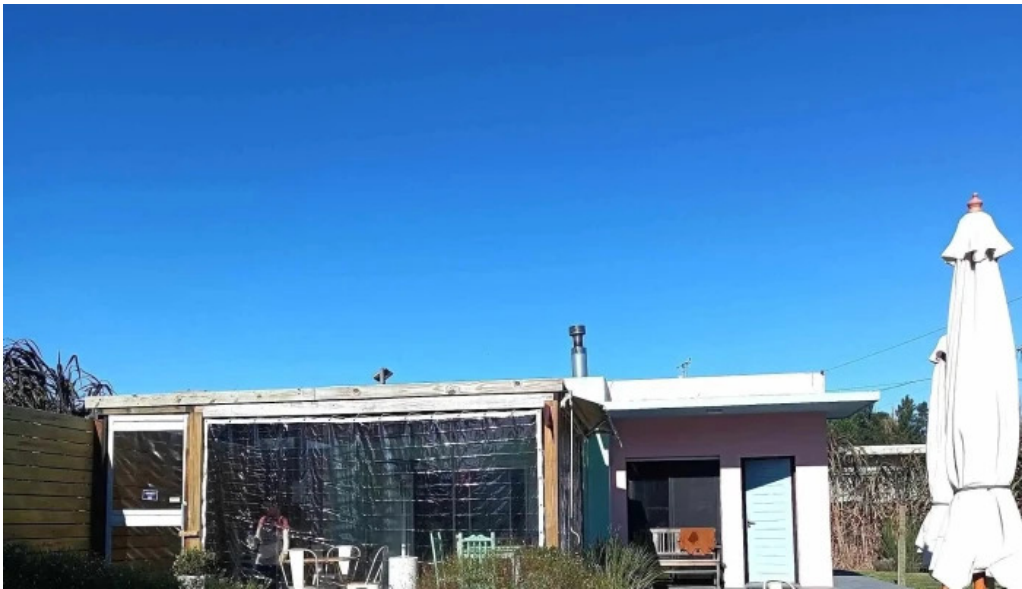
La casita de cari comentario 2