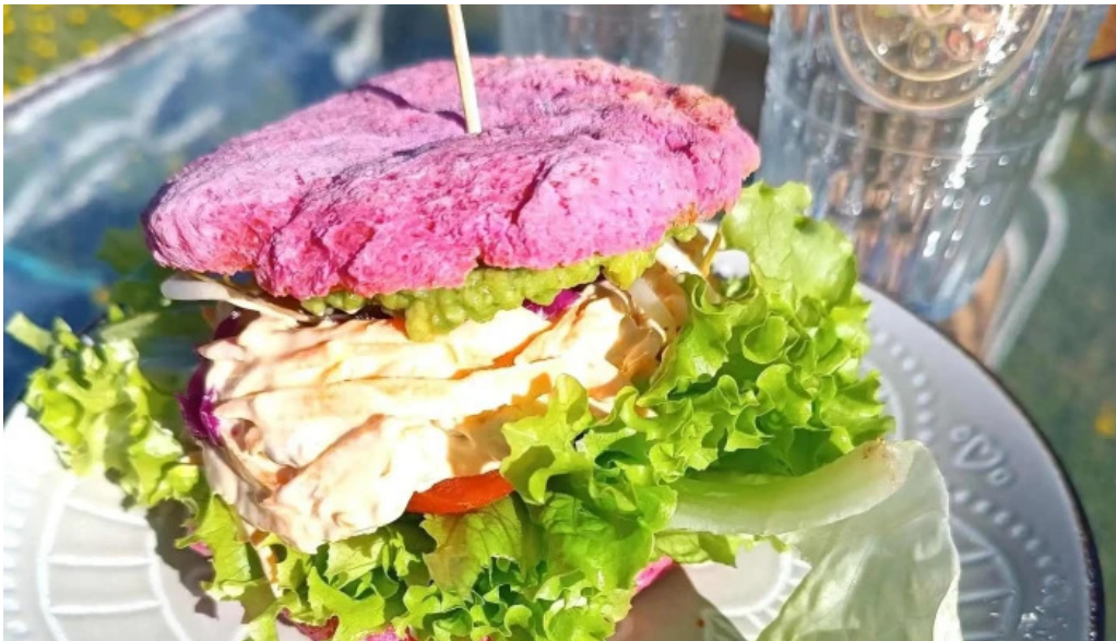
La casita de cari comentario 10