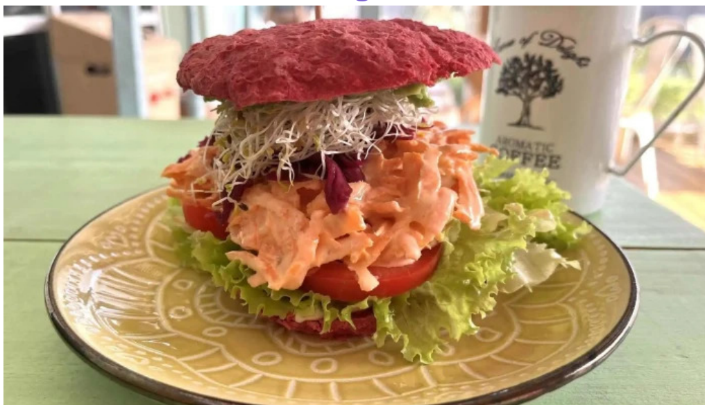
La casita de cari todo