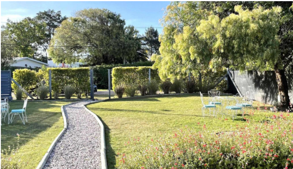
La casita de cari comentario 4