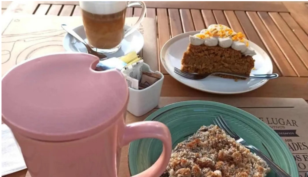
La casita de cari cafe