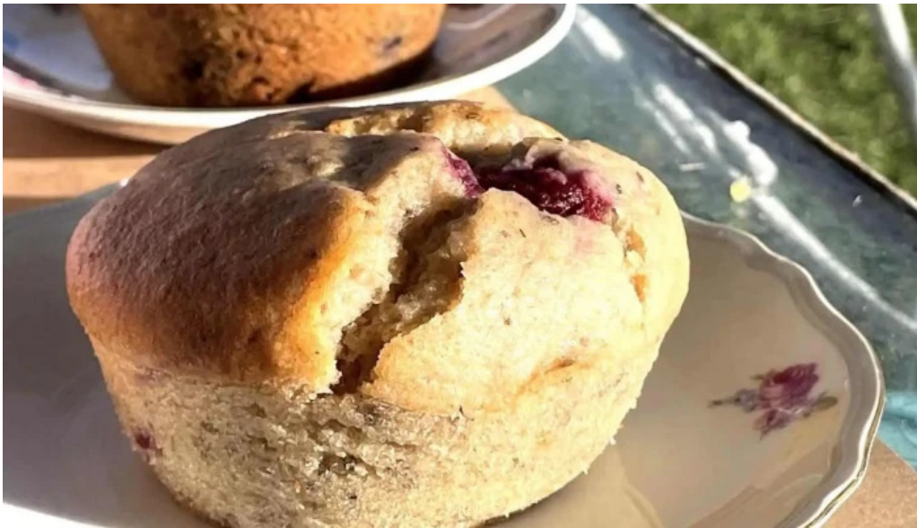
La casita de cari comidas y bebidas