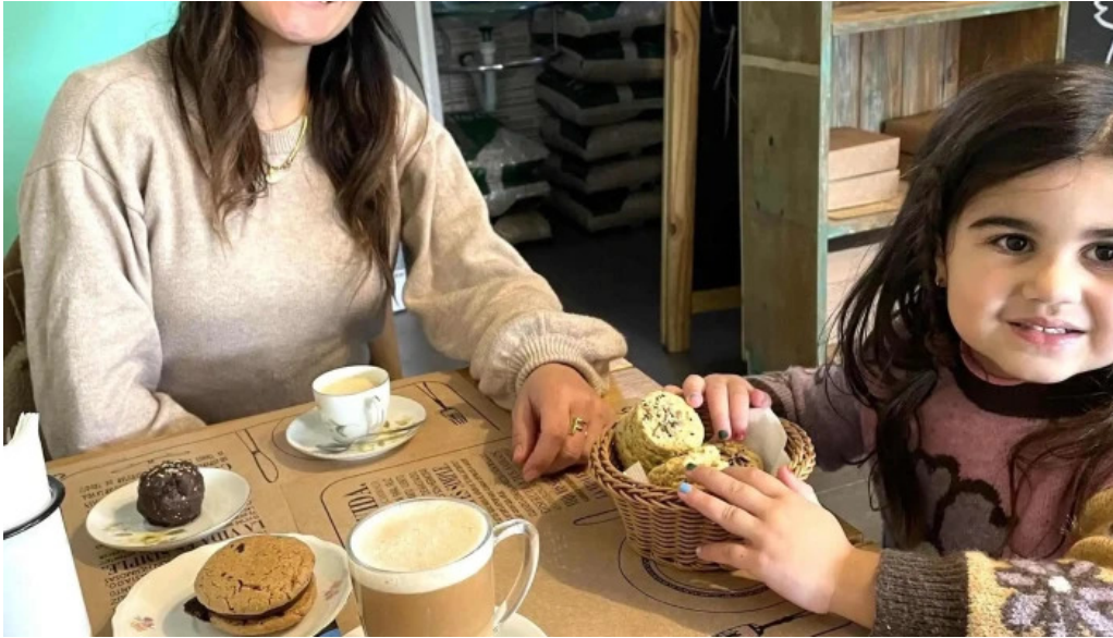
La casita de cari comentario 7