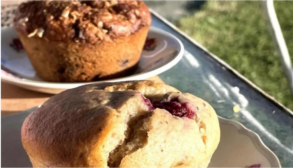
La casita de cari comentario 3