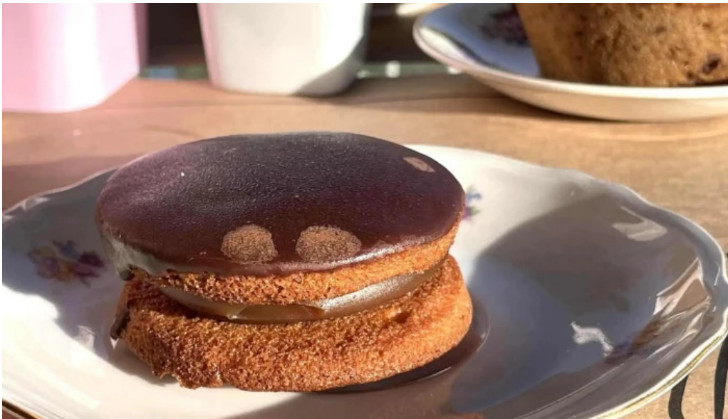
La casita de cari comentario 6