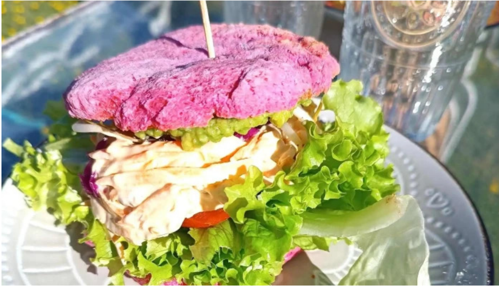
La casita de cari comentario 1