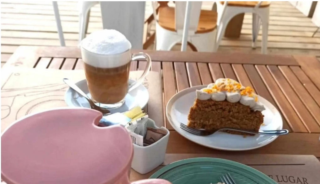
La casita de cari comentario 9