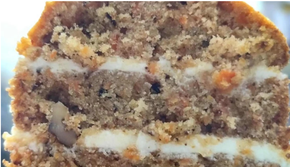
Kazoku cafeteria rotiseria churreria comentario 3