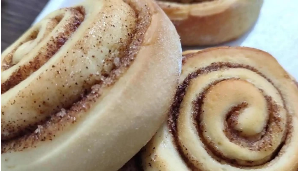
Kazoku cafeteria rotiseria churreria comidas y bebidas