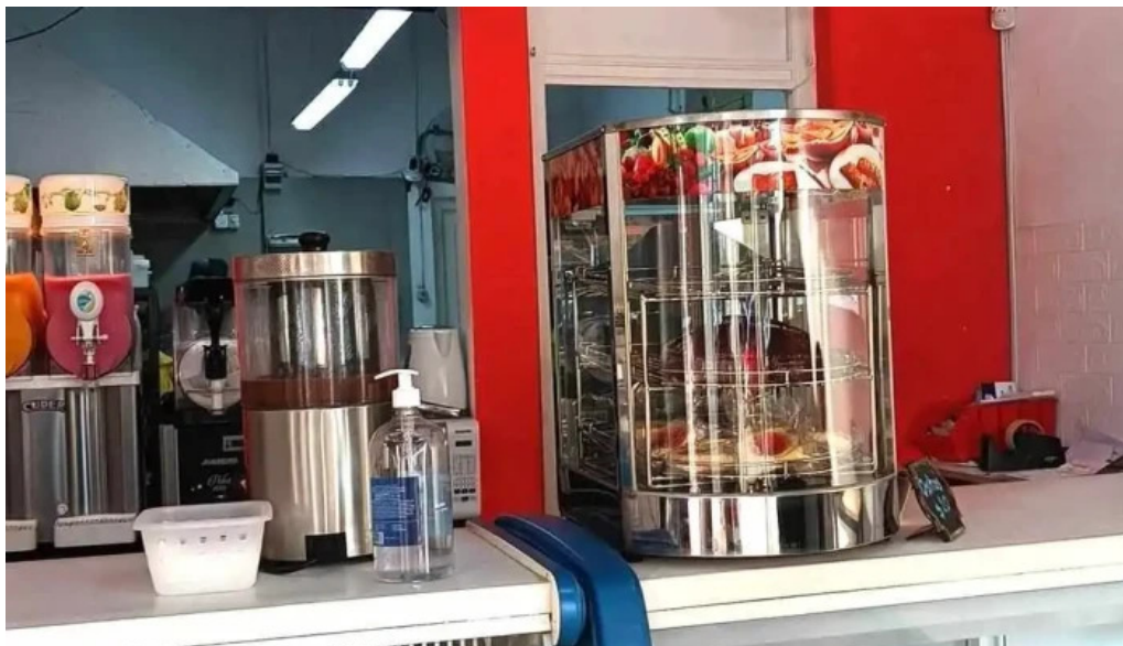
Kazoku cafeteria rotiseria churreria ambiente