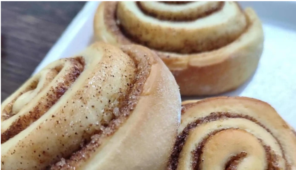
Kazoku cafeteria rotiseria churreria comentario 1