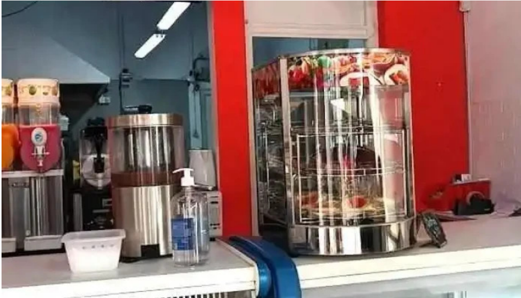
Kazoku cafeteria rotiseria churreria montevideo