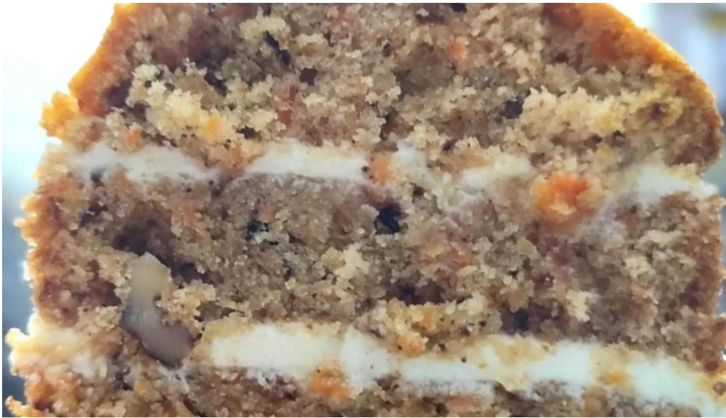
Kazoku cafeteria rotiseria churreria comentario 8