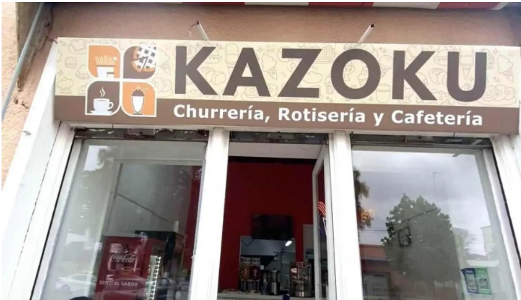
Kazoku cafeteria rotiseria churreria videos