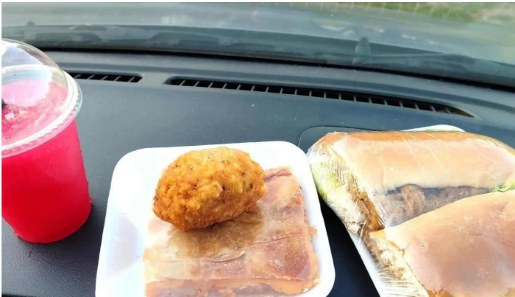
Kazoku cafeteria rotiseria churreria comentario 7