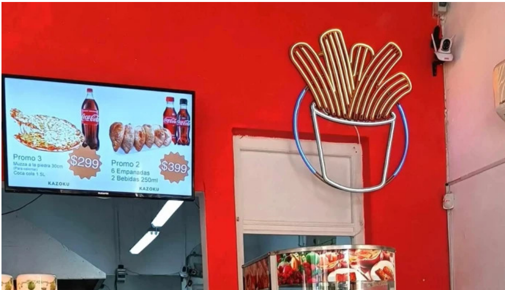
Kazoku cafeteria rotiseria churreria comentario 9