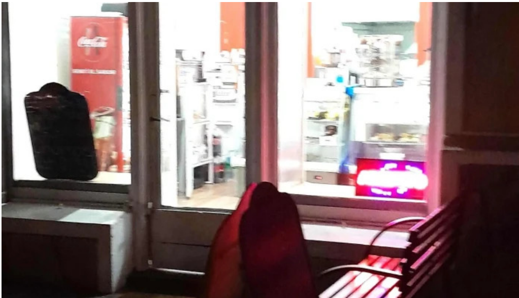
Kazoku cafeteria rotiseria churreria comentario 5