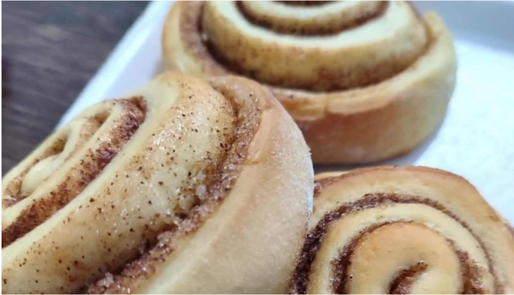
Kazoku cafeteria rotiseria churreria comentario 6