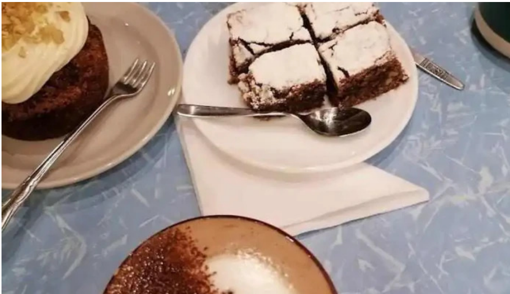
Forajida cafe coffee cake