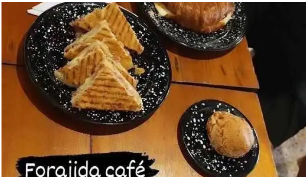
Forajida cafe videos