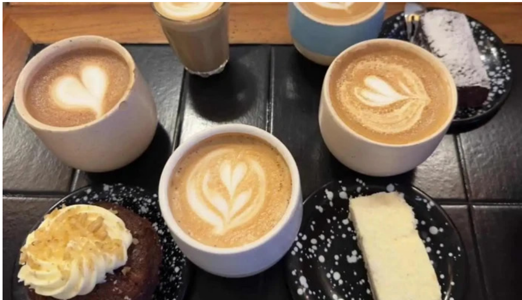
Forajida cafe cortado