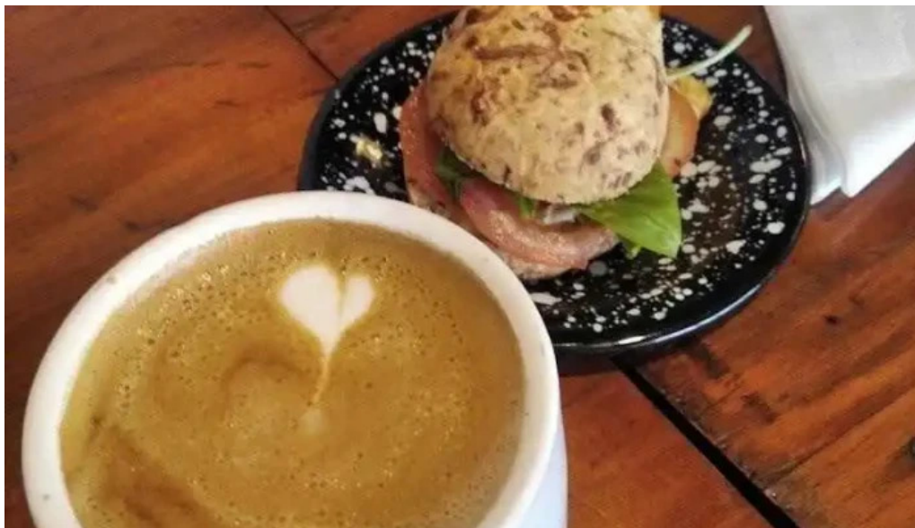
Forajida cafe mas recientes