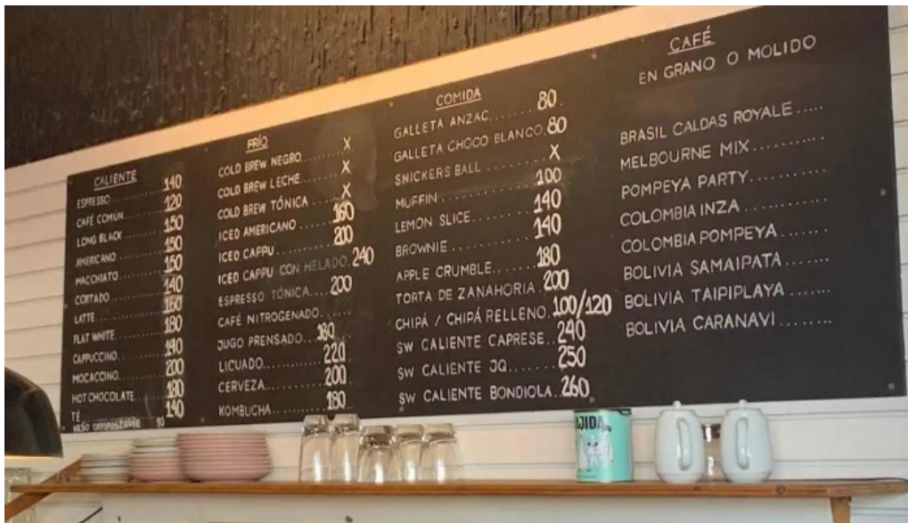
Forajida cafe menu