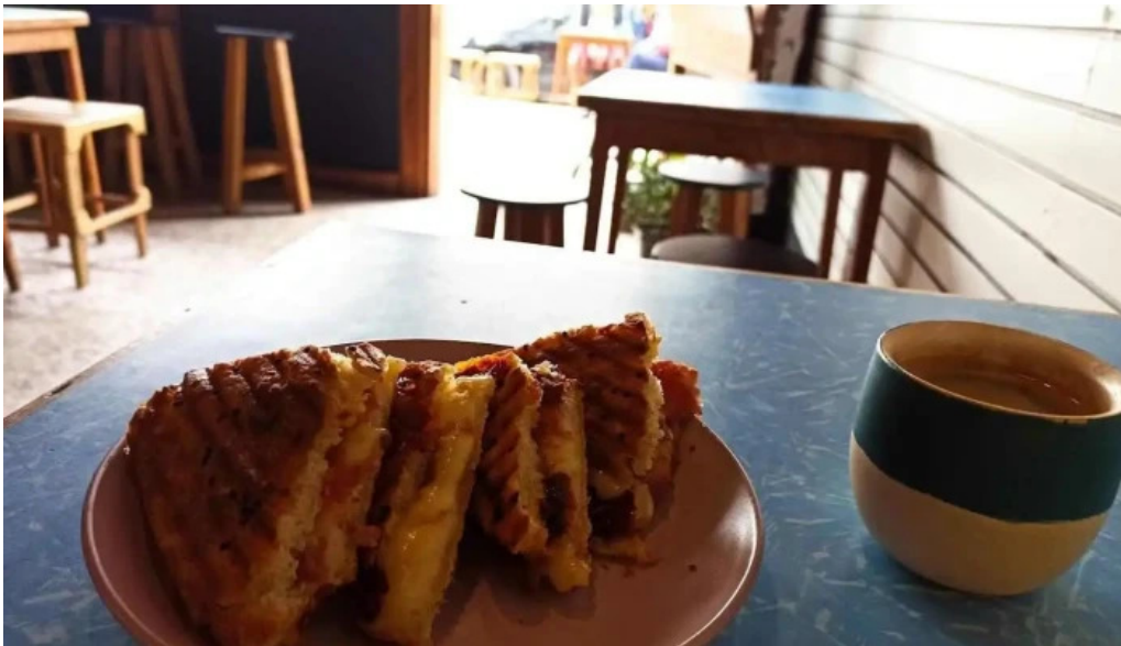
Forajida cafe comida y bebida