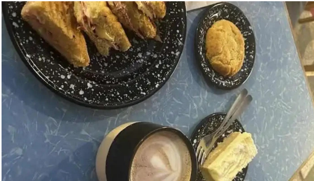
Forajida cafe cafe