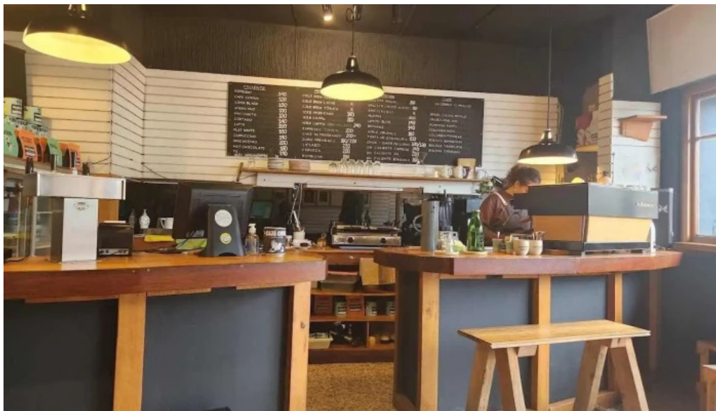
Forajida cafe ambiente