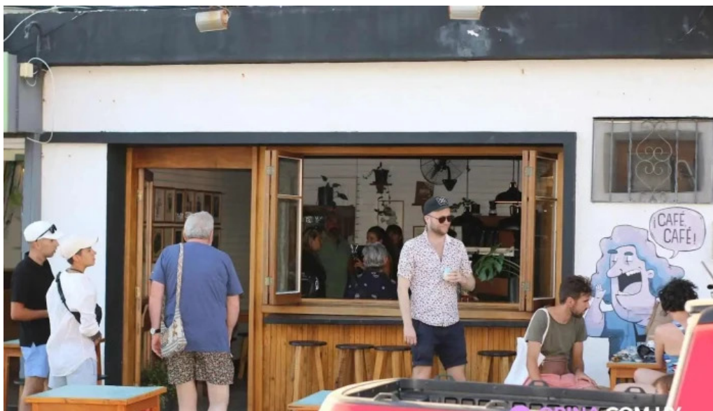
Forajida cafe todas