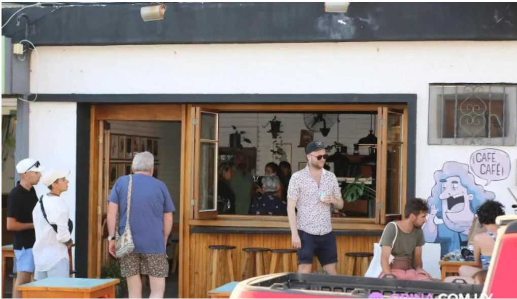
Forajida cafe piriapolis