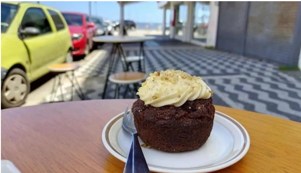
Forajida cafe muffin