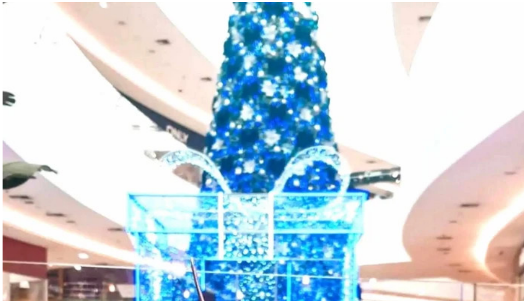
El palacio del cafe comentario 6