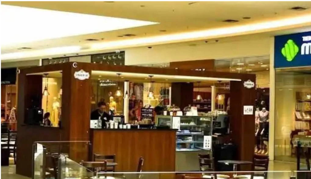
El palacio del cafe las piedras