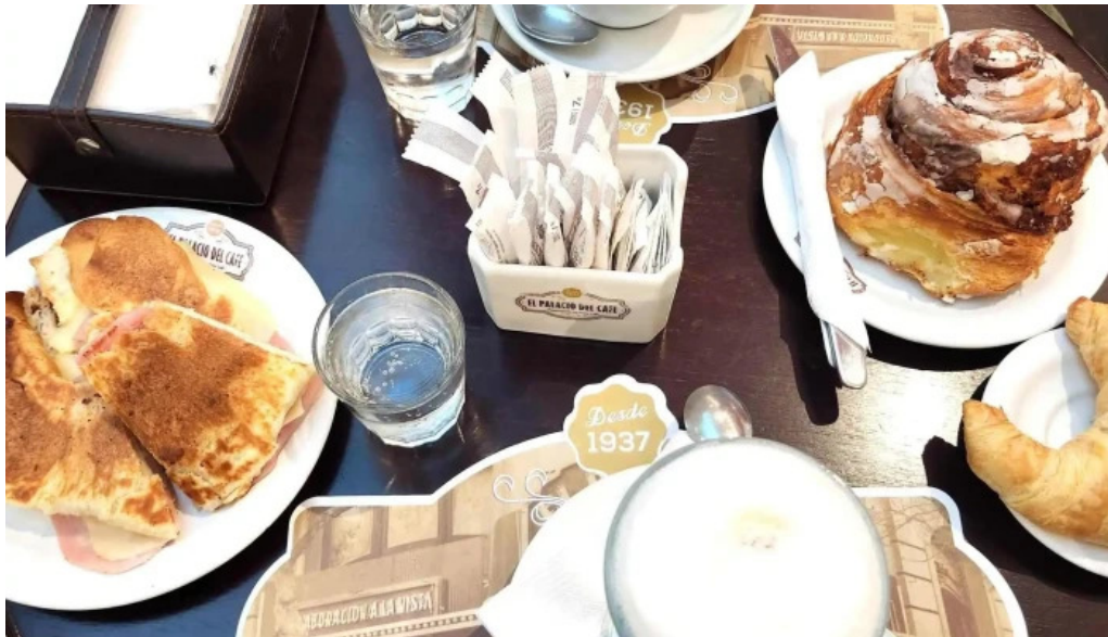
El palacio del cafe comentario 7