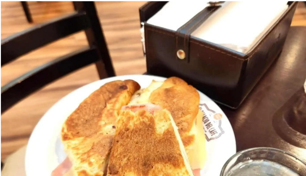
El palacio del cafe comentario 5