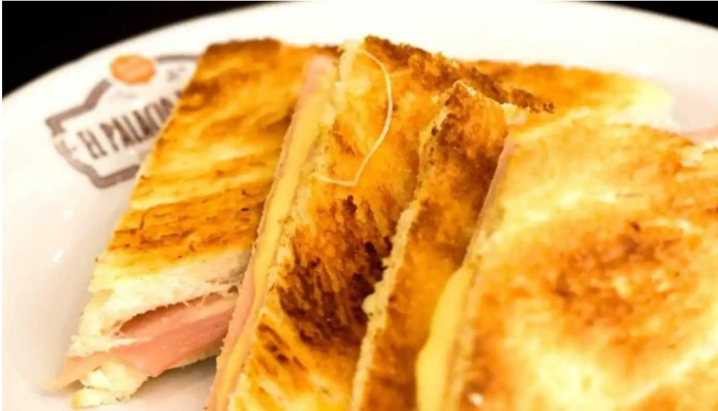
El palacio del cafe del propietario