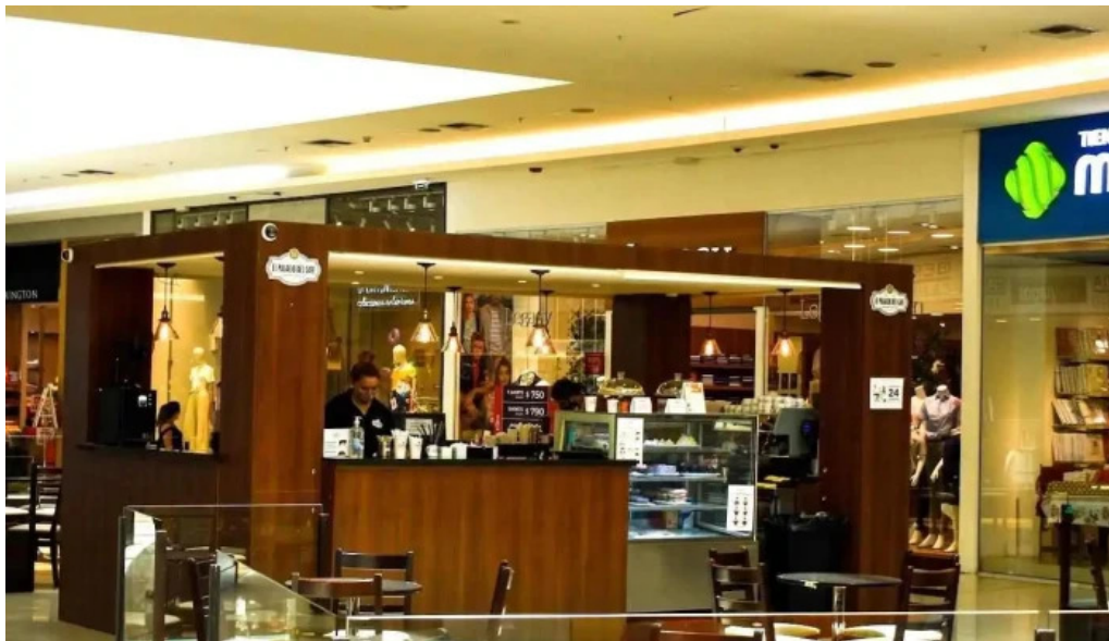
El palacio del cafe todo