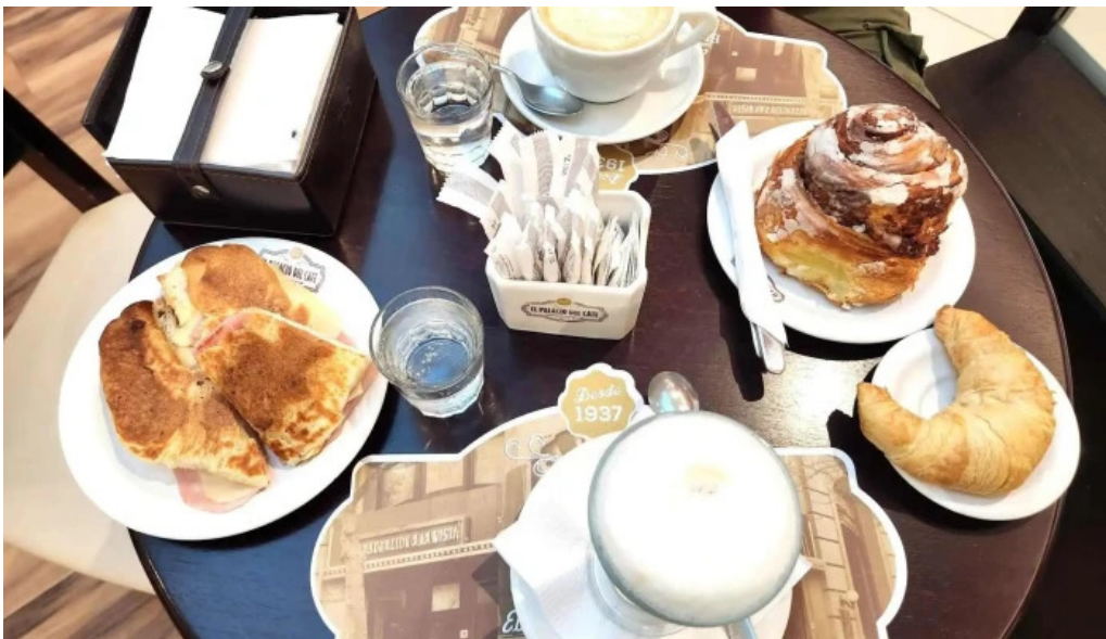
El palacio del cafe cafe