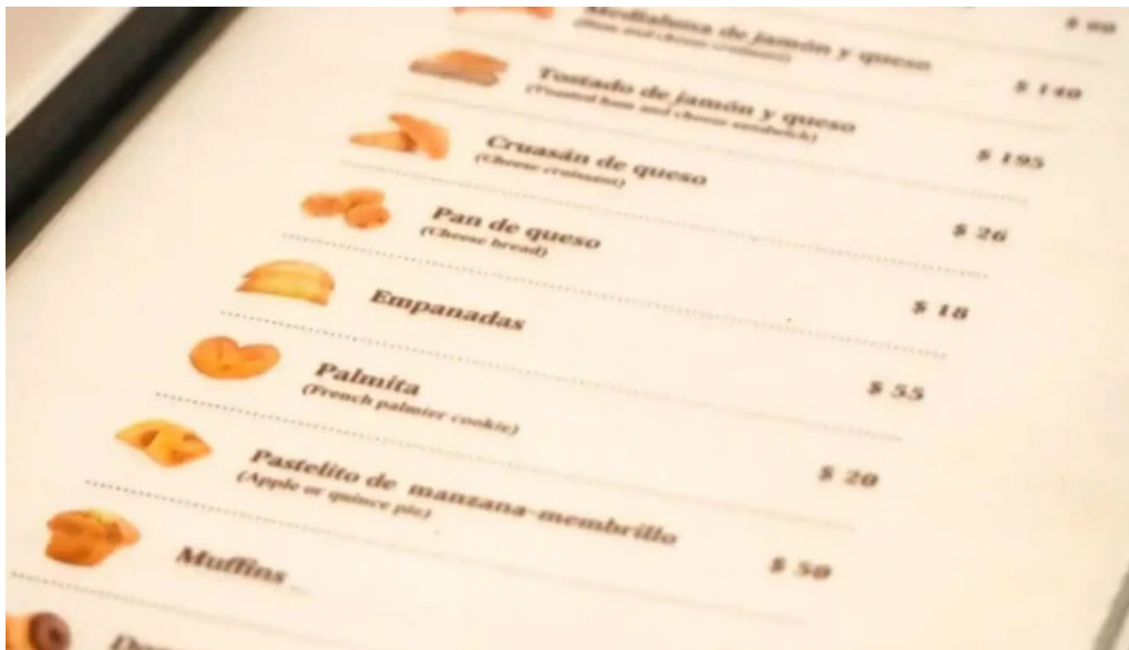
El palacio del cafe menu