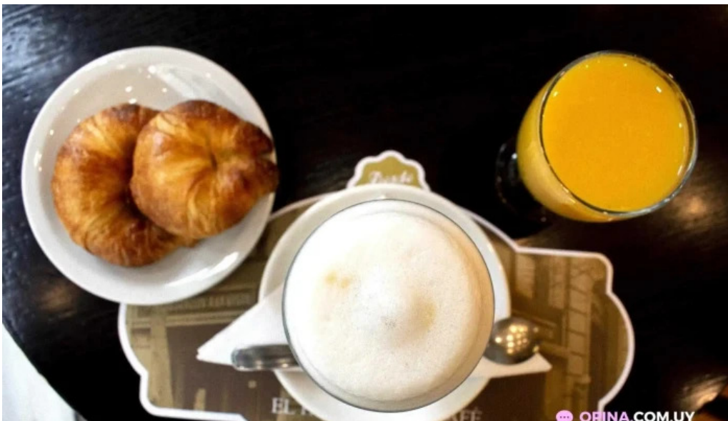
El palacio del cafe jugo