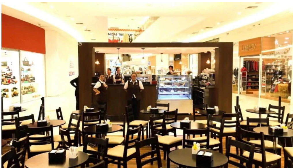
El palacio del cafe ambiente