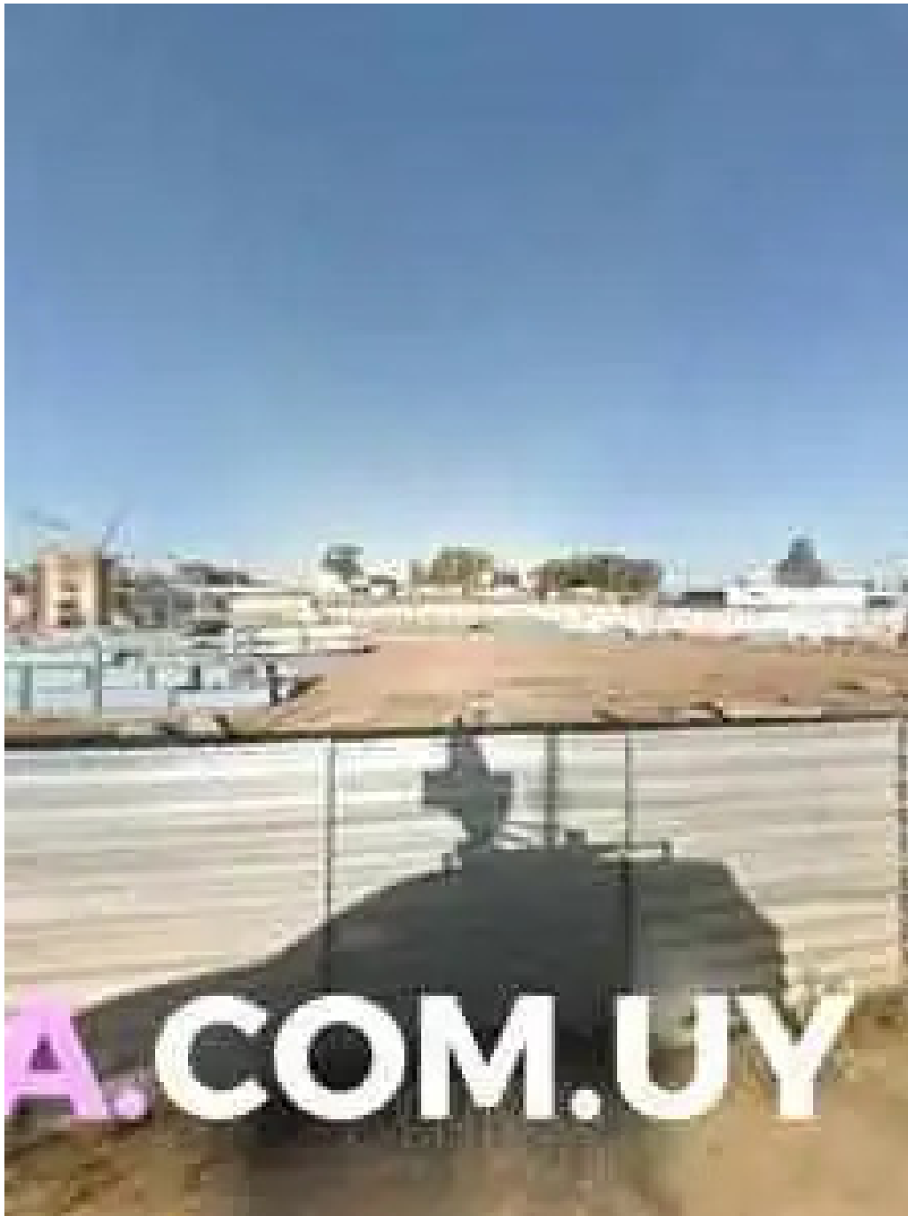
El palacio del cafe street view y 360