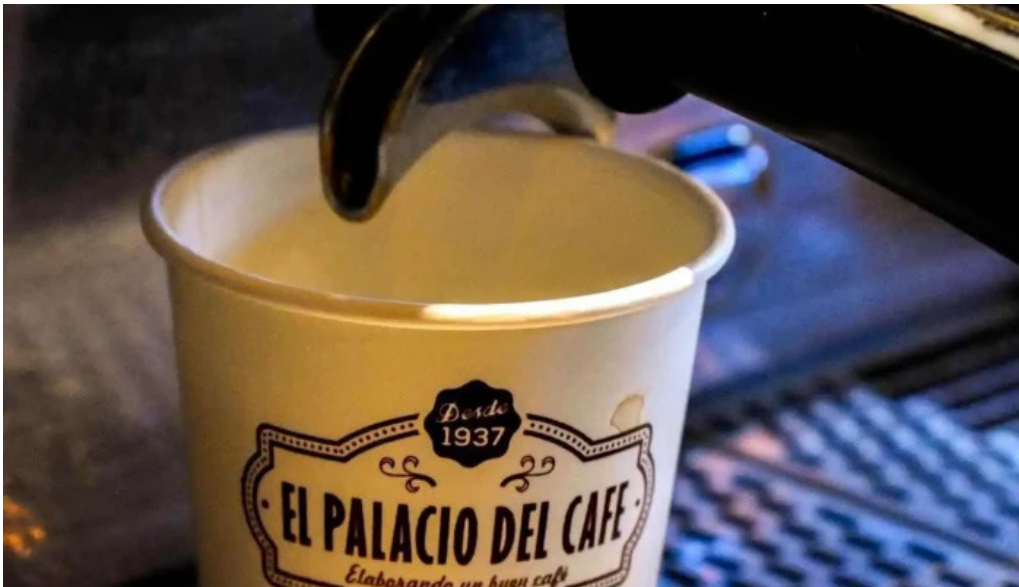
El palacio del cafe comidas y bebidas