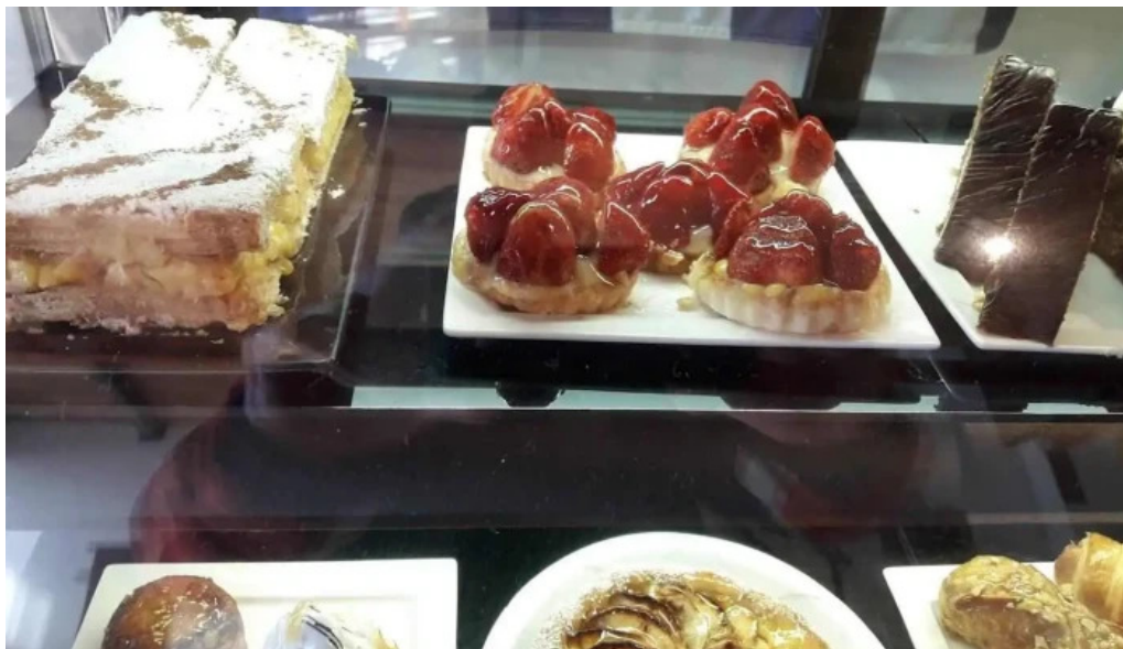
Dusoleil comida y bebida