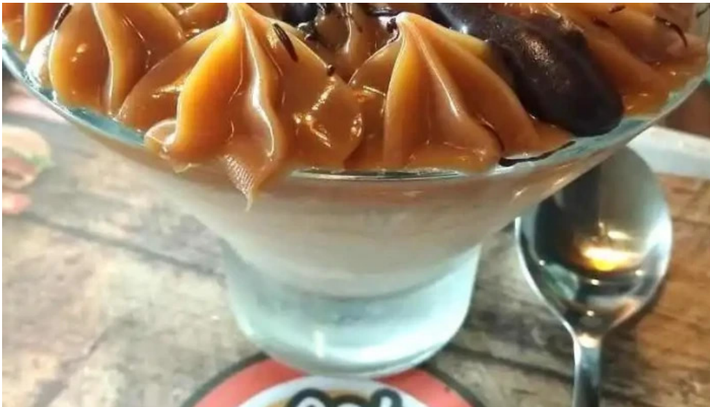
Eatfull comida y bebida