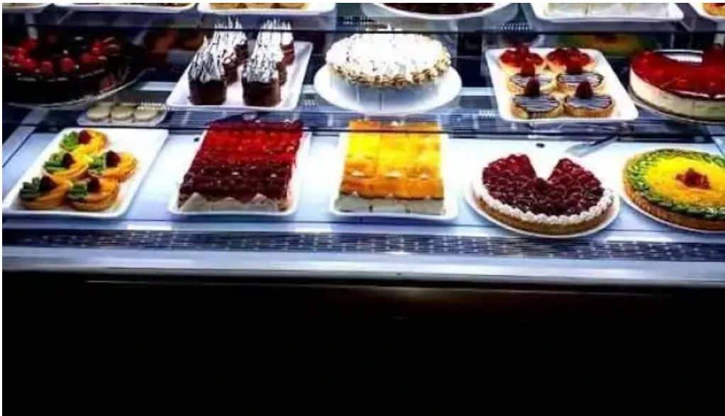
Eatfull del propietario