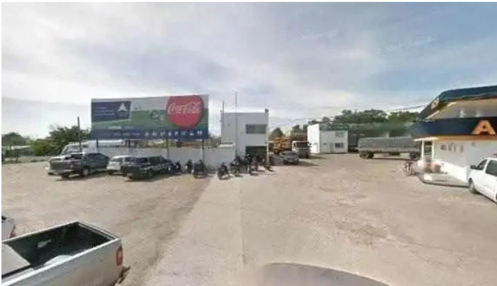
Eatfull street view y 360