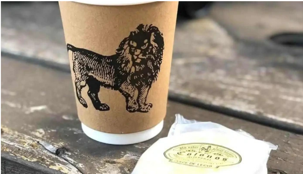
Colonos fabrica de alfajores comidas y bebidas