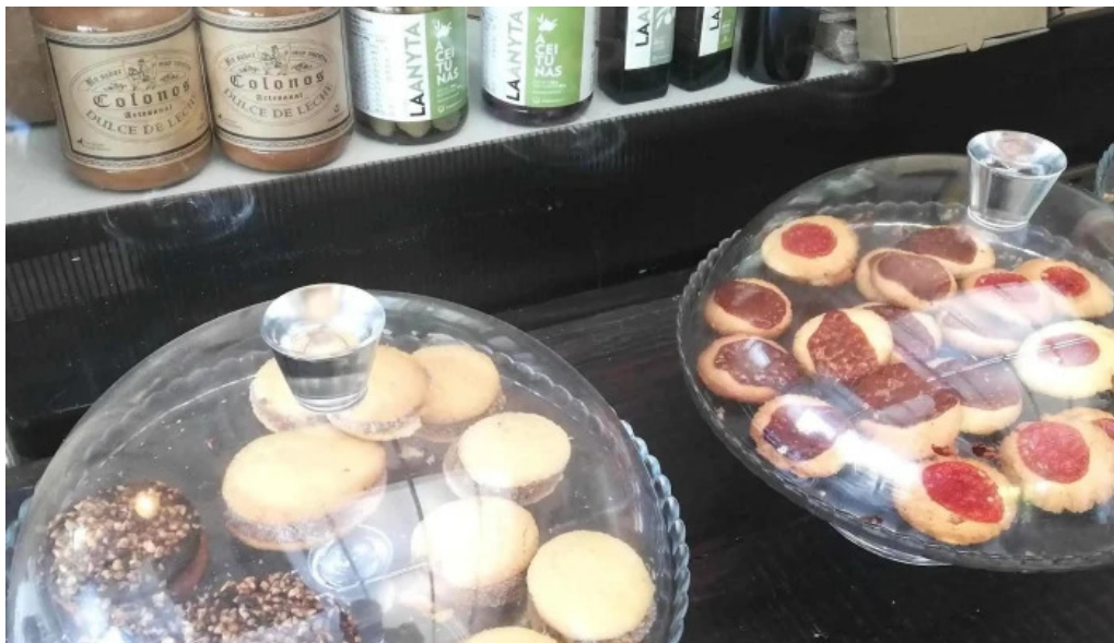
Colonos fabrica de alfajores comentario 4