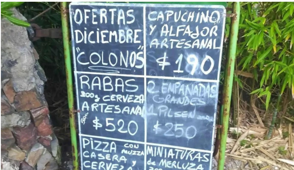
Colonos fabrica de alfajores menu