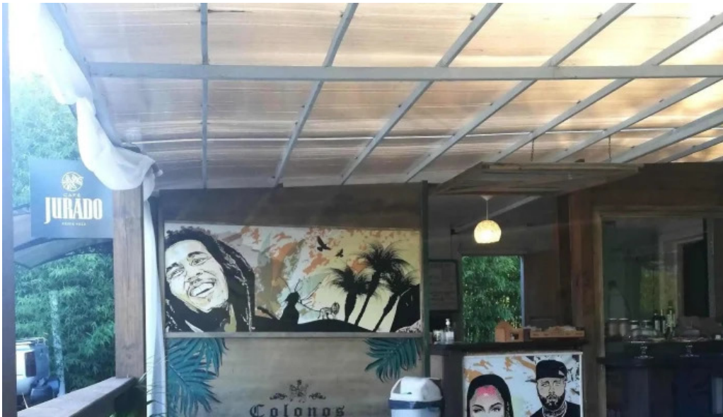
Colonos fabrica de alfajores comentario 2