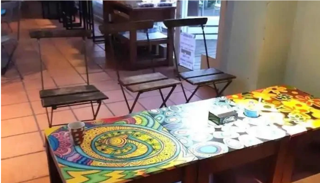
Colonos fabrica de alfajores punta ballena