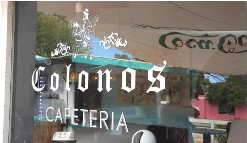
Colonos fabrica de alfajores comentario 6