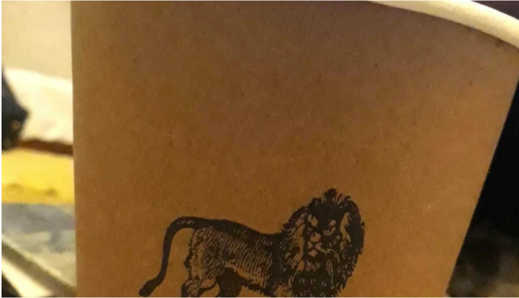
Colonos fabrica de alfajores comentario 7