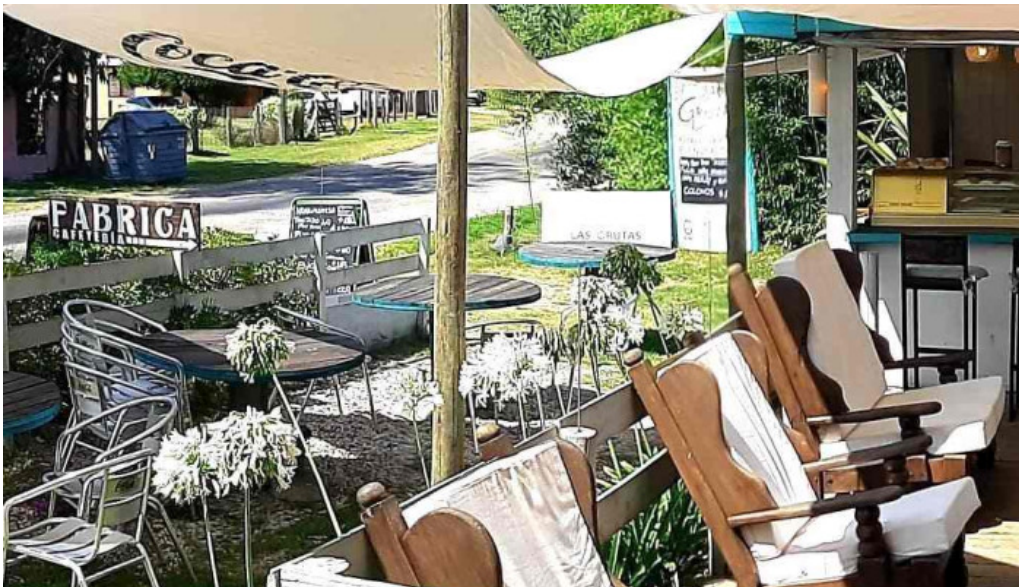
Colonos fabrica de alfajores ambiente