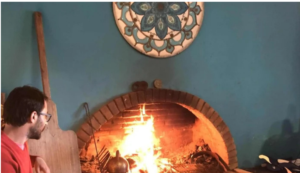
Colonos fabrica de alfajores comentario 8