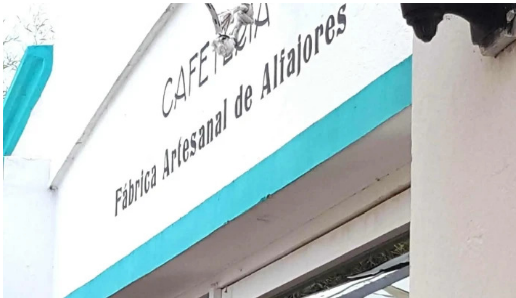
Colonos fabrica de alfajores comentario 5