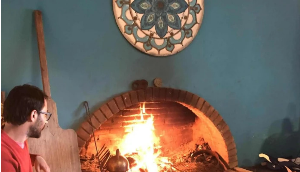
Colonos fabrica de alfajores comentario 1