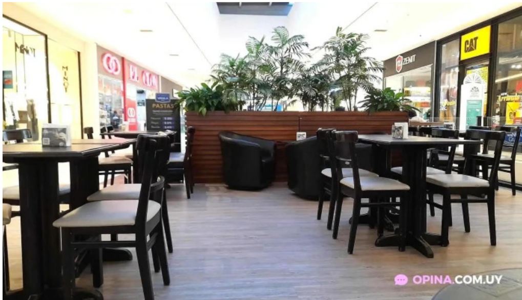
Porto vanilla cafe ciudad de la costa