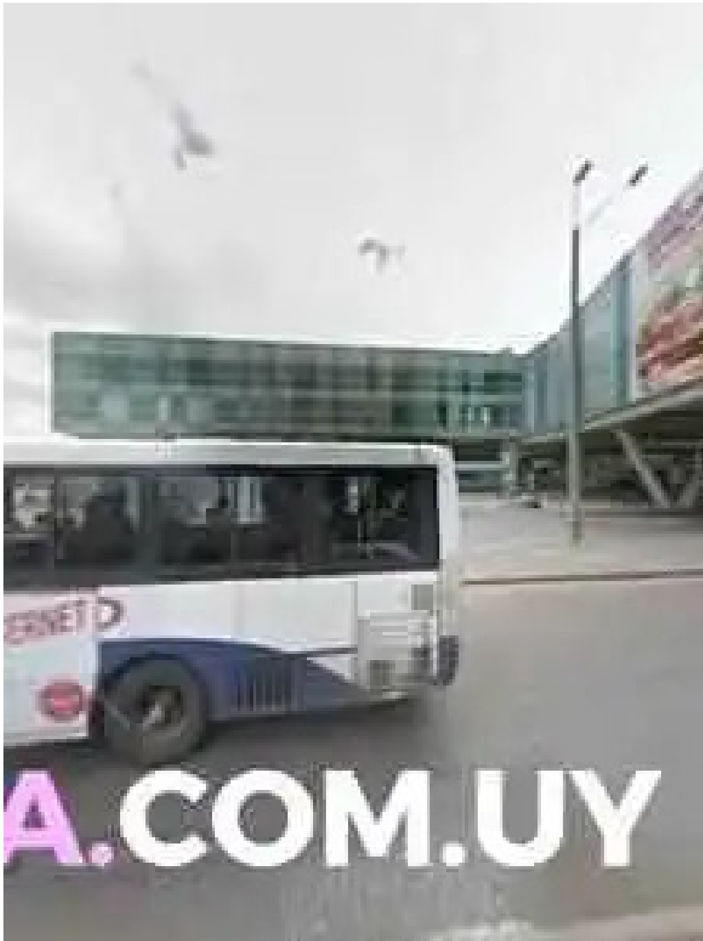
Porto vanilla cafe street view y 360