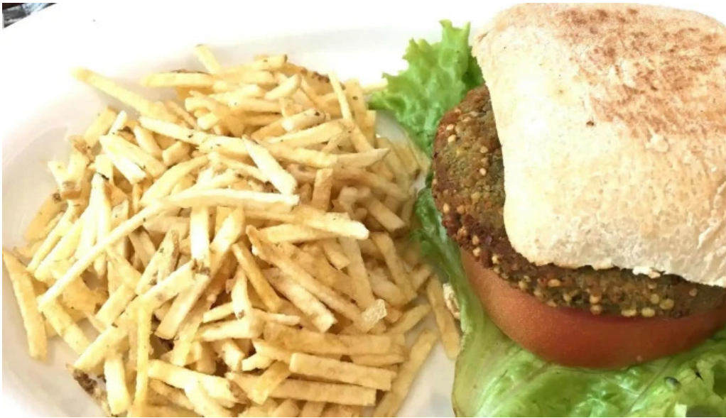
Porto vanilla cafe comentario 4