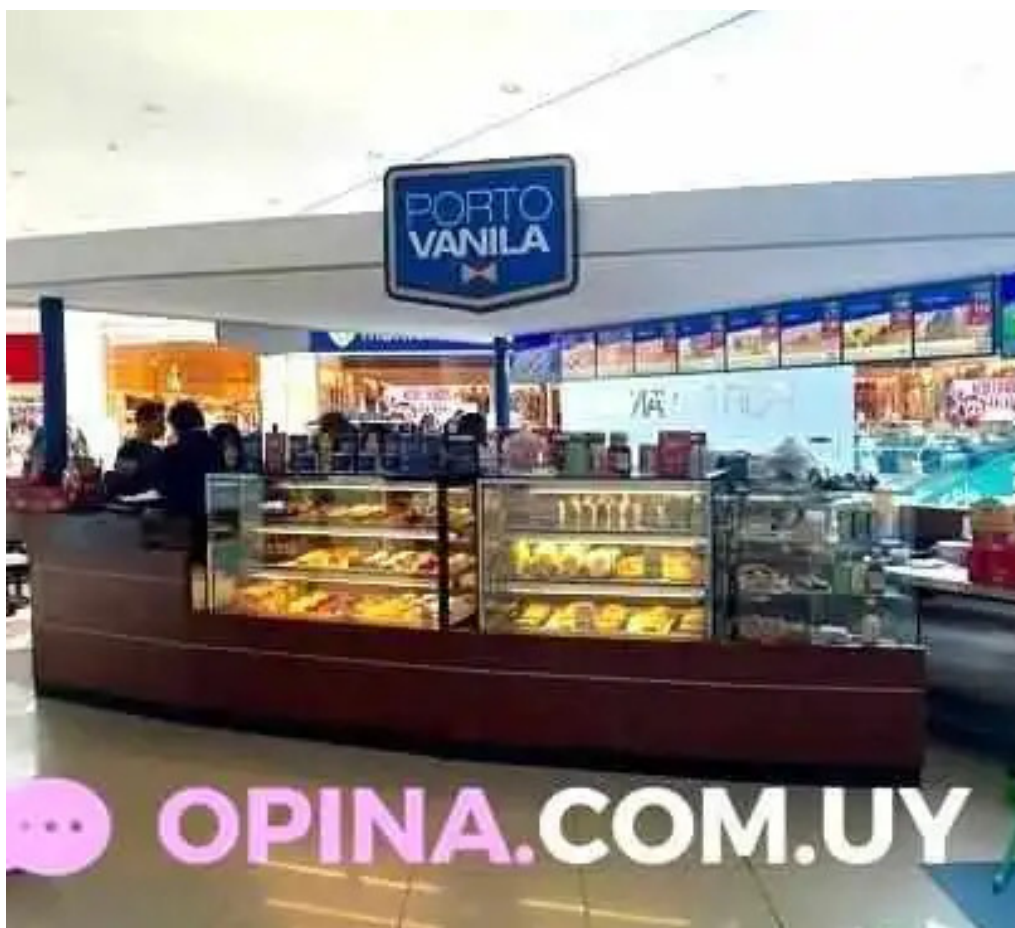
Porto vanilla cafe ambiente