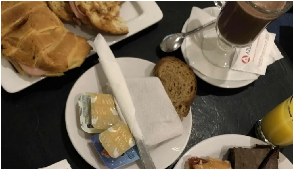
Porto vanilla caffe comentario 6