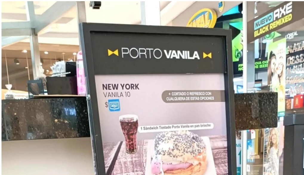
Porto vanilla cafe comentario 8