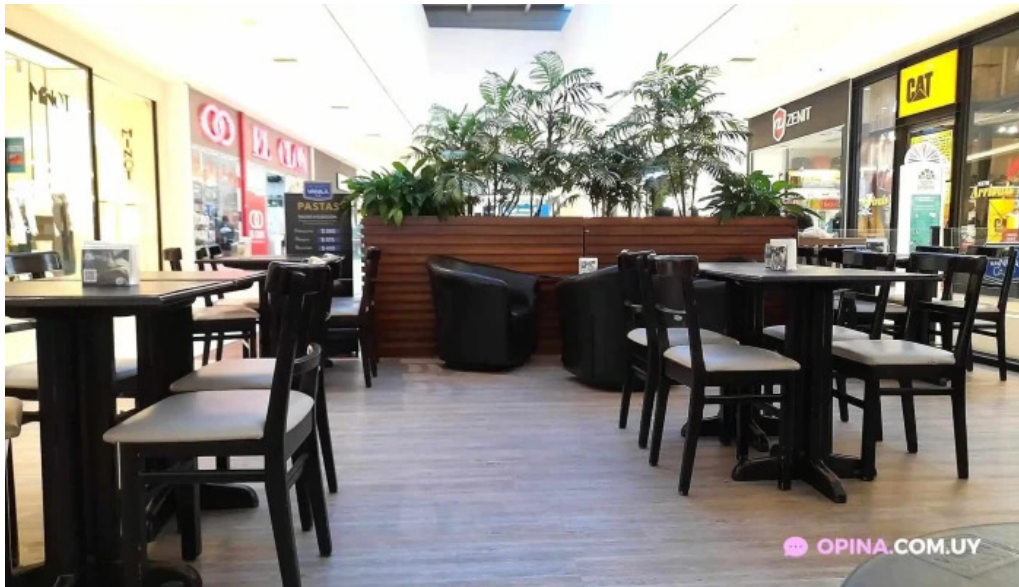
Porto vanila caffe todo