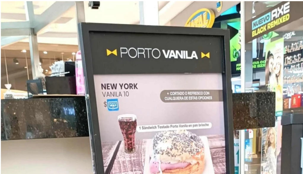
Porto vanilla cafe comentario 3