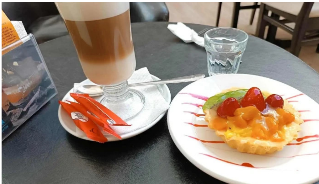
Porto vanilla cafe comidas y bebidas