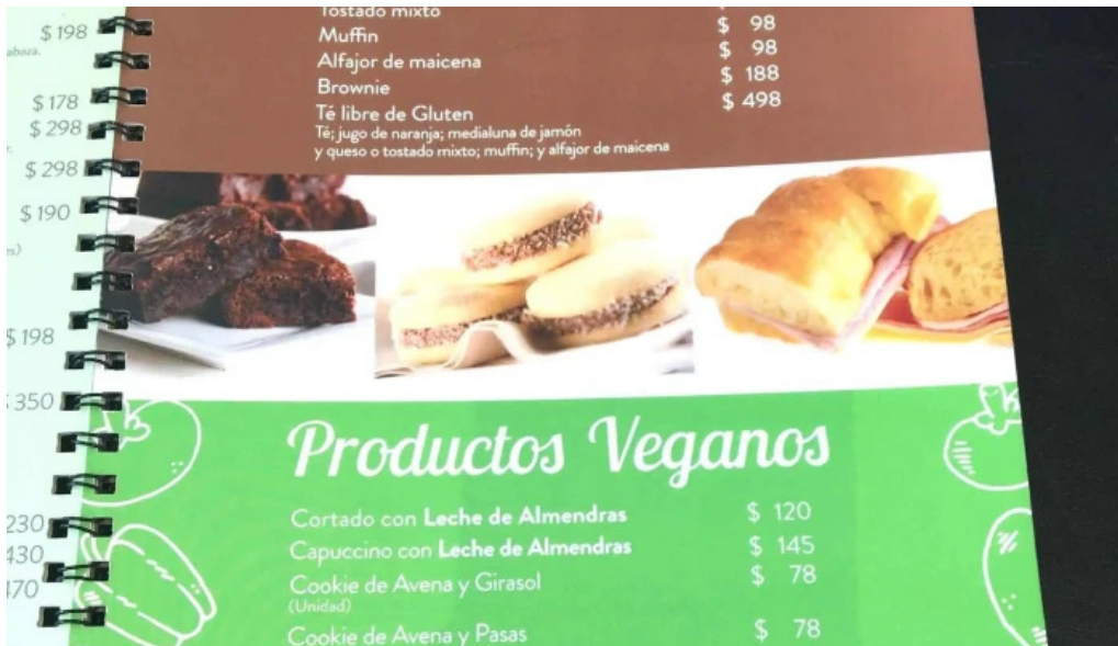
Porto vanilla caffe comentario 5