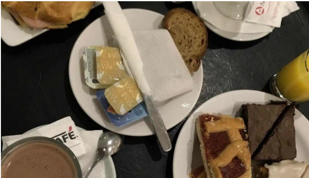
Porto vanilla coffe recientes