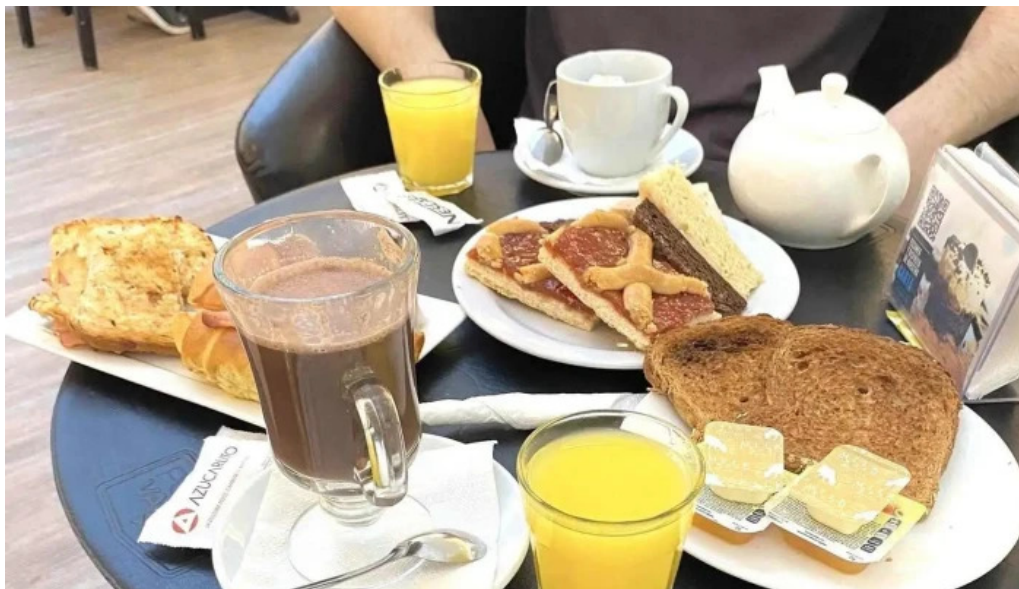
Porto vanilla cafe cafe