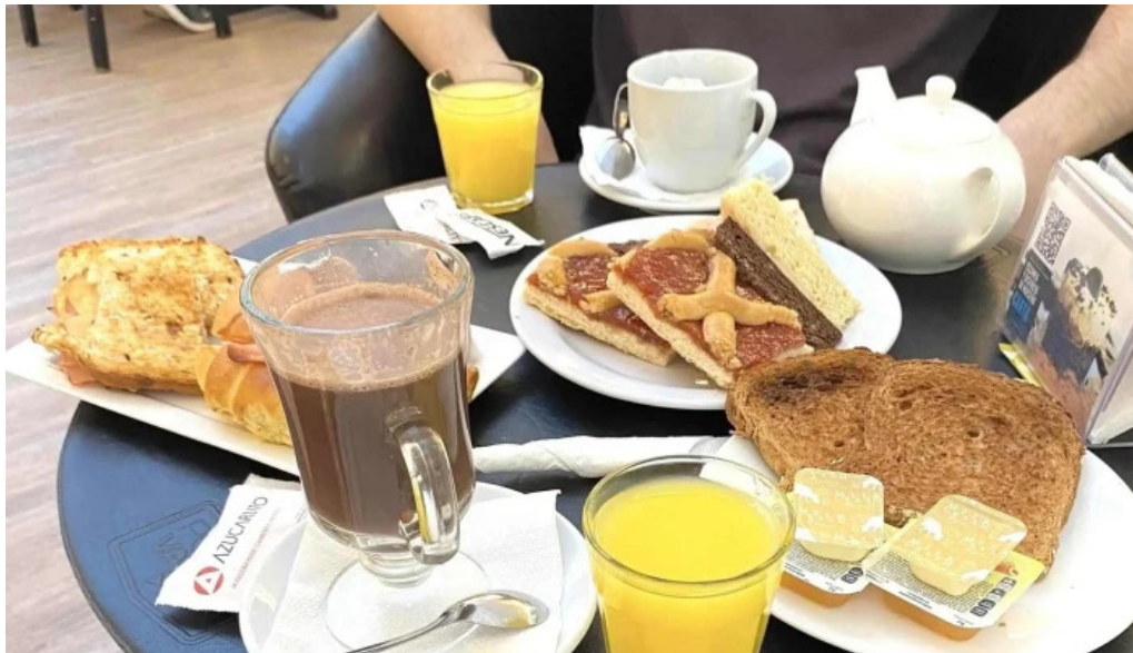
Porto vanilla cafe comentario 7