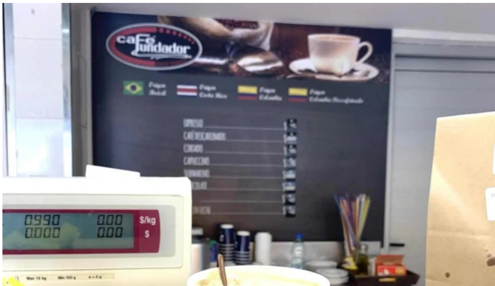
Listo para comer lagomar comentario 5