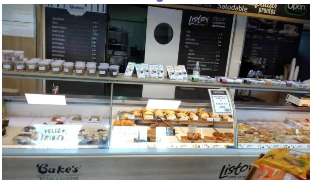
Listo para comer lagomar todo