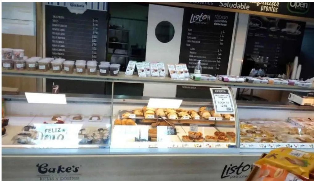
Listo para comer lagomar ciudad de la costa