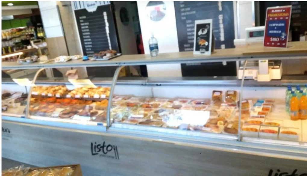
Listo para comer lagomar ambiente