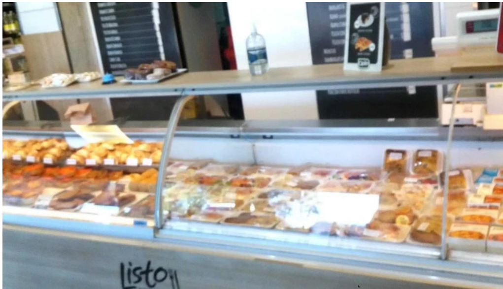
Listo para comer lagomar comentario 6