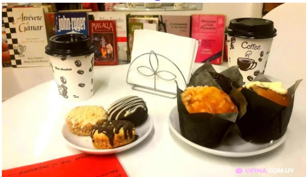
Cafe con encanto andrea y leonel todo