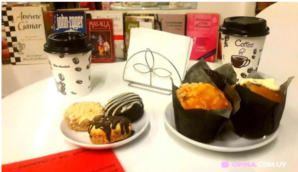
Cafe con encanto andrea y leonel canelones