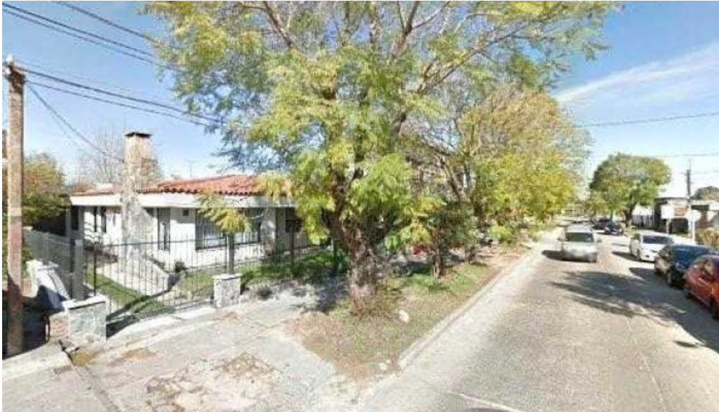
Cafe con encanto andrea y leonel street view y 360