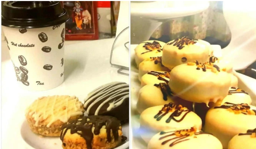
Cafe con encanto andrea y leonel comidas y bebidas