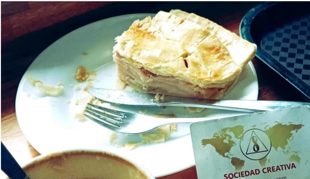
Cafelicidad comentario 1