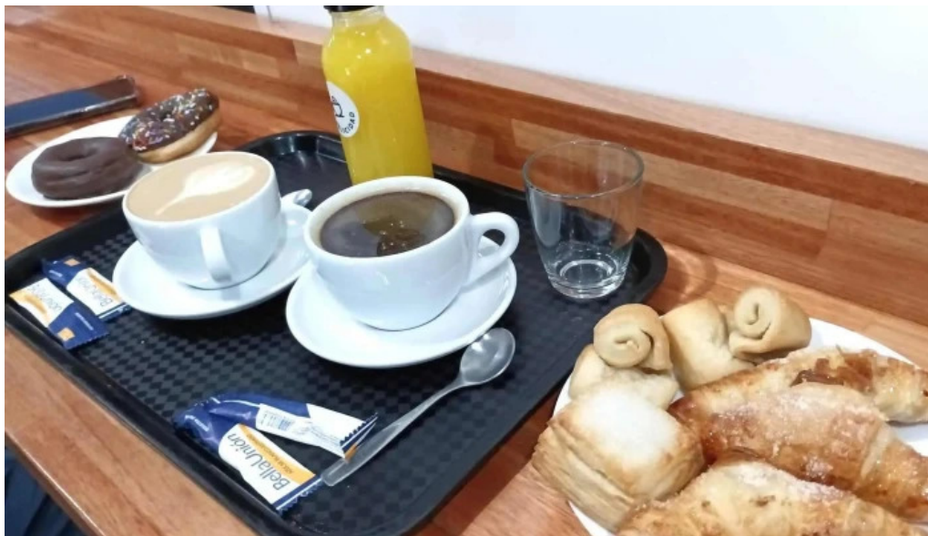
Cafelicidad comidas y bebidas