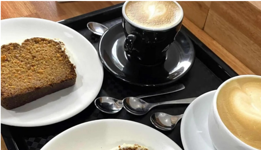
Cafelicidad comentario 2