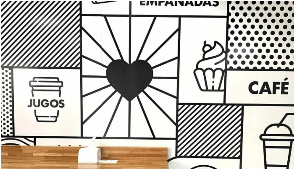
Cafelicidad comentario 5