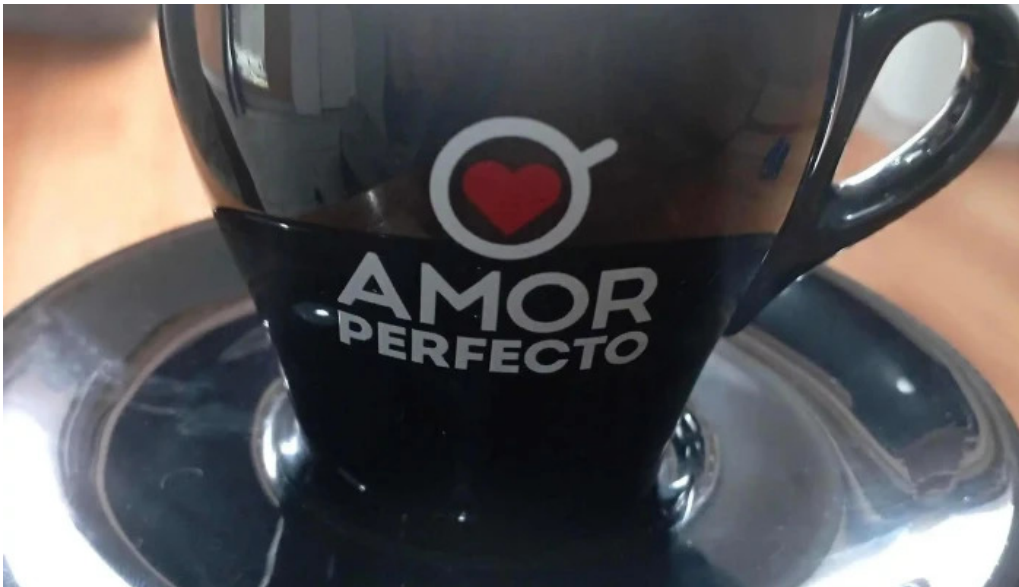
Cafelicidad comentario 7