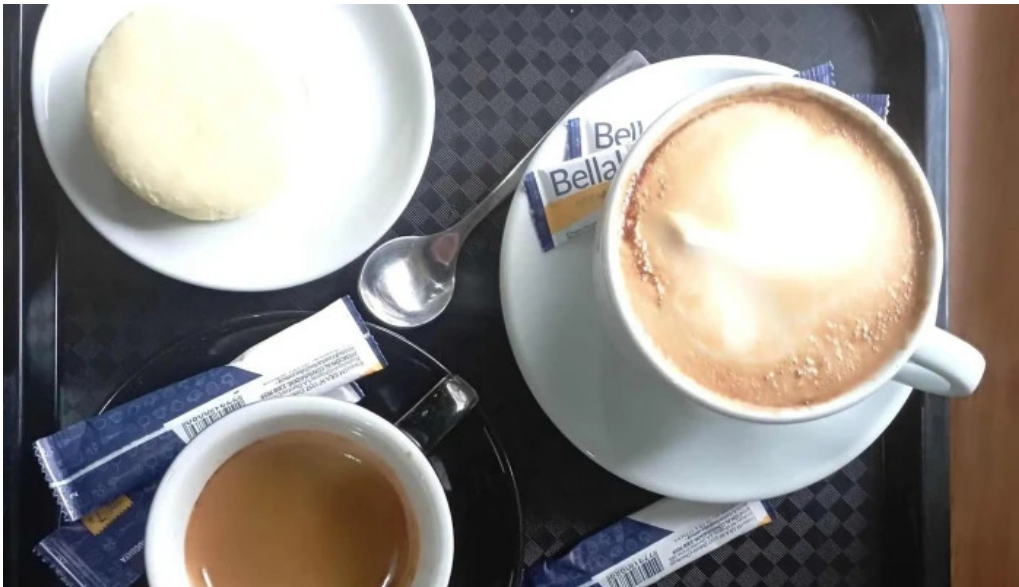
Cafelicidad comentario 8