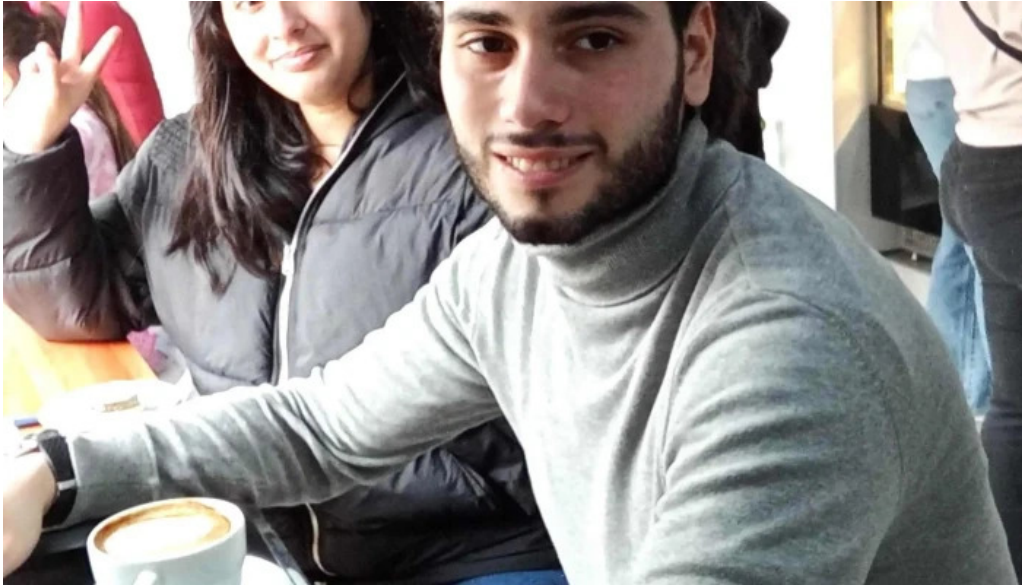
Cafelicidad comentario 6