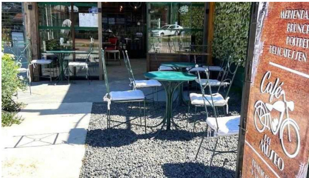
Cafe del museo el pinar ciudad de la costa