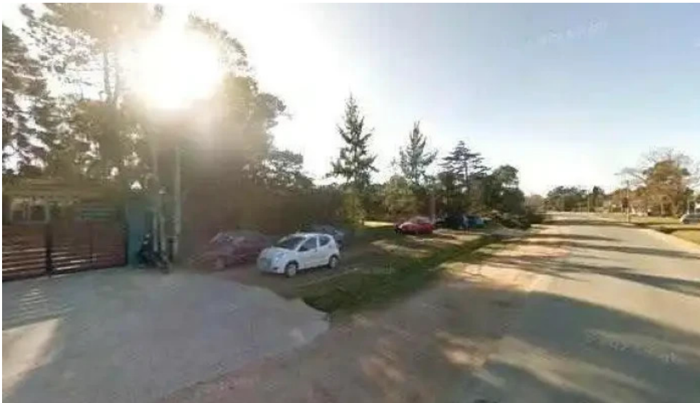
Cafe del museo el pinar street view y 360