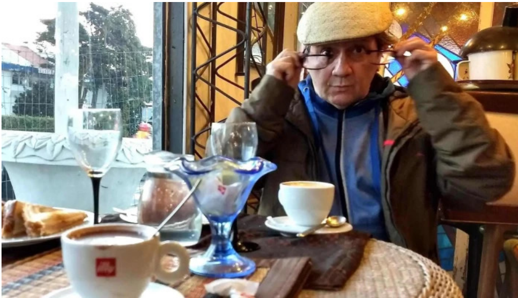
Cafe a la antigua comentario 5