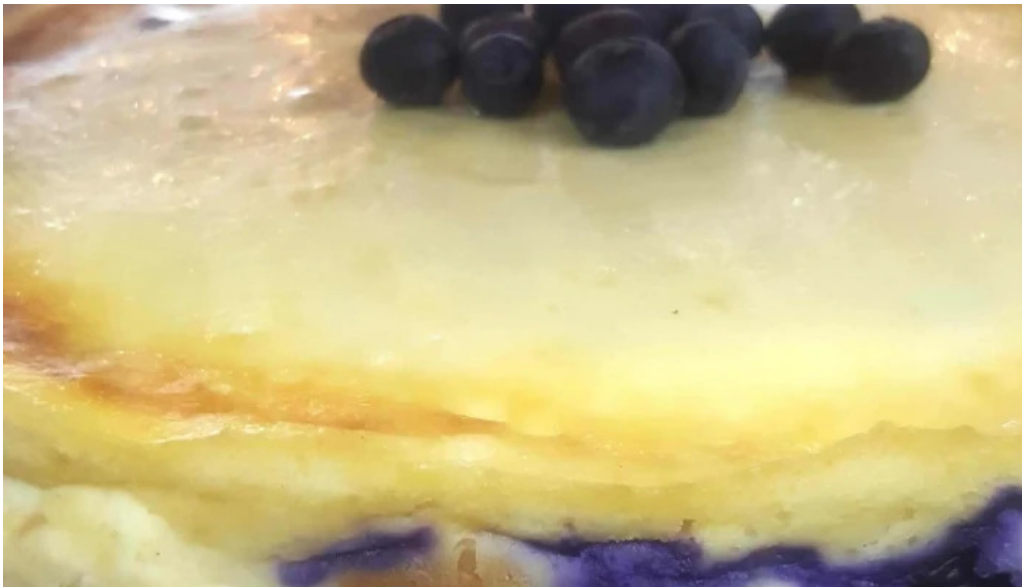
Cafe a la antigua comentario 4