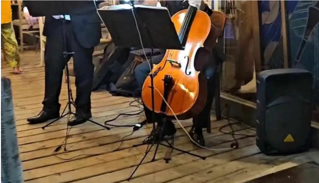
Cafe a la antigua videos