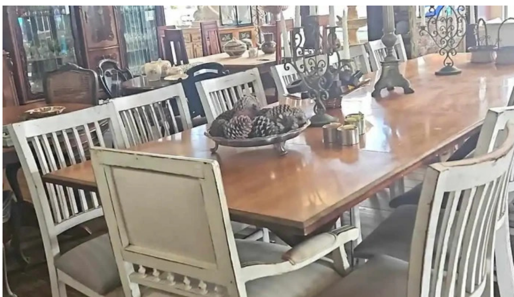
Cafe a la antigua ambiente