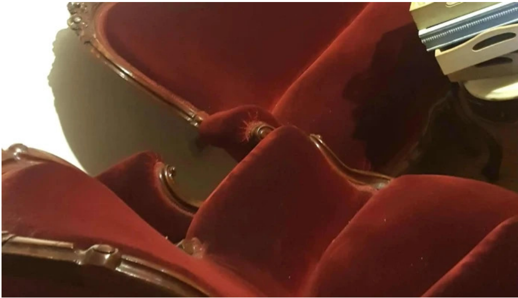
Cafe a la antigua comentario 2