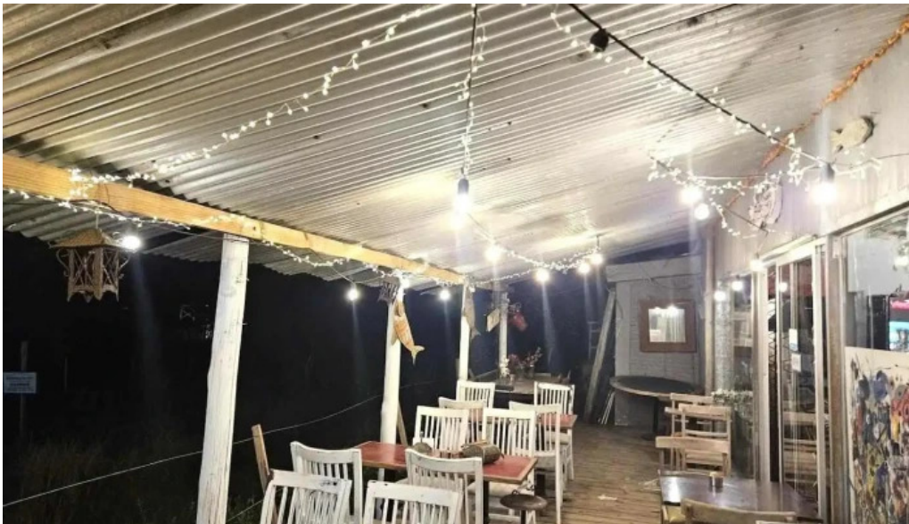
Cafe a la antigua la barra