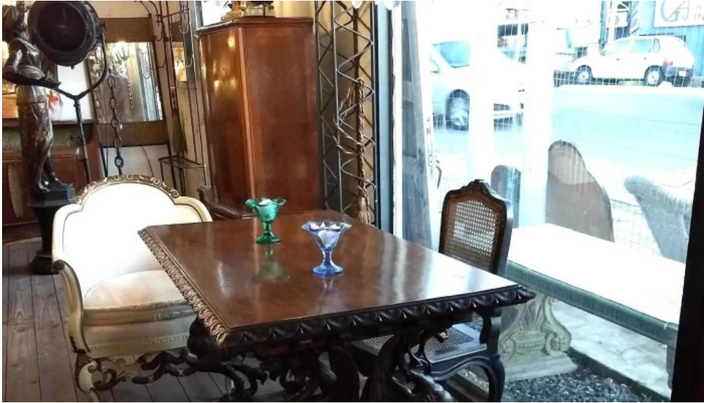
Cafe a la antigua comentario 6