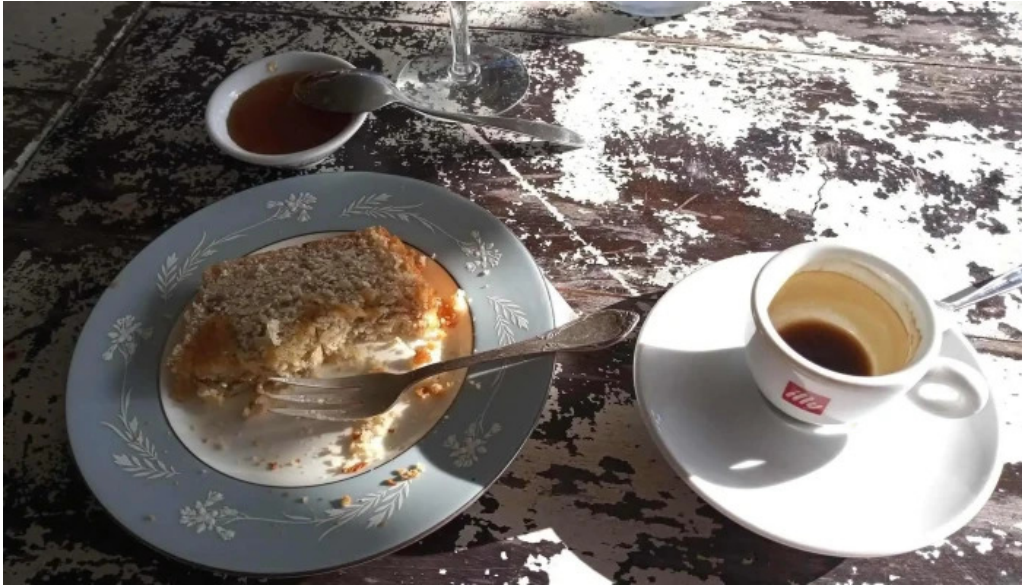
Cafe a la antigua comidas y bebidas