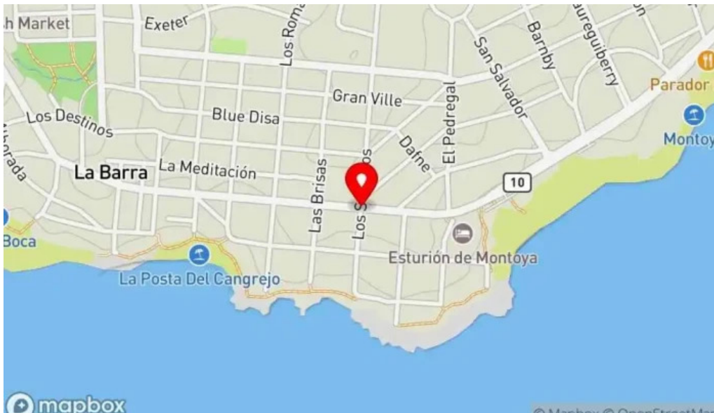
Cafe a la antigua mapa