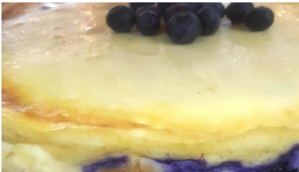
Cafe a la antigua comentario 10