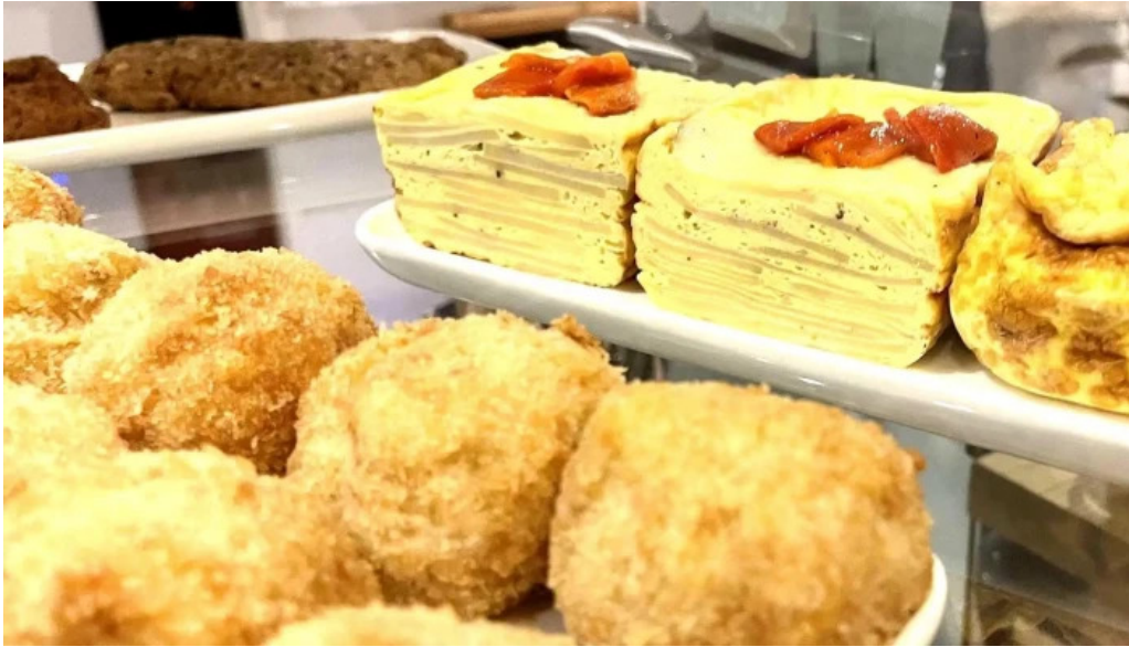
Atipico comentario 2