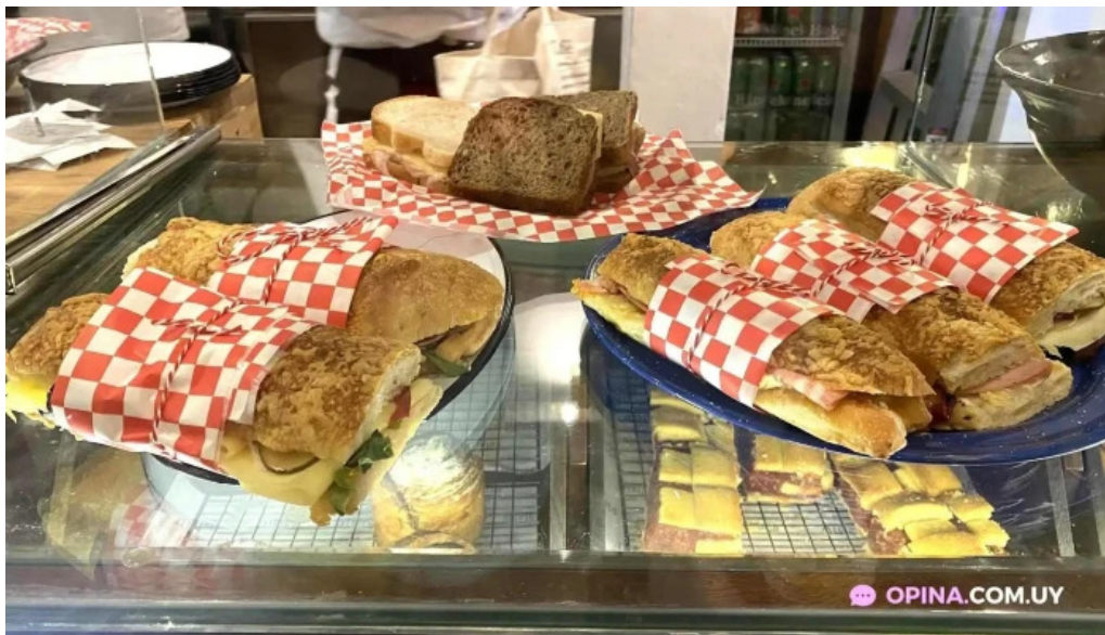
Atipico comidas y bebidas