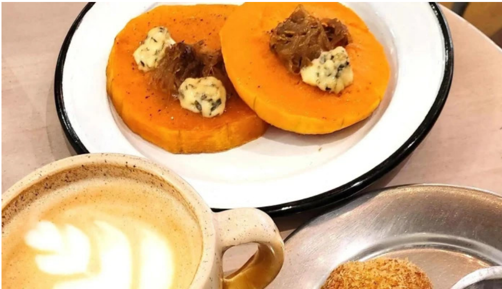
Atipico comentario 5