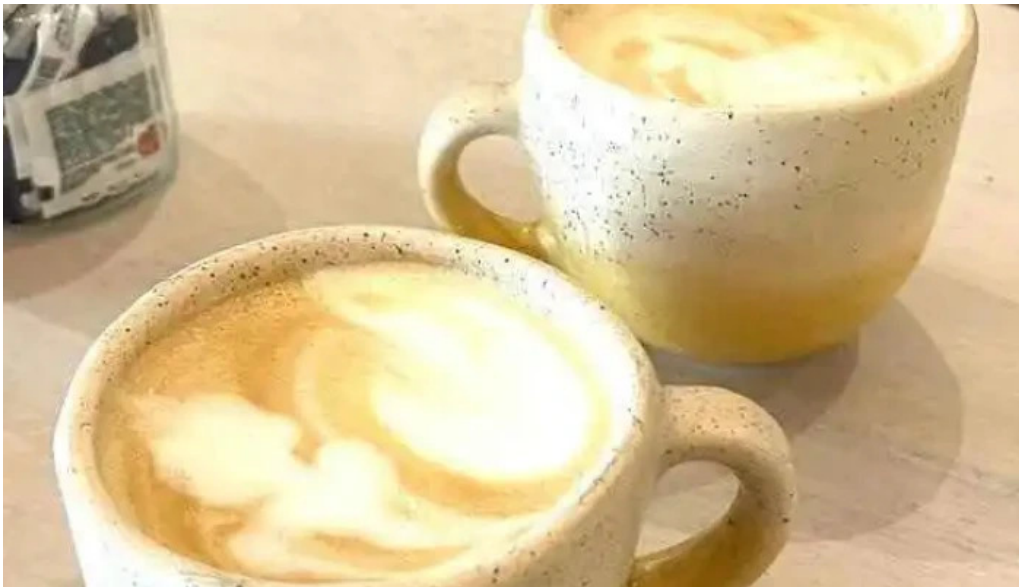
Atipico cafe latte