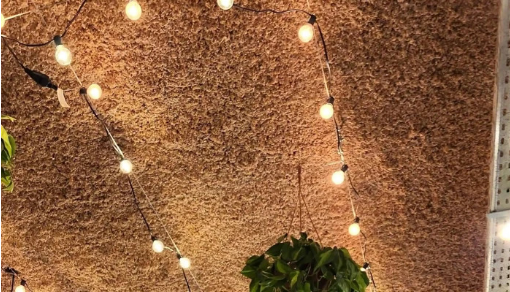
Atipico comentario 6