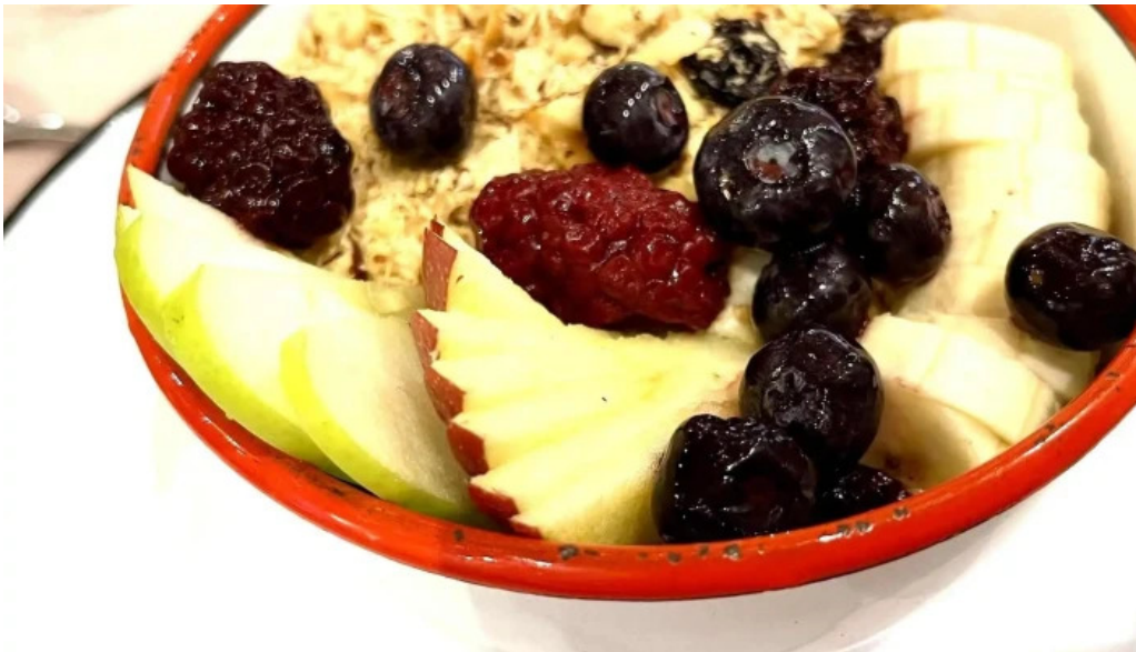
Atipico comentario 1