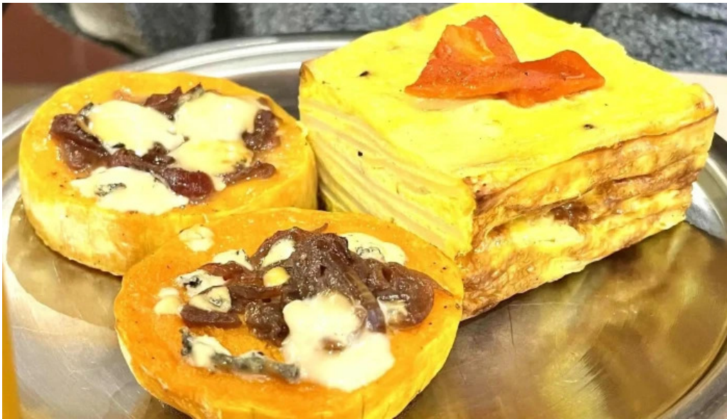
Atipico comentario 3