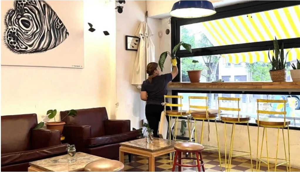
Atipico comentario 4