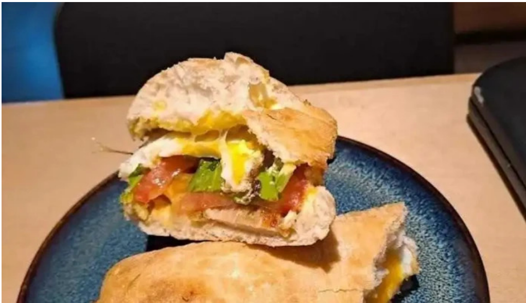
Antojeria cafe ciabatta