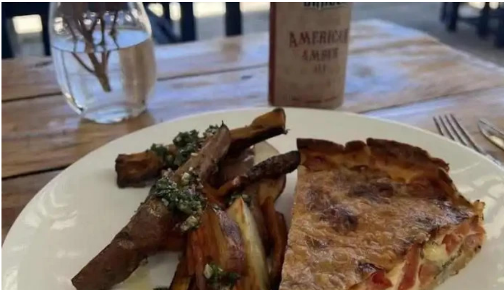
Antojeria cafe del propietario