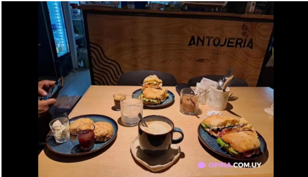
Antojeria cafe cafe