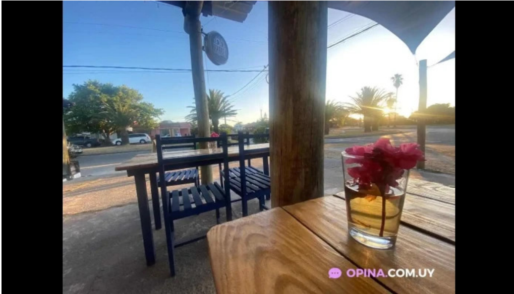
Antojeria cafe la paloma