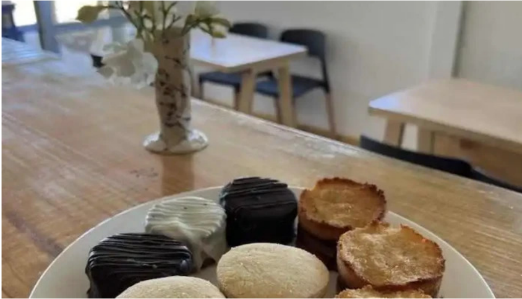
Antojeria cafe comida y bebida