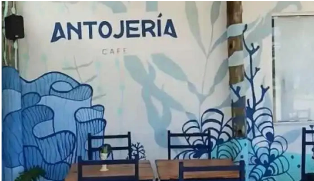
Antojeria cafe videos