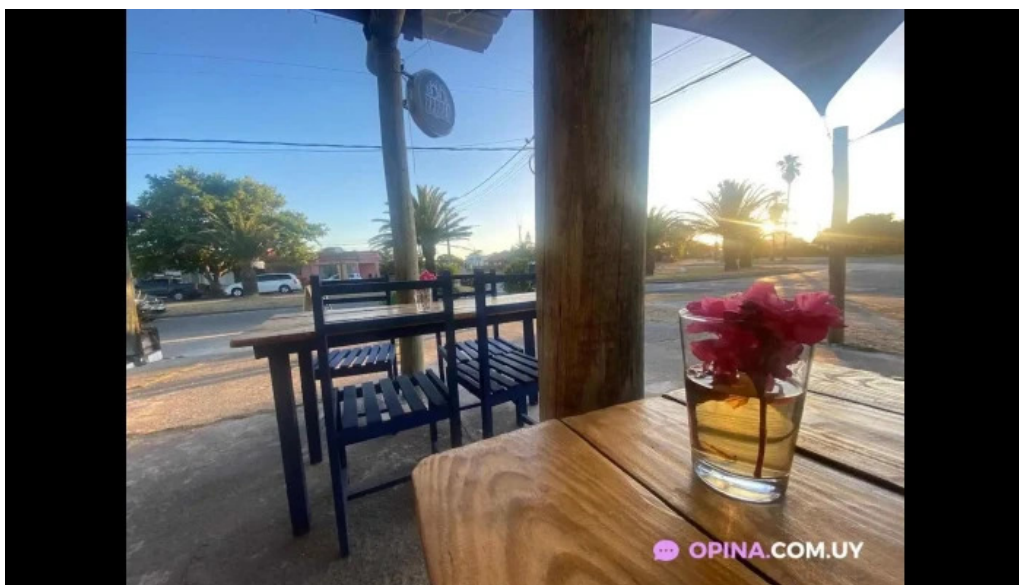
Antojeria cafe todas