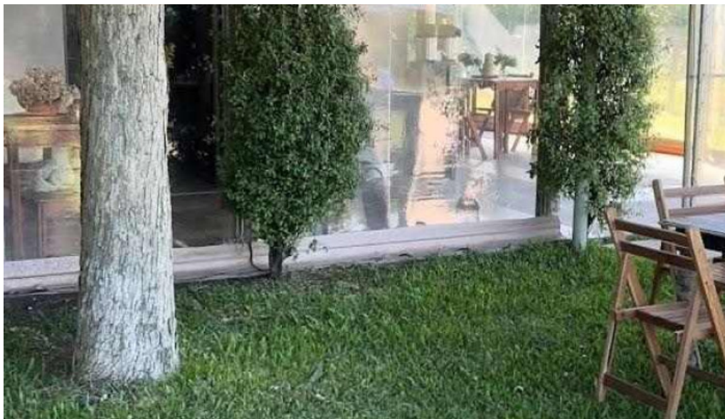
Alma de gloria casa de te mas recientes