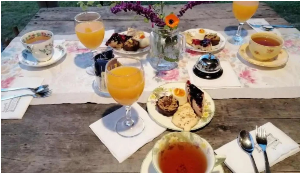
Alma de gloria casa de te comida y bebida