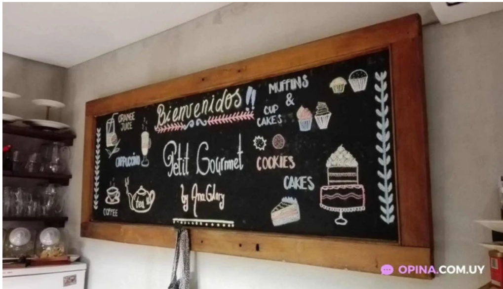
Alma de gloria casa de te menu