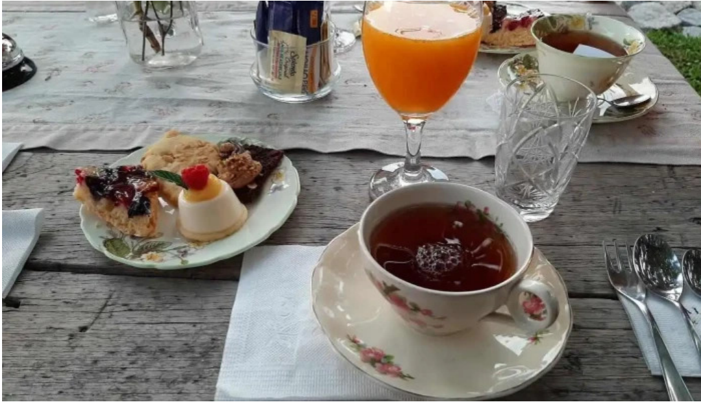
Alma de gloria casa de te jugo