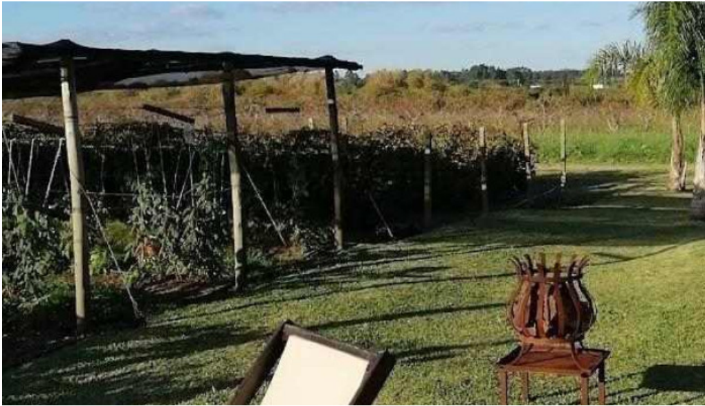
Alma de gloria casa de te videos