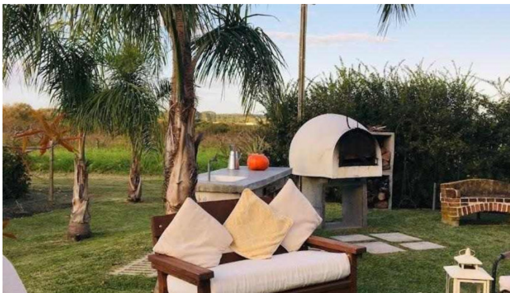
Alma de gloria casa de te ambiente