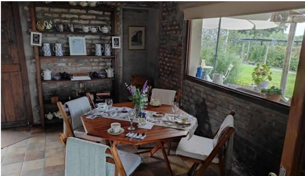
Alma de gloria casa de te las piedras