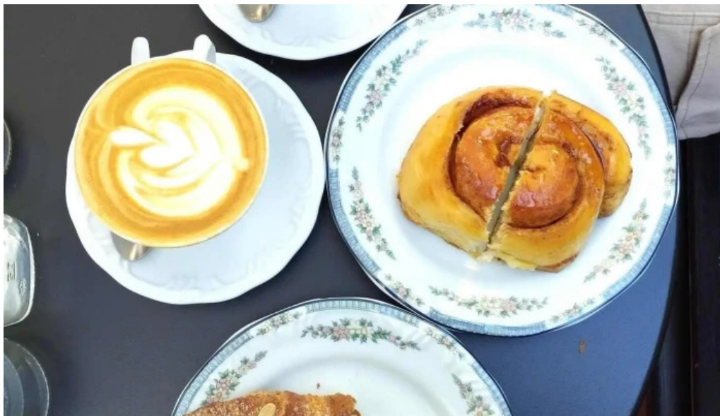
Albertine pan y cafe rollo de canela