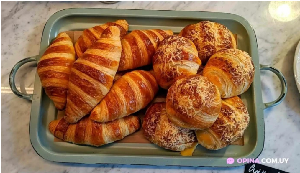
Albertine pan y cafe croissant