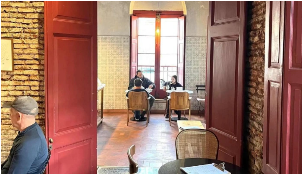
Albertine pan y cafe comentario 1