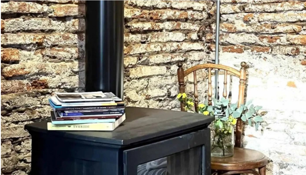
Albertine pan y cafe recientes