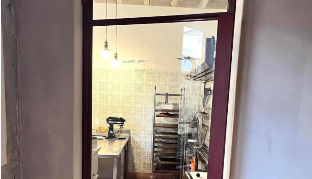
Albertine pan y cafe comentario 2