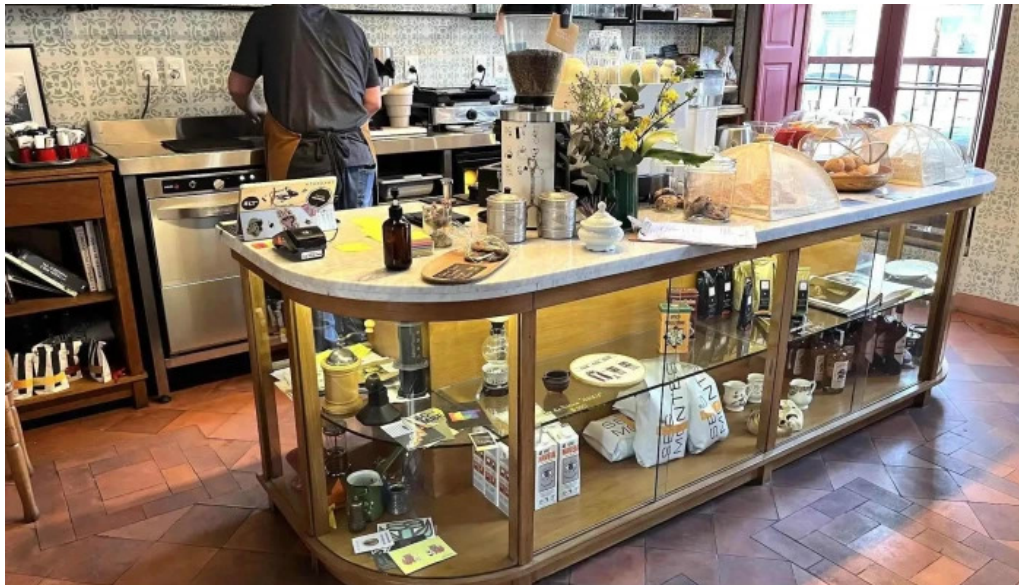
Albertine pan y cafe ambiente