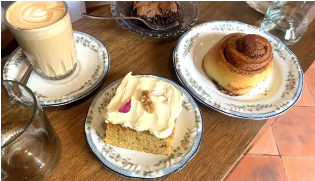
Albertine pan y cafe coffee cake