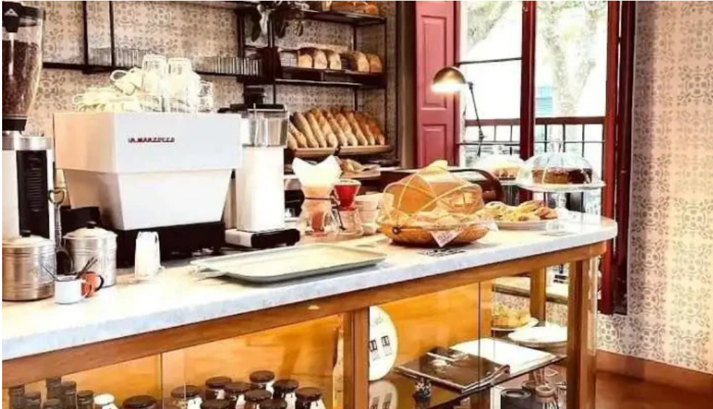
Albertine pan y cafe col del sacramento