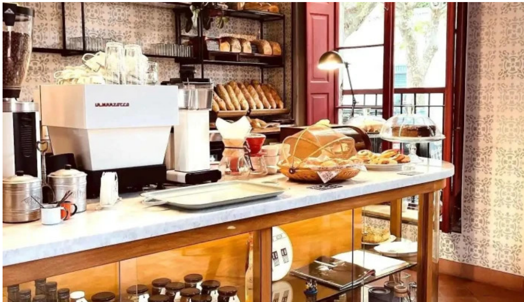
Albertine pan y cafe todo