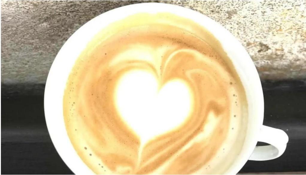
Albertine pan y cafe capuchino