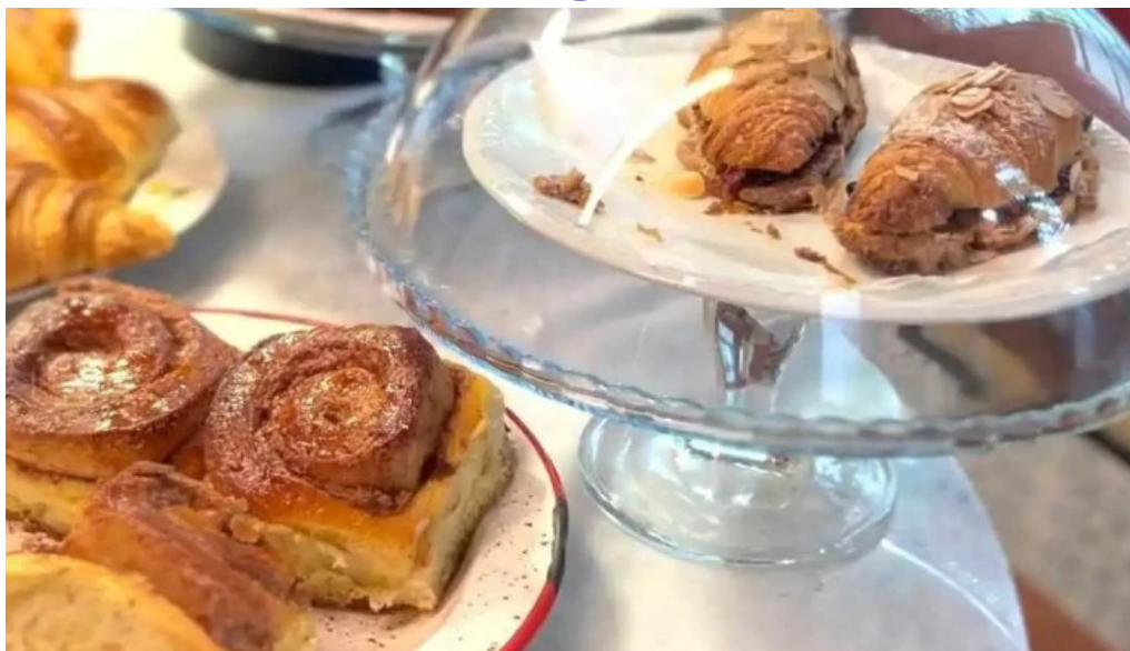
Albertine pan y cafe videos