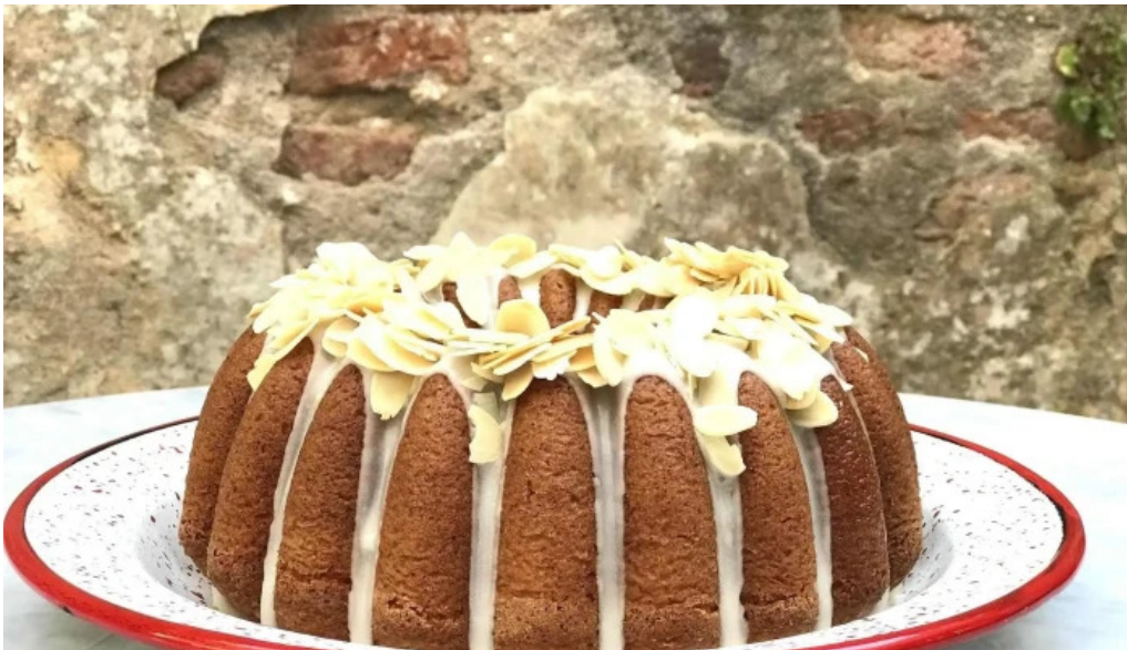
Albertine pan y cafe comidas y bebidas