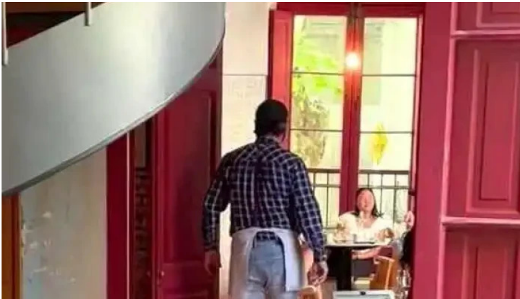
Albertine pan y cafe del propietario