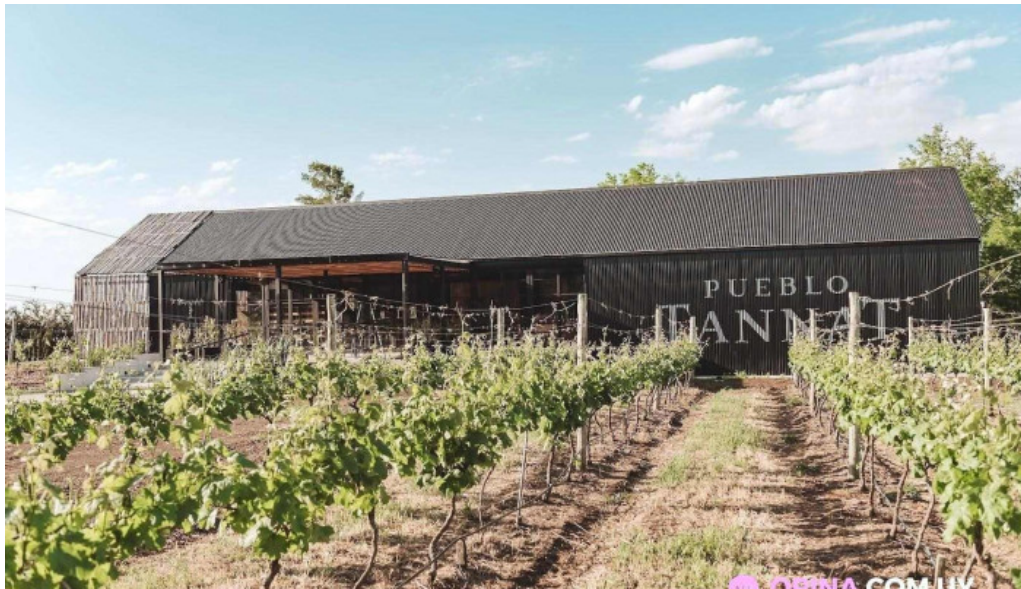
Pueblo tannat del propietario