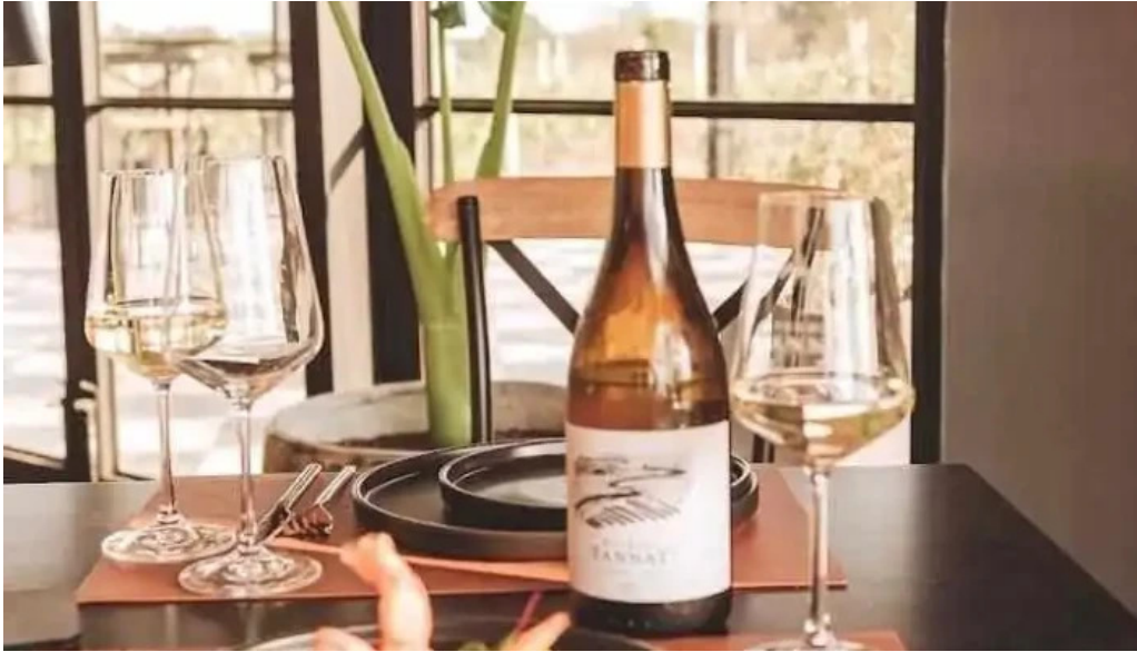
Pueblo tannat mesa