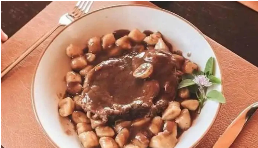
Pueblo tannat vino