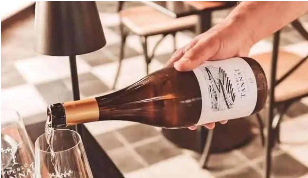
Pueblo tannat todas