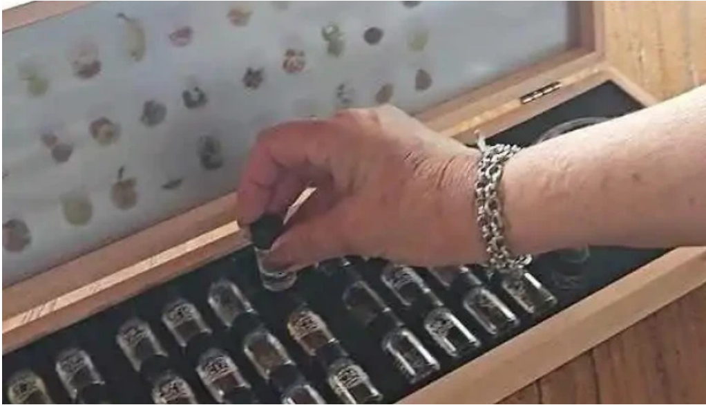
Pueblo tannat videos