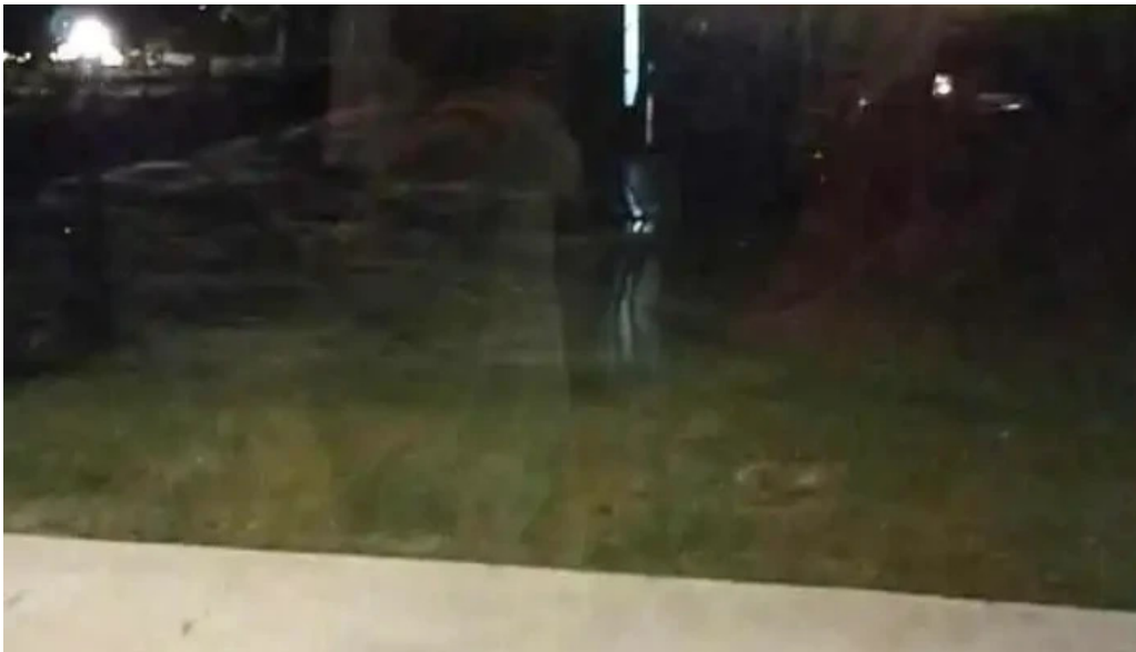
Pueblo tannat mas recientes