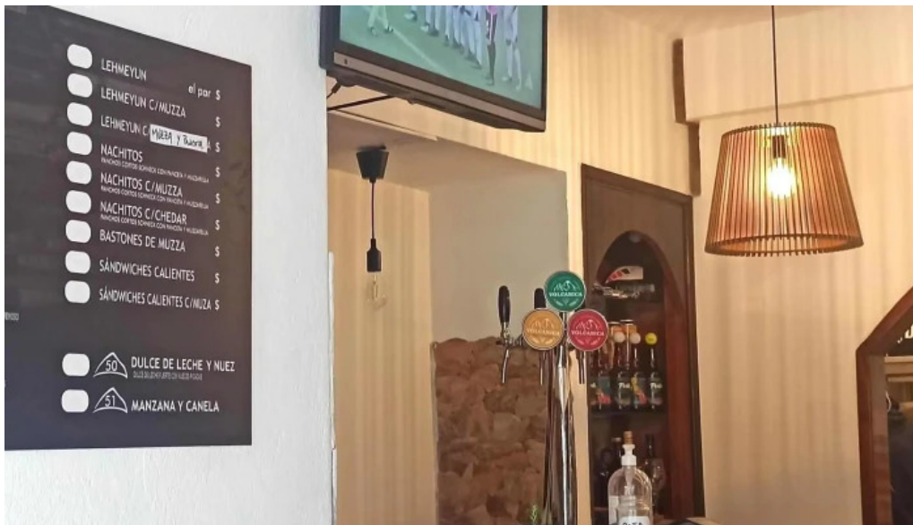
Empanadas don palese comentario 7