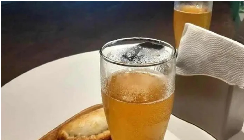
Empanadas don palese piriapolis