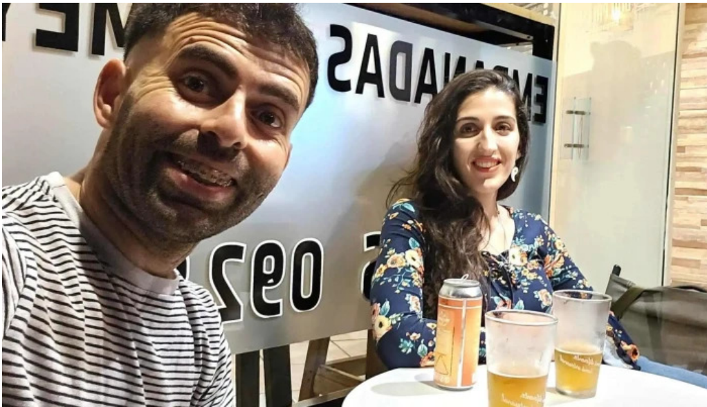
Empanadas don palese comentario 3