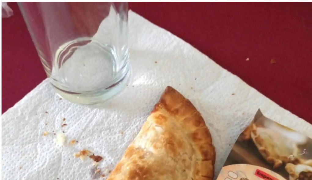
Empanadas don palese comentario 5