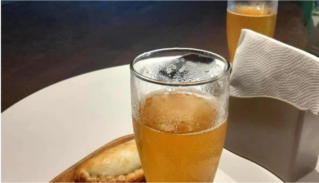
Empanadas don palese todo