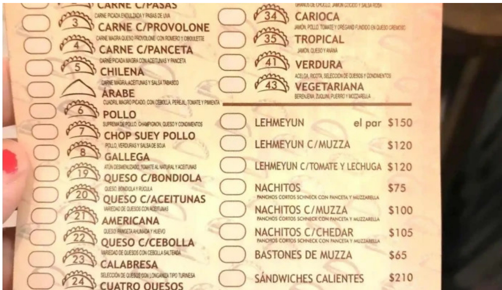
Empanadas don palese menu