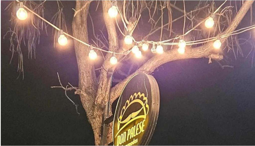
Empanadas don palese comentario 4