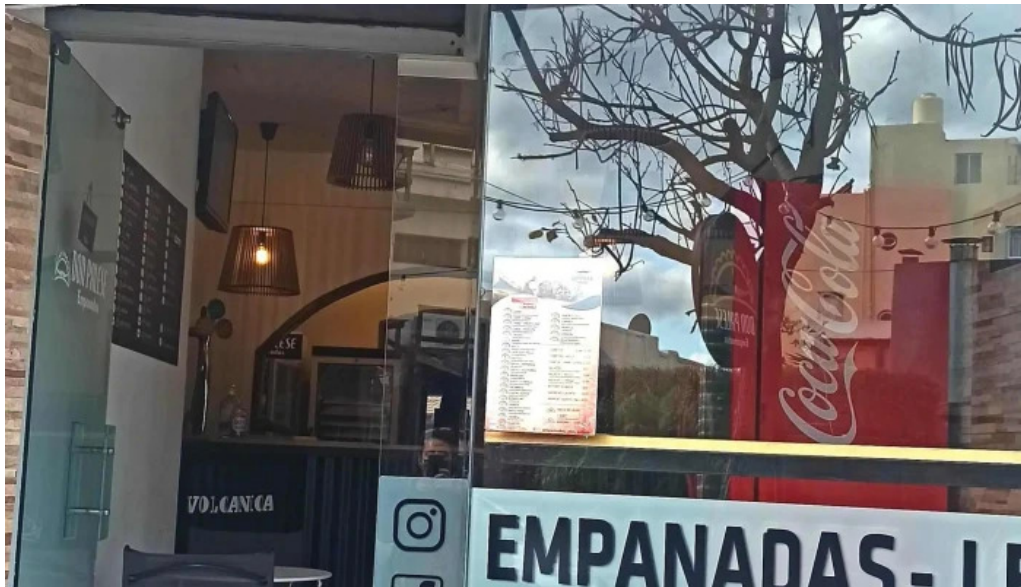
Empanadas don palese comentario 6