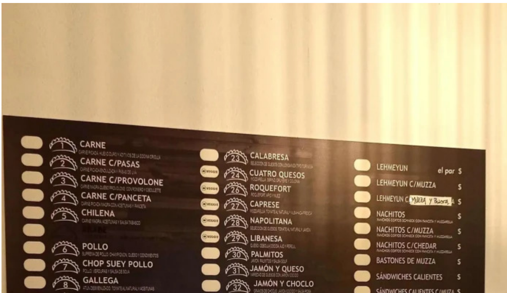
Empanadas don palese comentario 9