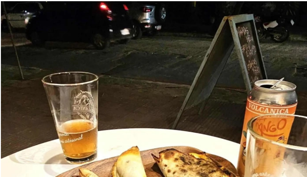
Empanadas don palese comentario 1