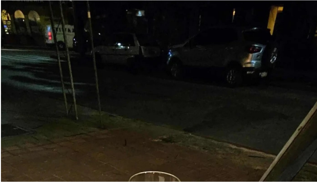
Empanadas don palese comentario 2