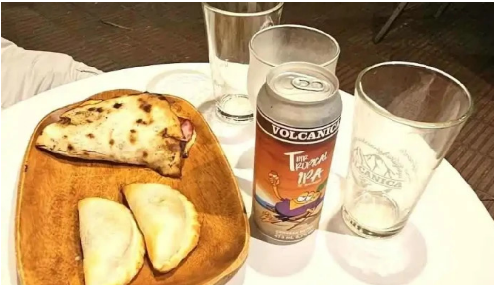
Empanadas don palese comidas y bebidas