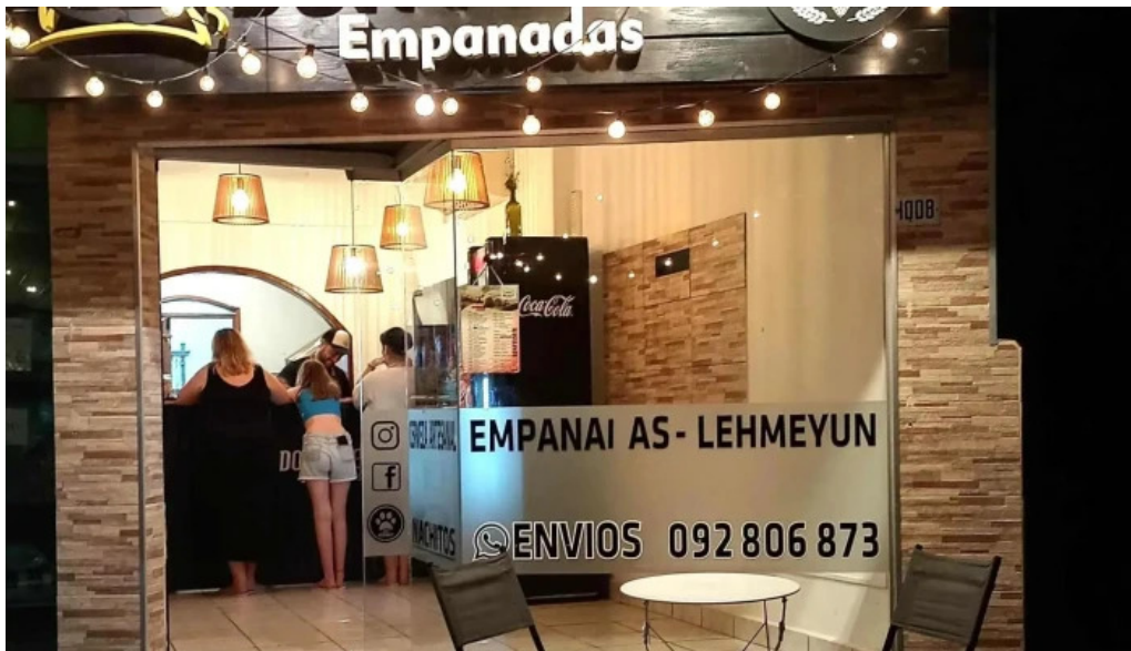
Empanadas don palese comentario 8