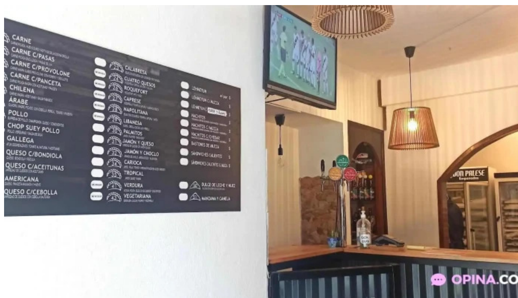
Empanadas don palese ambiente