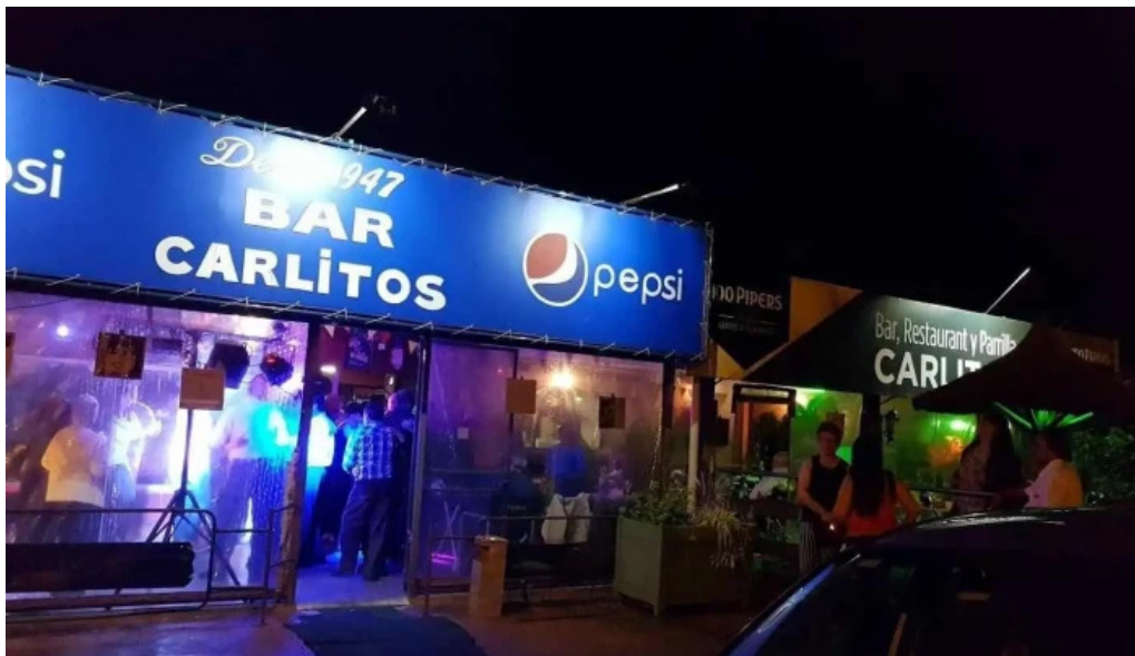
Bar carlitos parque del plata