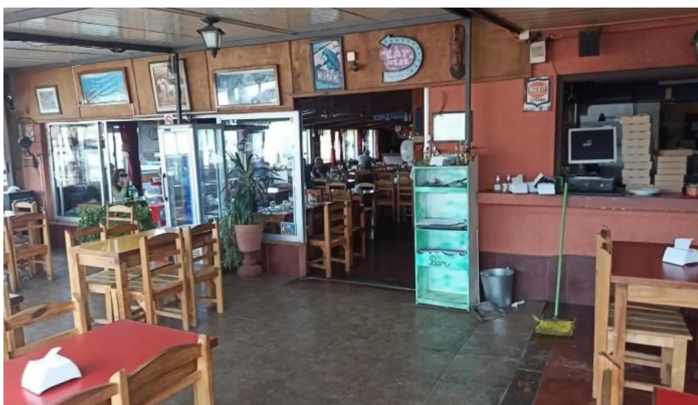
Bar carlitos ambiente