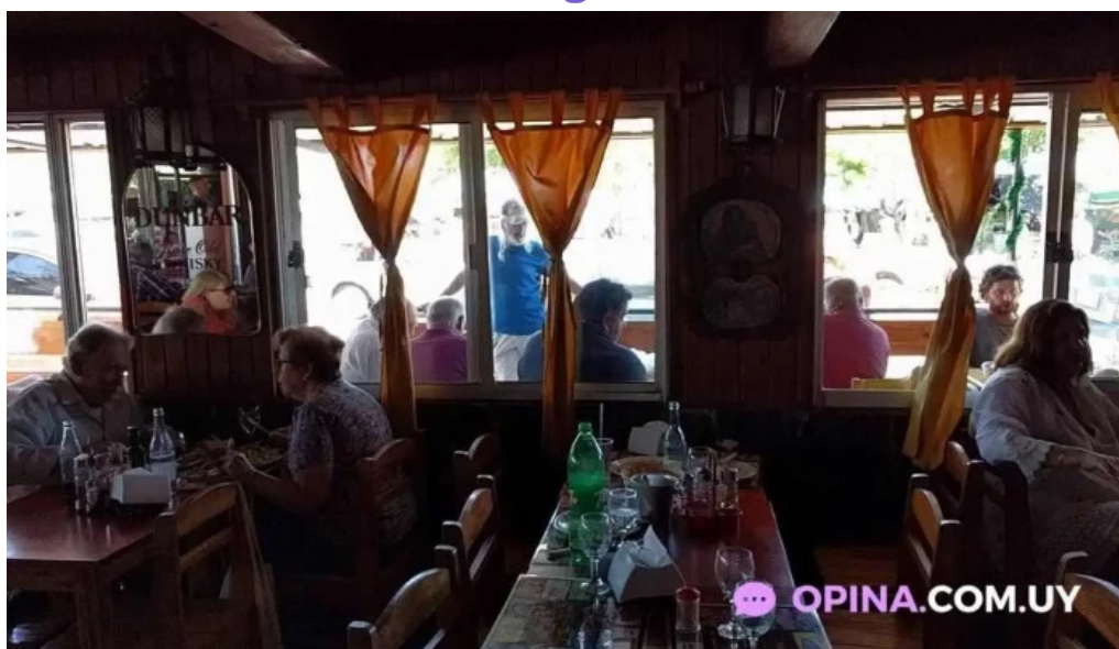
Bar carlitos videos