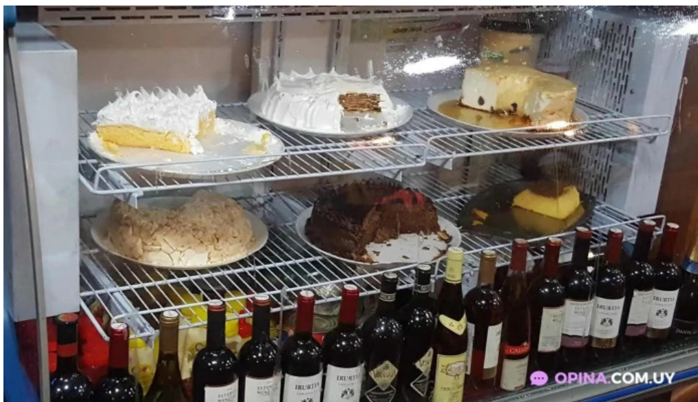
Bar carlitos comida y bebida