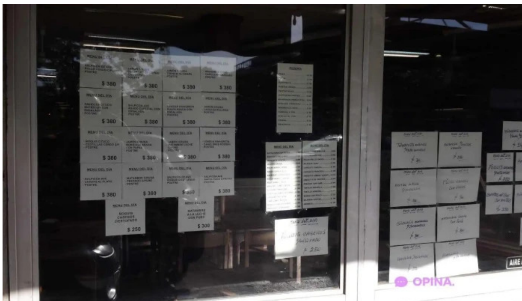
Bar caballero menu