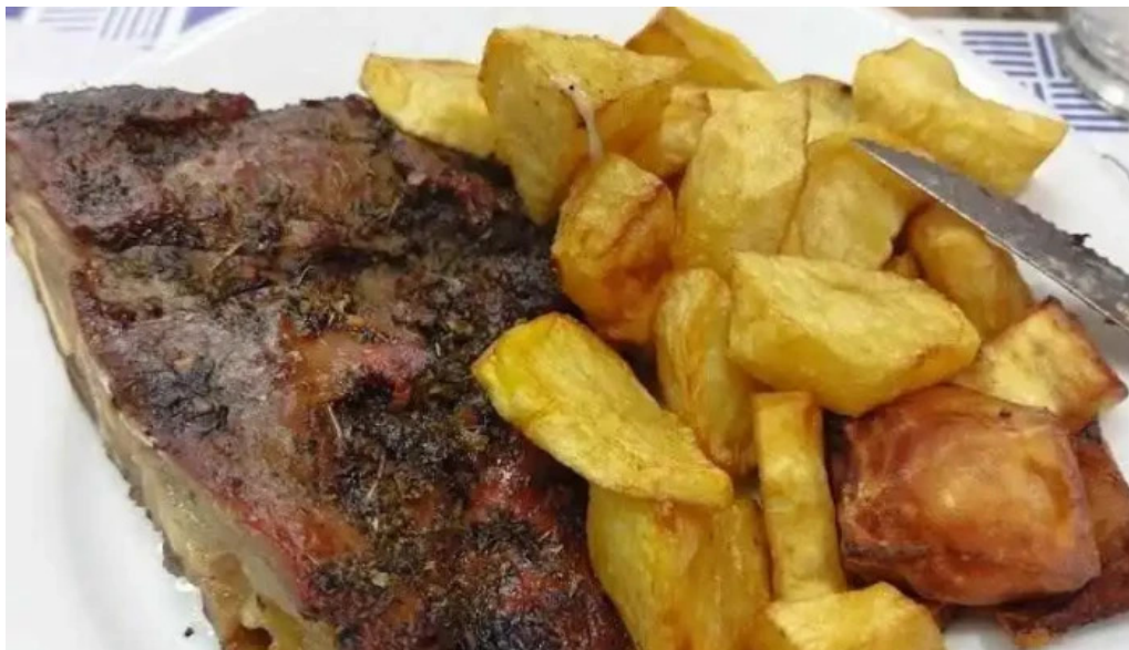
Bar caballero churrasco