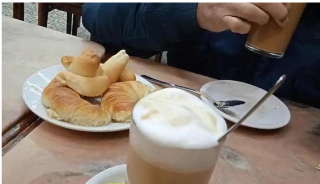
Bar caballero capuchino