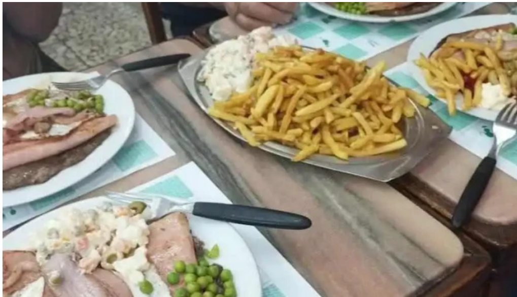
Bar caballero milanesa