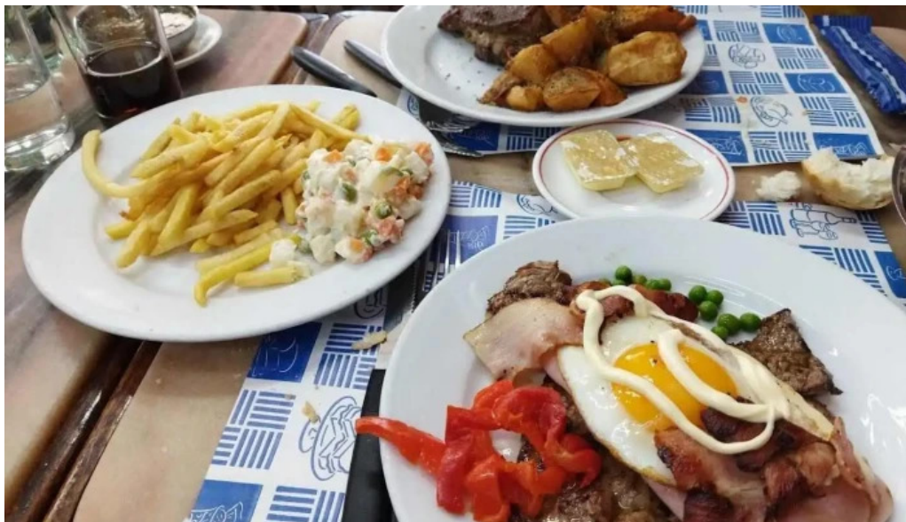
Bar caballero comida y bebida