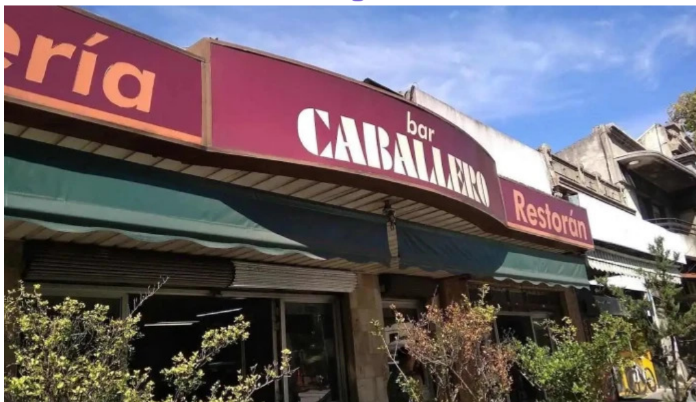
Bar caballero todas