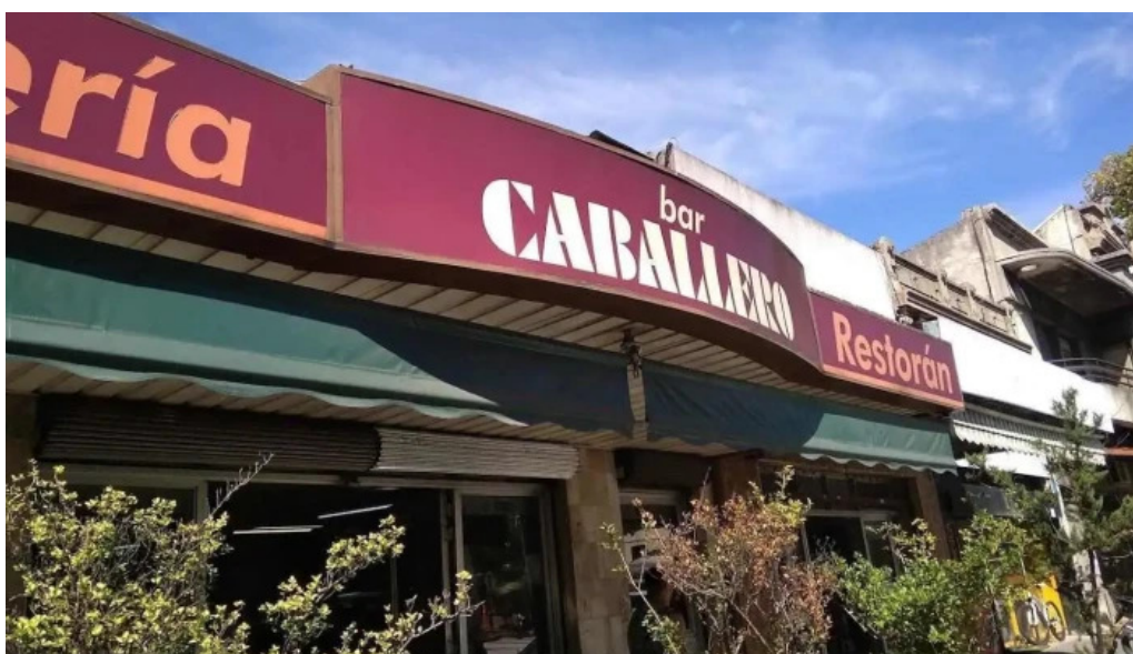
Bar caballero montevideo