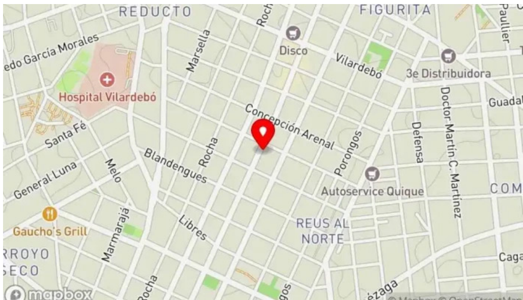
Bar caballero mapa