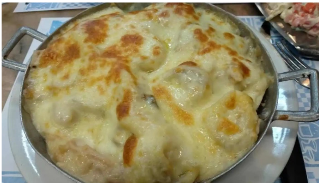
Bar caballero papas fritas