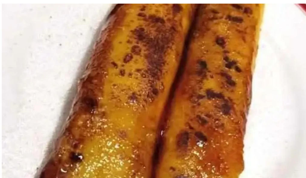
Bar lo de porro mas recientes