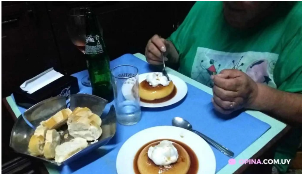
Bar lo de porro flan