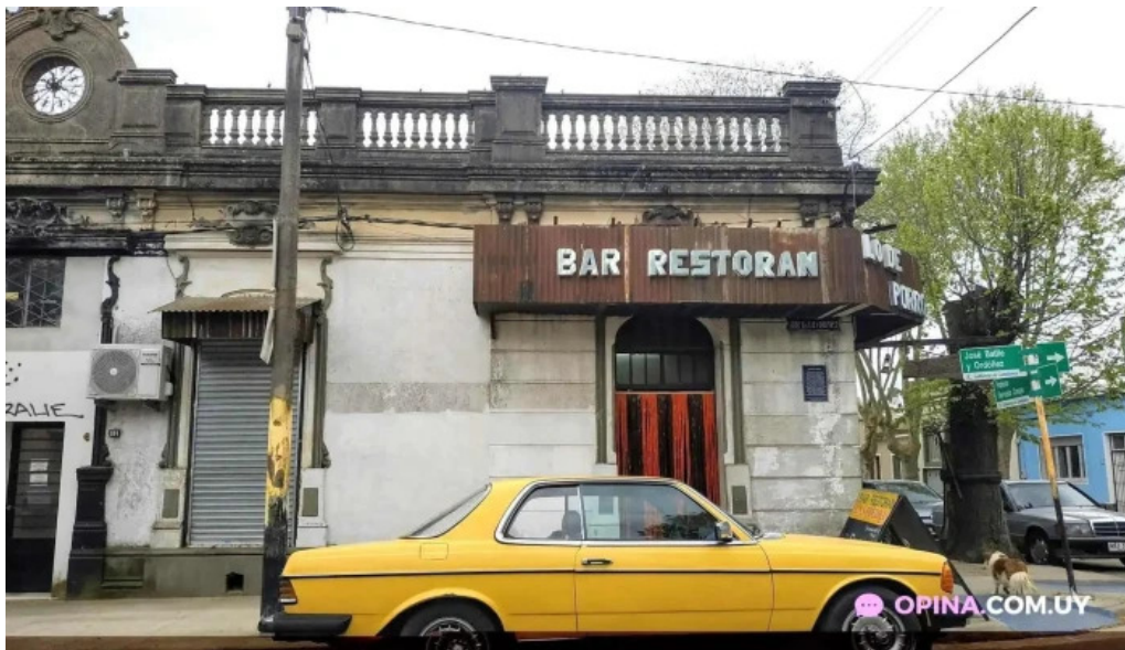
Bar lo de porro las piedras