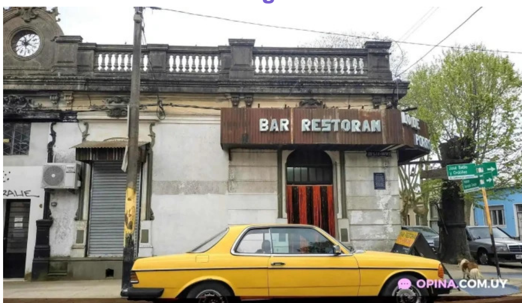
Bar lo de porro todas