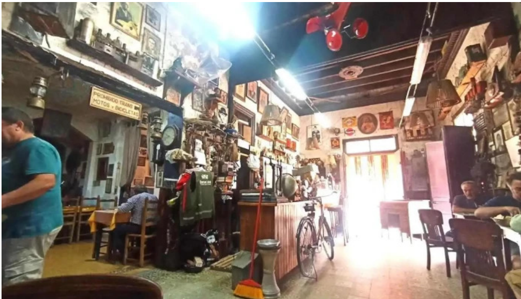
Bar lo de porro ambiente