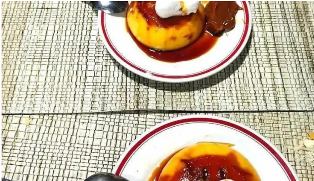
Bar lo de porro comida y bebida