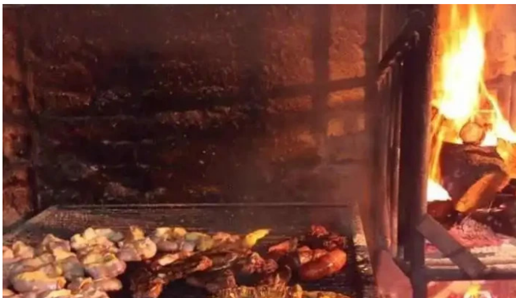
Gandhi resto pub san carlos