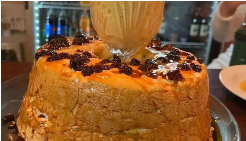
Gandhi resto pub comida y bebida