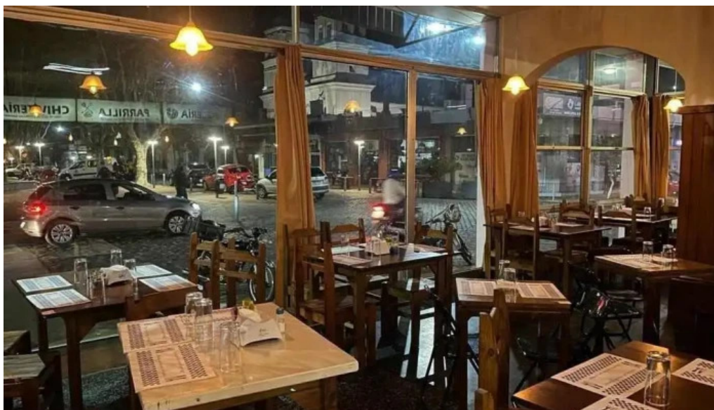
Gandhi resto pub ambiente