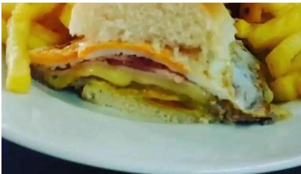
Gandhi resto pub papas fritas