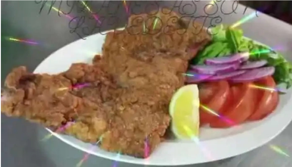
Gandhi resto pub del propietario