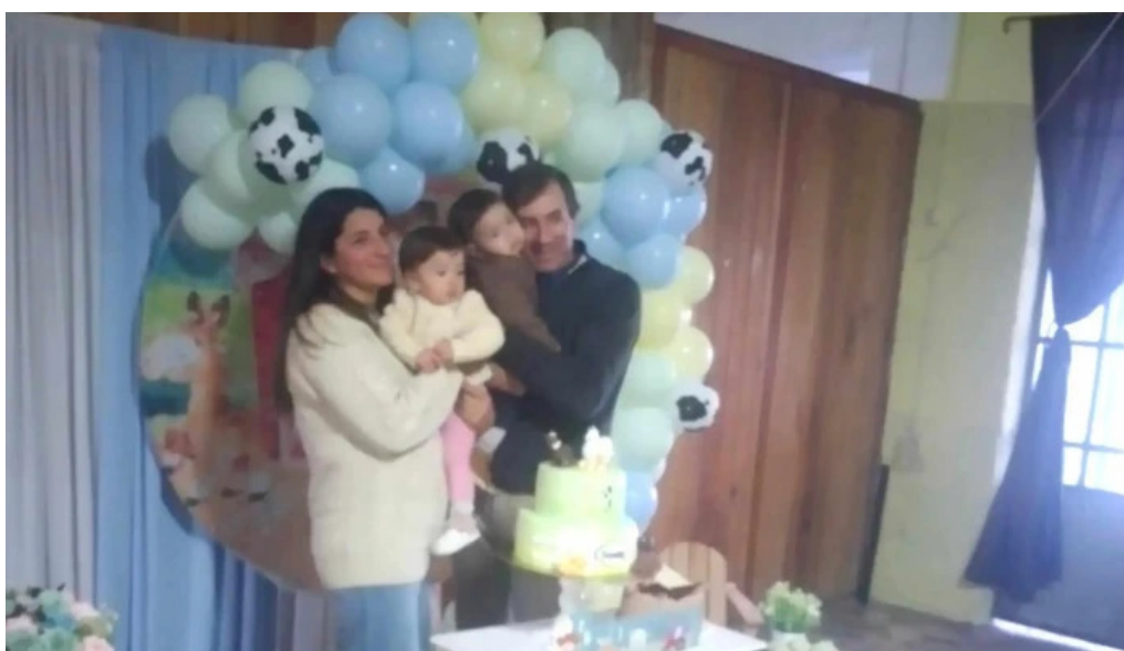
Club social migues comentario 1