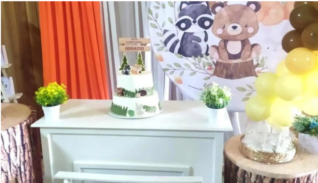
Club social migues todo