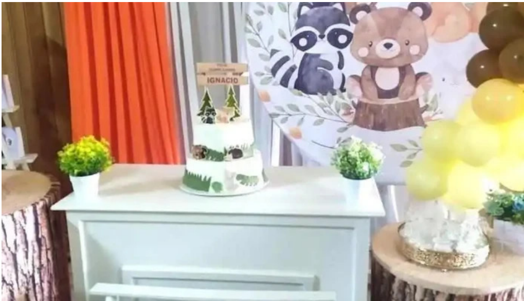
Club social migues migues