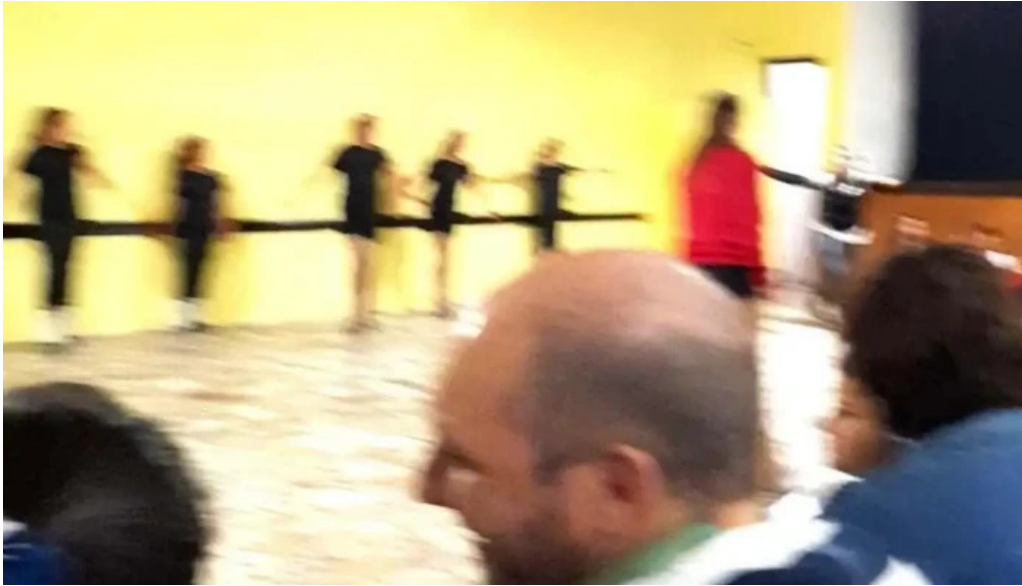
Club social migues videos