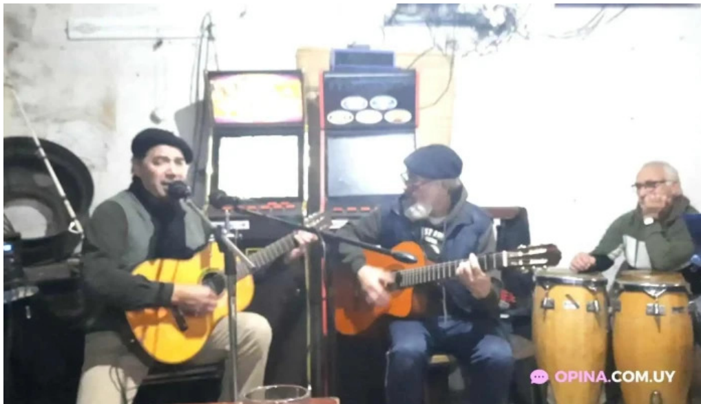
Cantina la lata raul moneo videos