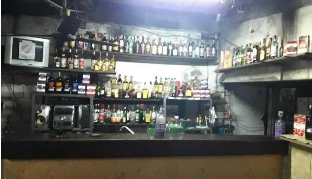
Cantina la lata raul moneo ciudad del plata