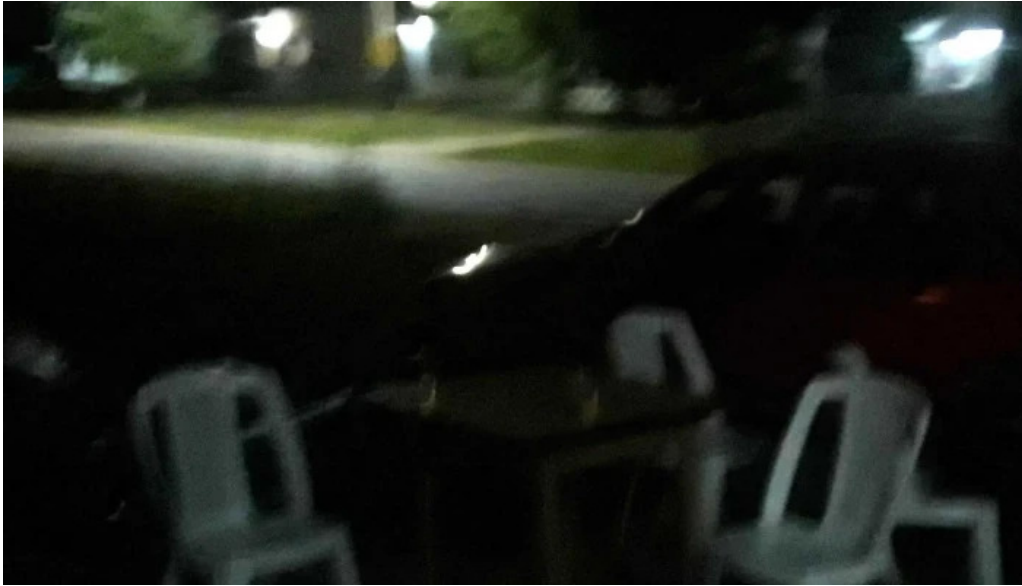
Cantina la lata raul moneo comentario 2