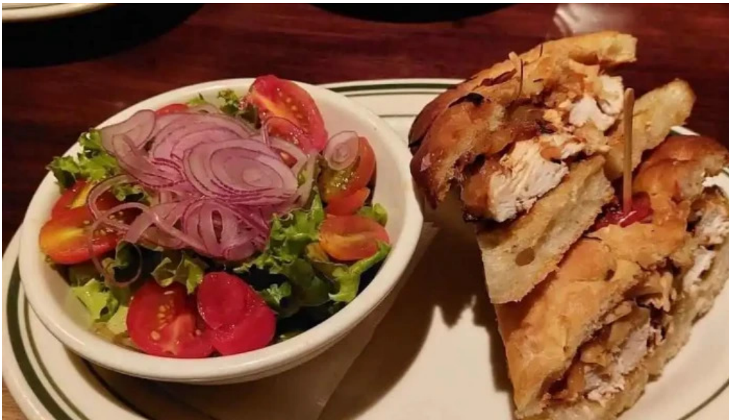
Burlesque comida y bebida