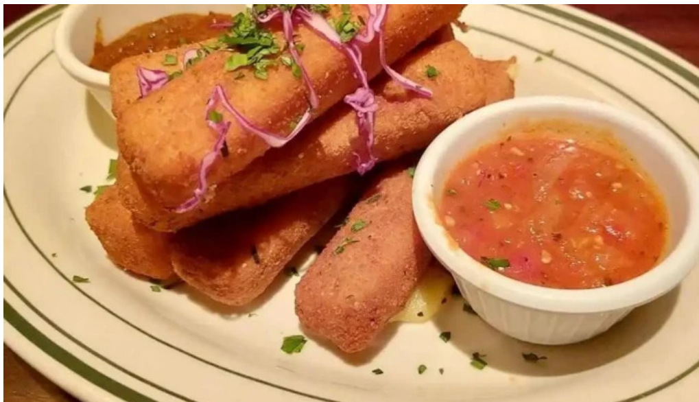
Burlesque palitos de mozzarella