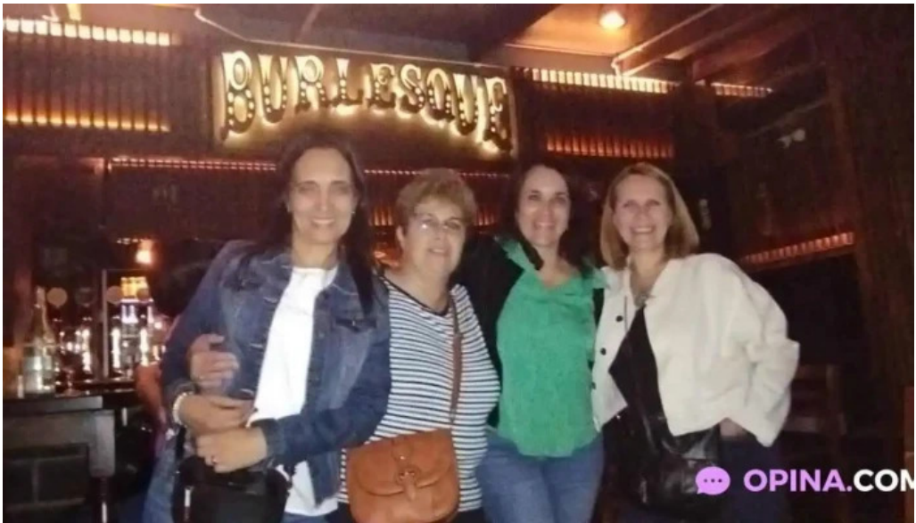
Burlesque mas recientes