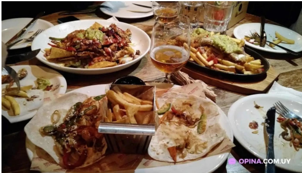
Burlesque papas fritas