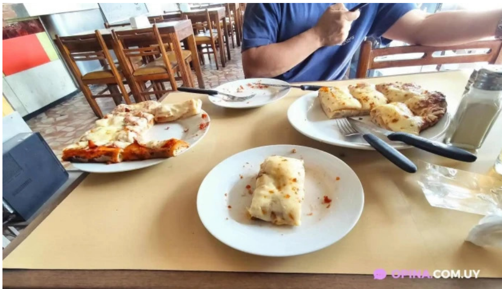
Bar san martin comida y bebida