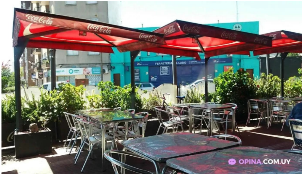
Bar san martin montevideo