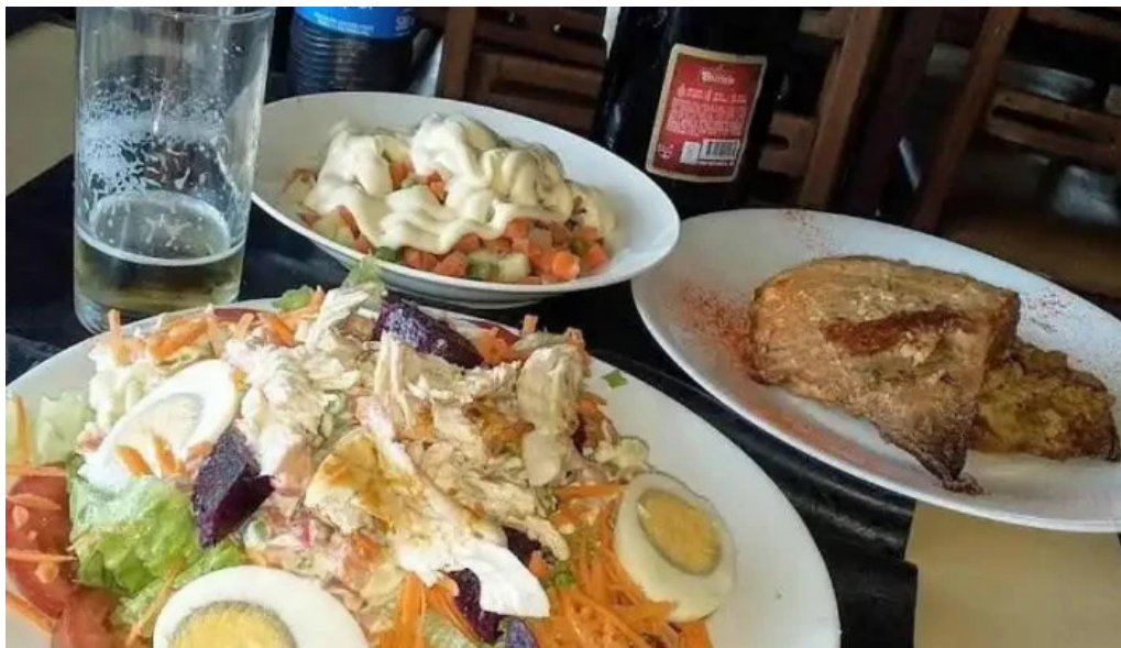
Bar san martin milanesa