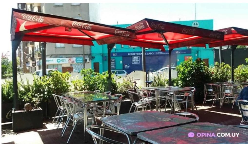
Bar san martin todas