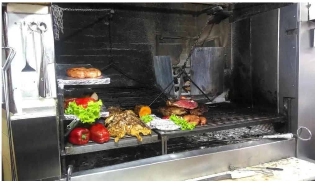
Bar san martin ambiente