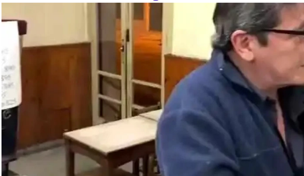
Bar noel videos