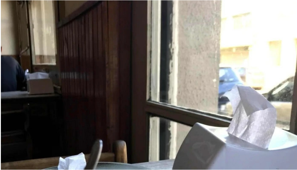
Bar noel comentario 2