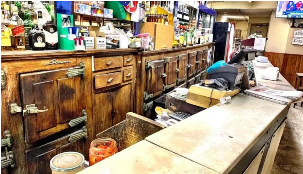
Bar noel montevideo