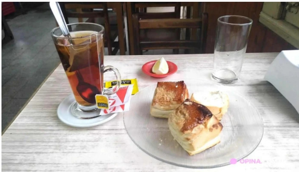
Bar Noel comidas y bebidas