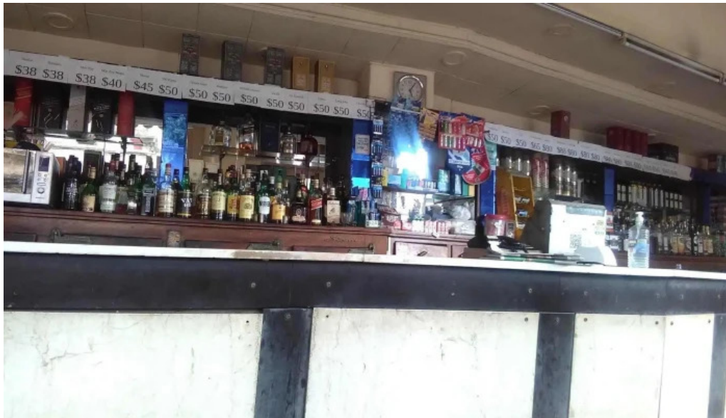
Bar Noel ambiente