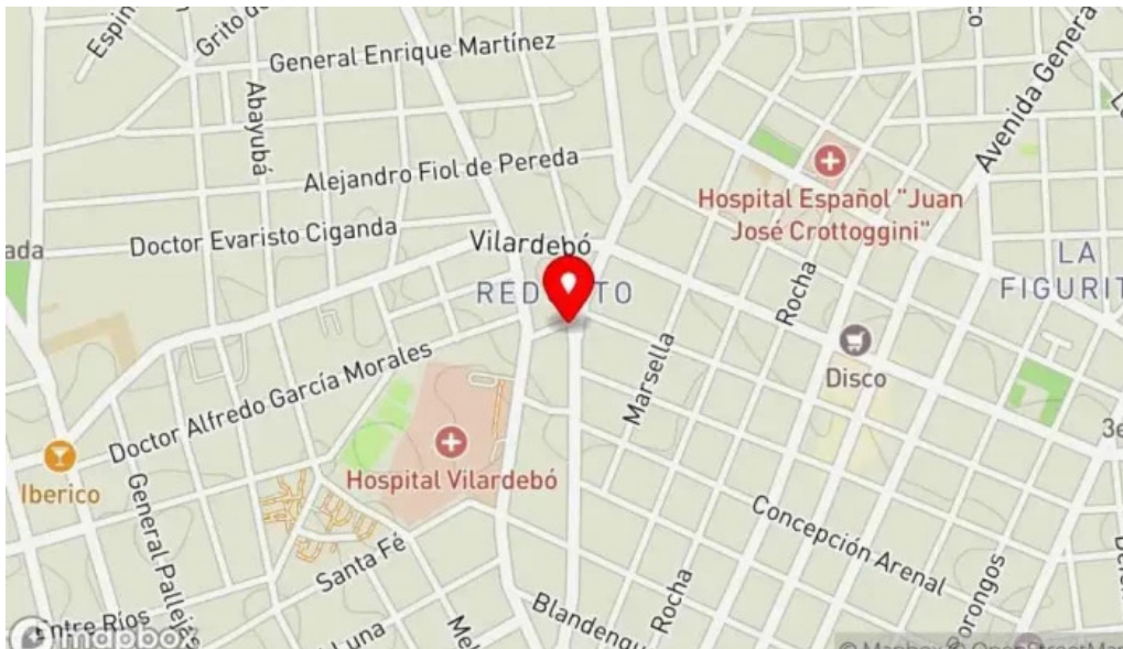
Bar Noel mapa