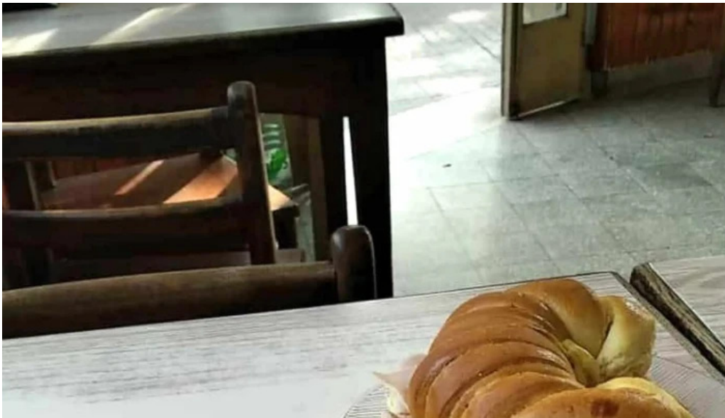
Bar noel comentario 1