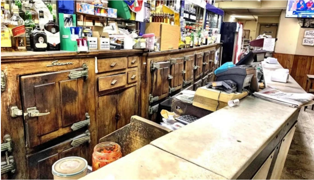
Bar noel todo